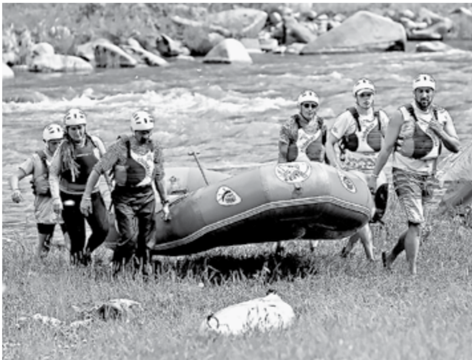
В основном на Алтай едут гости из соседних регионов.