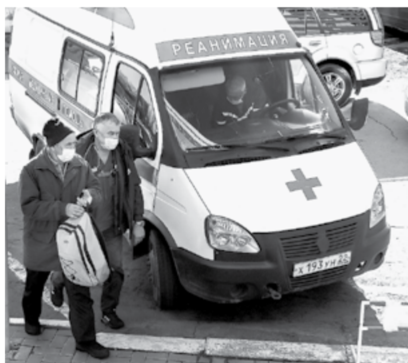
В разы выросло количество обращений в скорую.

Большая часть пневмоний, которые сейчас регистрируют в Алтайском крае, связана с COVID-19. На сегодняшний день у порядка 2 тысяч заболевших идет уточнение диагноза. Об этом сообщил главный инфекционист региона Валерий Шевченко.