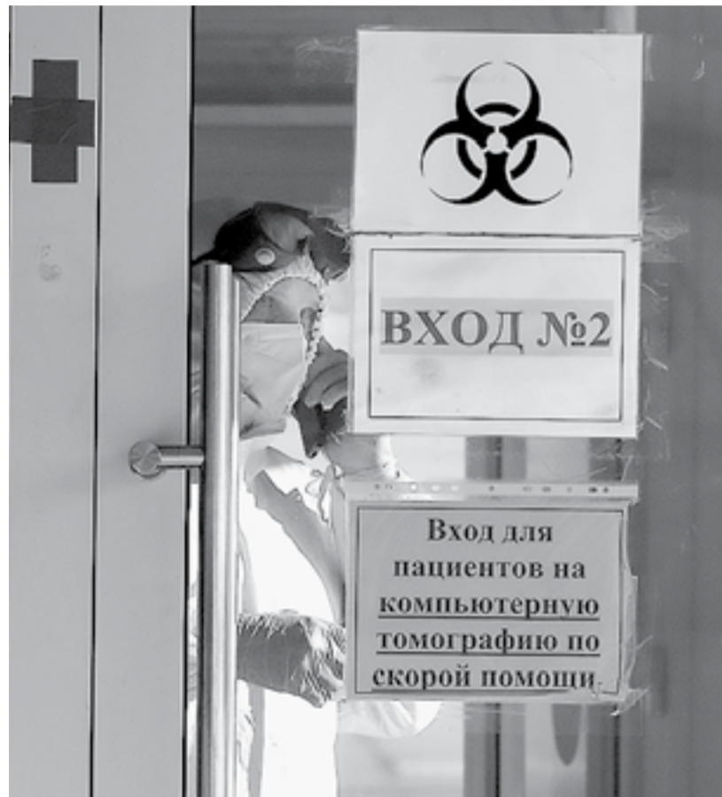
КТ позволяет выявить изменения в легких даже у асимптомных пациентов.