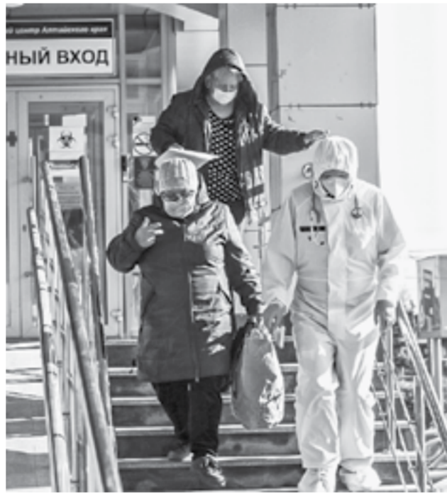
Барнаул. 6 октября.