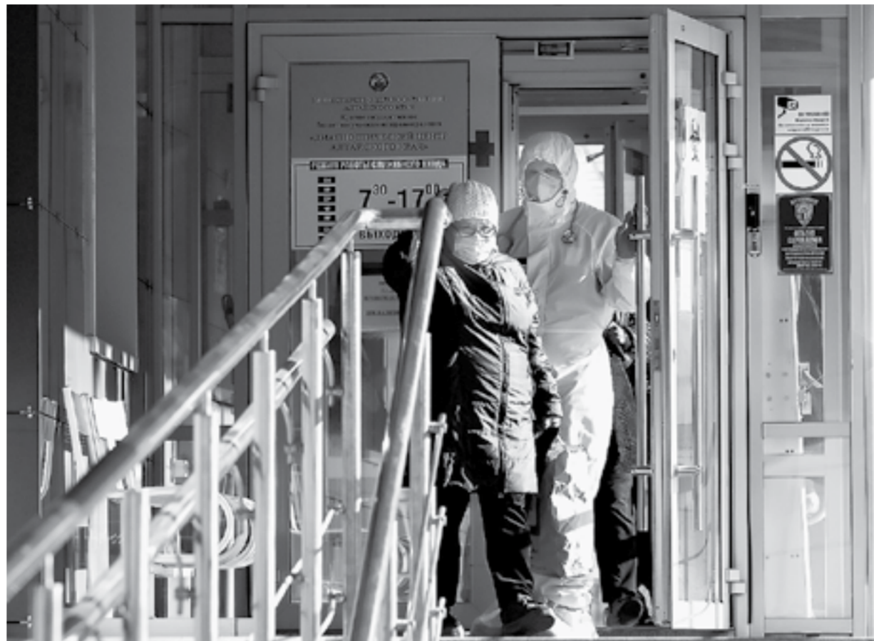
Обстановка с распространением коронавируса очень тревожная.