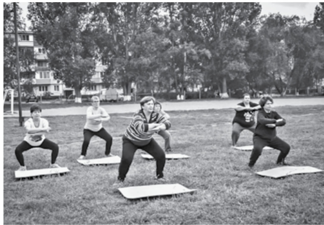
В хорошую погоду тренировки проходят на свежем воздухе.

Действие проекта рассчитано на восемь месяцев. За это время предстоит подготовить к сдаче норм ГТО не менее пяти групп по 10 человек. Программа подобрана с учетом возраста, но постепенно нагрузка будет увеличиваться. Занятия включают в себя суставную гимнасти-