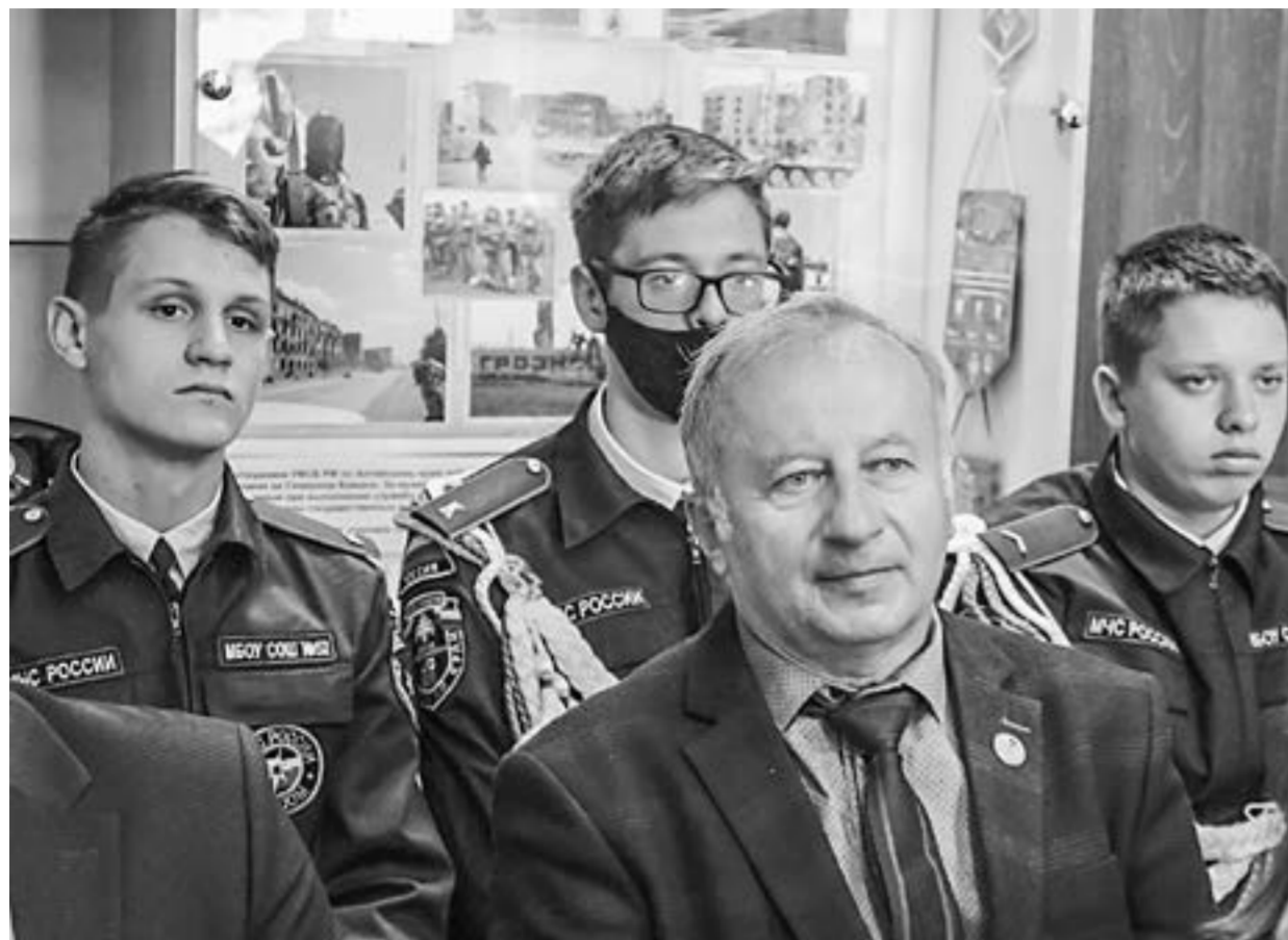
Во встрече участвовали школьники, молодые сотрудники УФСБ России по краю, ветераны ведомства.

В историко-демонстрационном зале Управления ФСБ России по краю прошло патриотическое мероприятие, посвященное личности Феликса Дзержинского. На встрече были ученики барнаульской школы № 52, молодые сотрудники, ветераны, представители общественных организаций, историки.