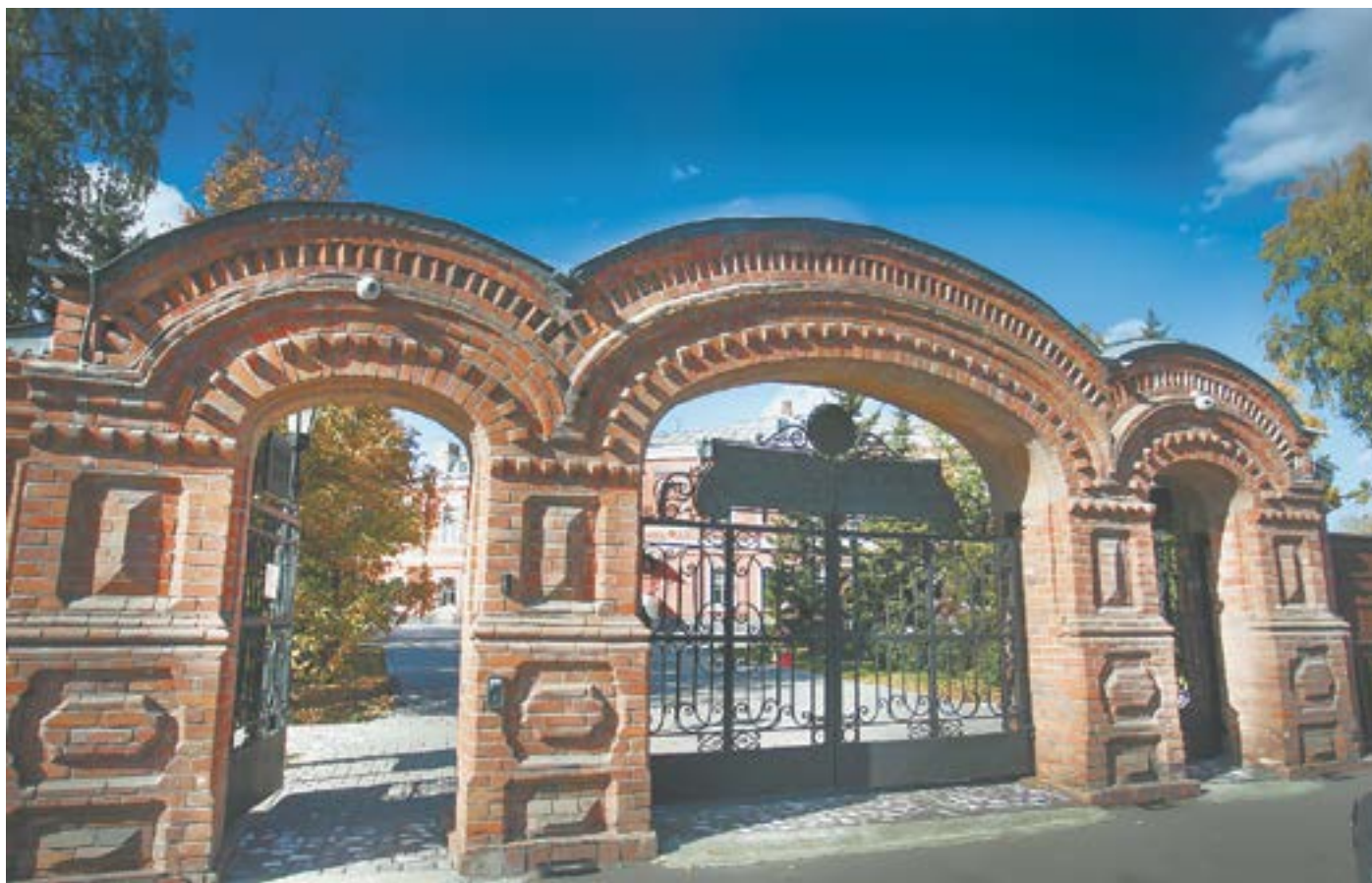
Ворота – визитная карточка музея.