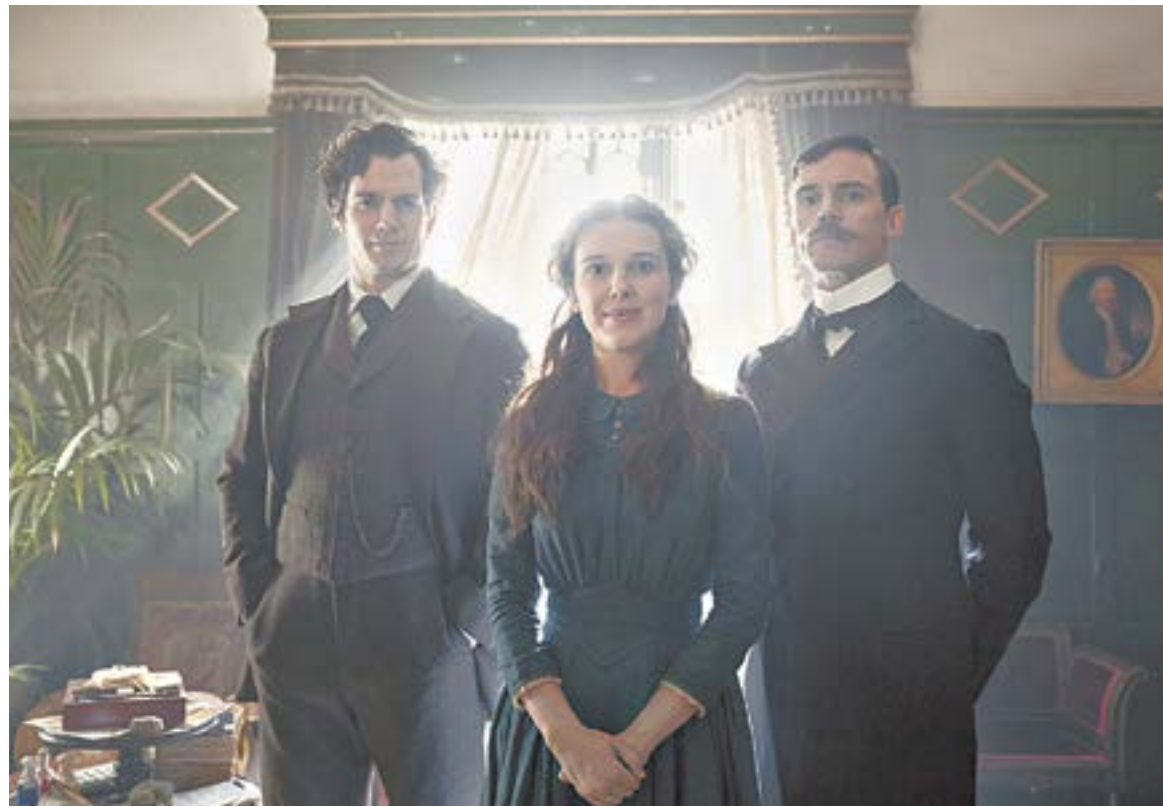
Энола с братьями Шерлоком и Майкрофтом.

А вот в американском сериале «Элементарно» с Джонни Ли Миллером идет явное отступление от традиций. Ватсон в этом фильме не мужчина, а женщина, кстати, ее сыграла Люси Лью,