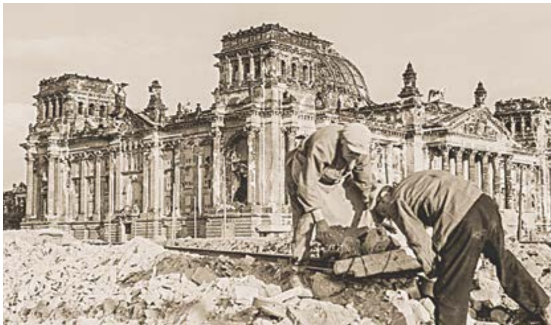
Долгие годы Рейхстаг был любимым местом для сборщиков металлолома.