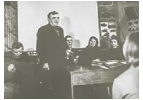
Первое заседание объединенных колхозов.