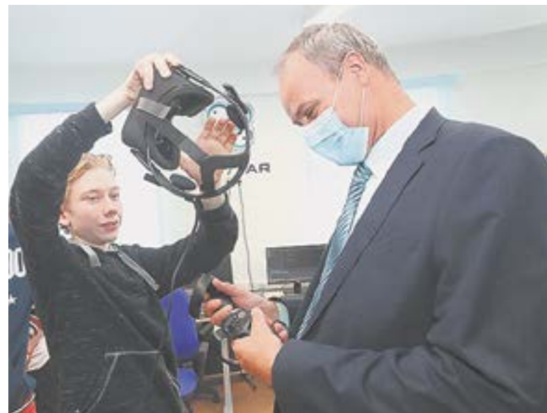
Ректор аграрного университета Николай Колпаков.