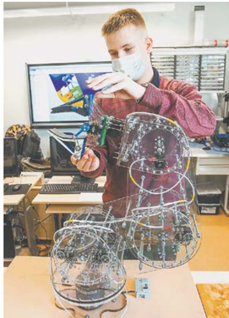
Проект робота виртуального присутствия.