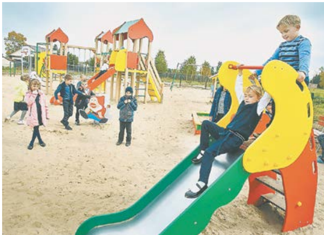
На детской площадке.