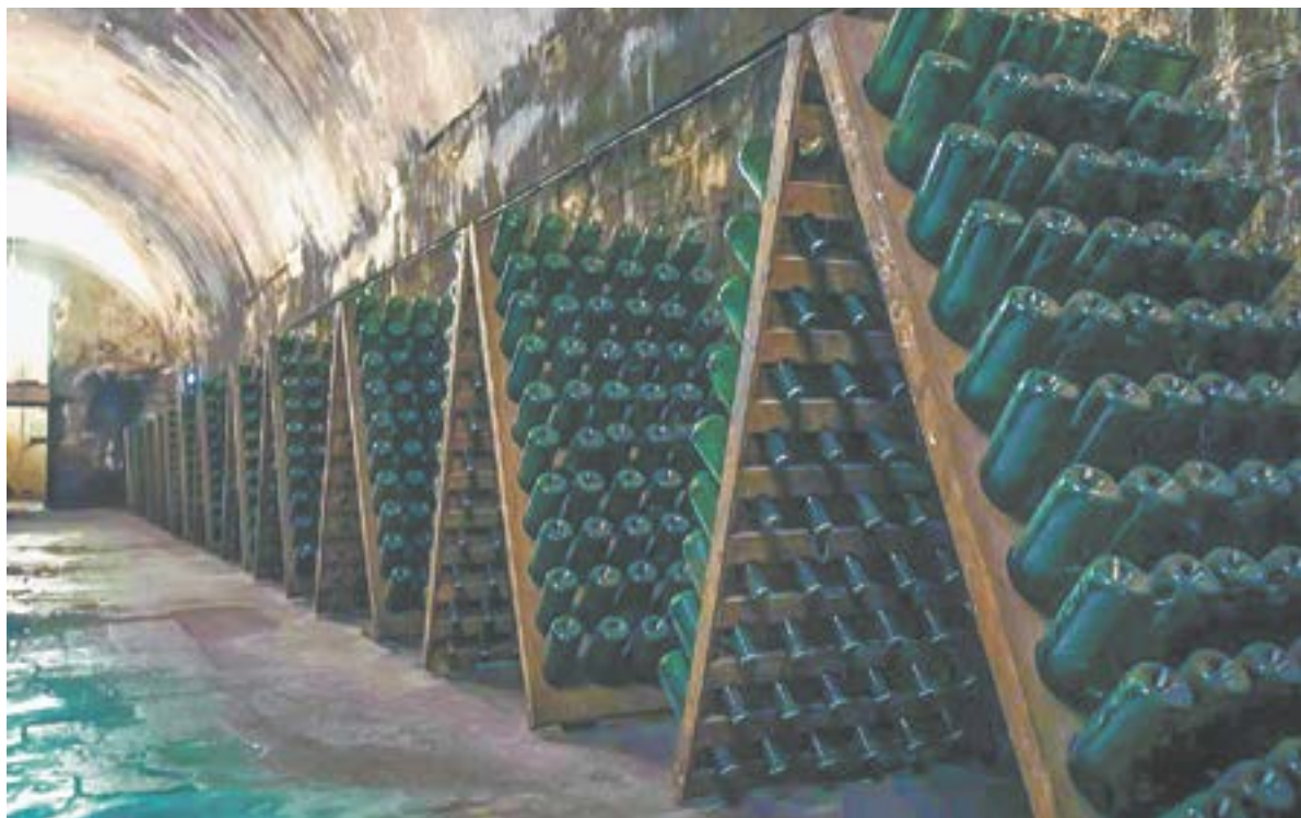
В этих пюпитрах осадок сползает к горлышку бутылки.

А шампанское начинается с приготовления тихих вин, которые не содержат газа. Из каждого сорта винограда необходимо сделать свое тихое вино. Раньше сусло наливали в дубовые бочки объемом пять кубометров, теперь в