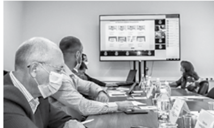
На участие было подано рекордное число заявок.