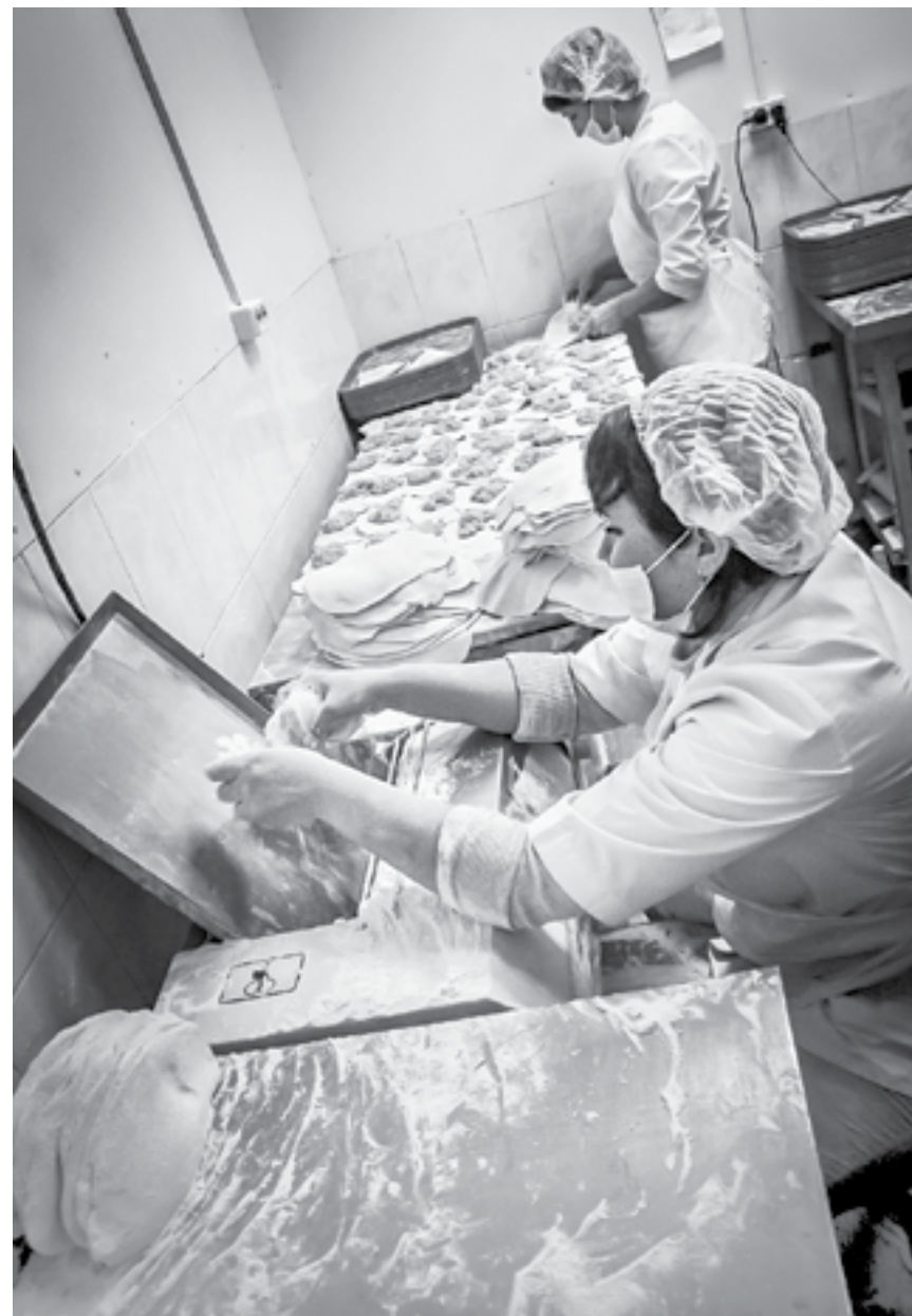
Лепщицы цеха мясных полуфабрикатов.

– Спросишь у них, сколько будет 100 плюс 200, и пауза минут на пять, не говоря уже о знаниях программы 1С. Книгу учета не умеют вести, проводить ревизию тем более. Водителей не хватает. Один парень три дня отработал и исчез. Даже не позвонил. Когда пришел за зарплатой, сказал, что не мог найти телефон предприятия и предупредить, что передумал работать. Его график 5/2 не устраивает при зарплате 25 тысяч рублей, – объяснил он. – А после того как повысили детские пособия, некоторые многодетные родители уволились. Говорят: «А нам зачем? У нас пятеро детей, я буду дома сидеть и в несколько раз больше получать, чем у вас. Мы раз в две недели даем объявление, ищем рабочих. Нехватка кадров – это общая проблема для города.