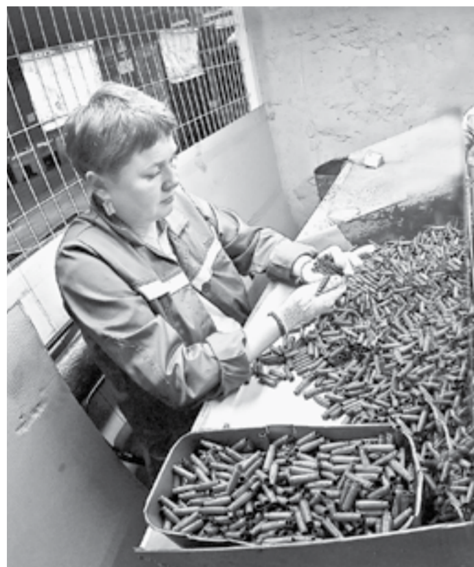
Патроны на миллионы.