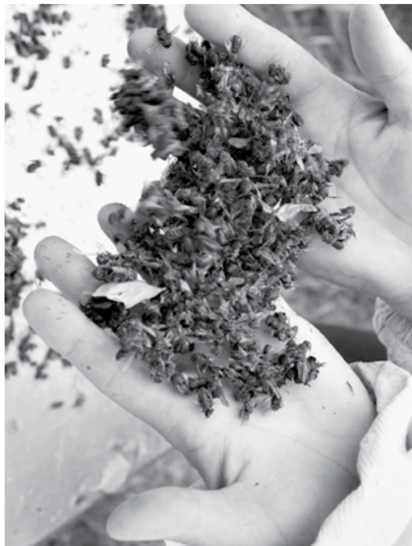
В пчелах, рапсе и почве найдены одинаковые вещества.

— Страшнее всего, что нам не отвечают, можно ли пользоваться старыми