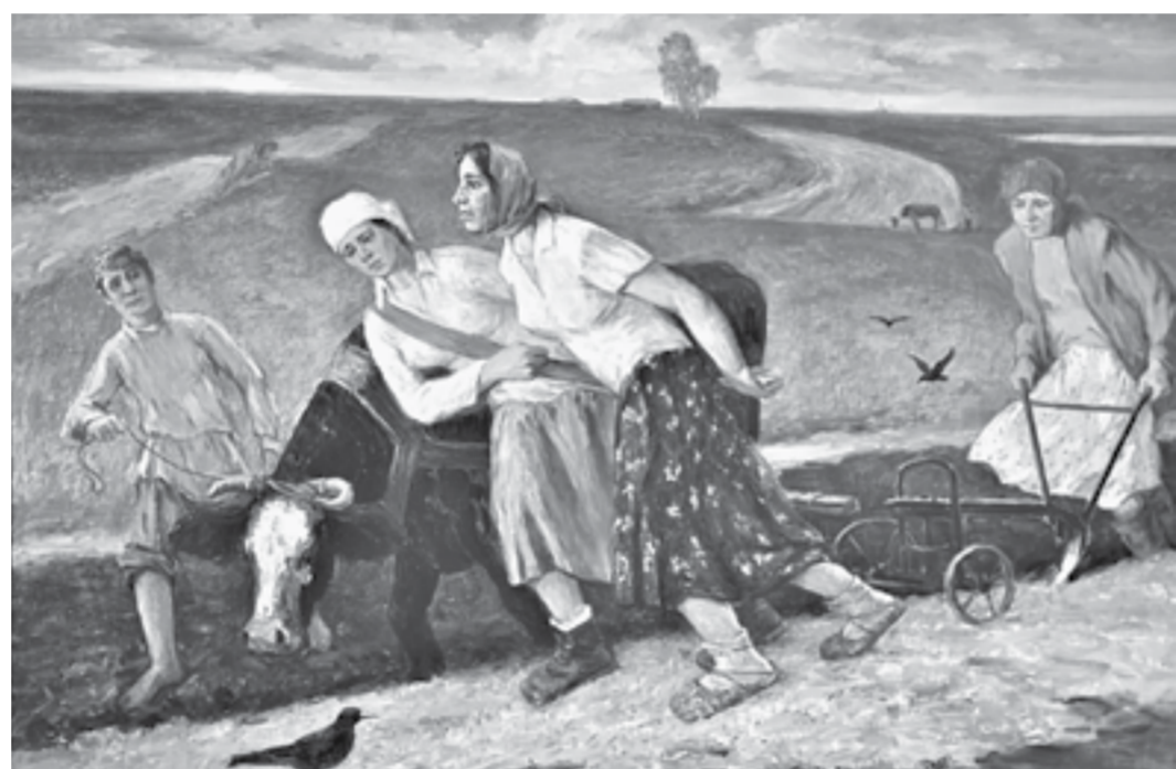
Картина «Весна сорок пятого».

Я рад, что моя выставка открылась ко Дню города. Живопись занимаюсь 50 лет. Трудно сказать точно, за какое время создаю свои работы. Например, картину «Кормилица», где женщина обнимает коро- ву, готовил десять лет. Думал,