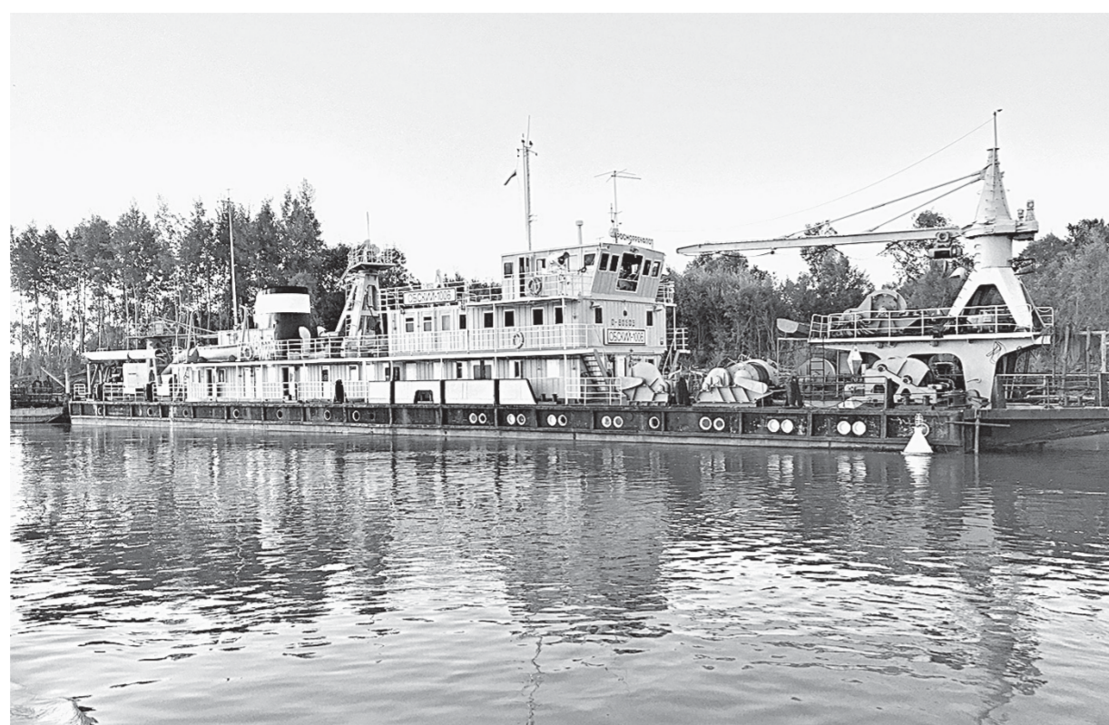
Самый мощный в крае земснаряд несколько лет назад хотели списывать.

Еще три года назад речная навигация в Алтайском крае длилась чуть больше двух месяцев. Сегодня грузы по водным путям перевозятся в течение полугода. Все благодаря дноуглубительным работам, которые производит Барнаульский район водных путей и судоходства.