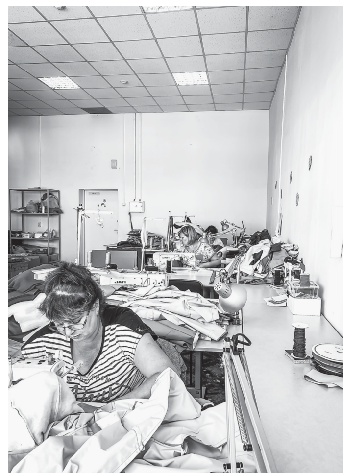
В цехе компании «Дикая скорость».

Оксана считает, что еще одна выигрышная позиция в ее бизнесе – это тщательно подобранный коллектив, который сегодня насчитывает семь человек. По словам предпринимателя, «все работают на одной волне, а это очень важно. И я, пожалуй, считаю это самым большим своим достижением. Я не могу сказать, что мы так уж круче