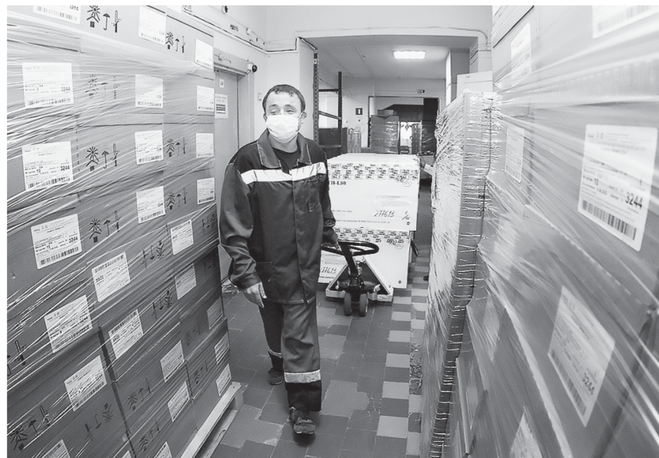
На складе предприятия «Аптеки Алтай».