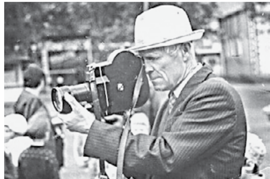
Народные кинооператоры «Маяк» сняли 4 тысячи минут жизни сел.

Подготовила Иванна БИТТЕР.