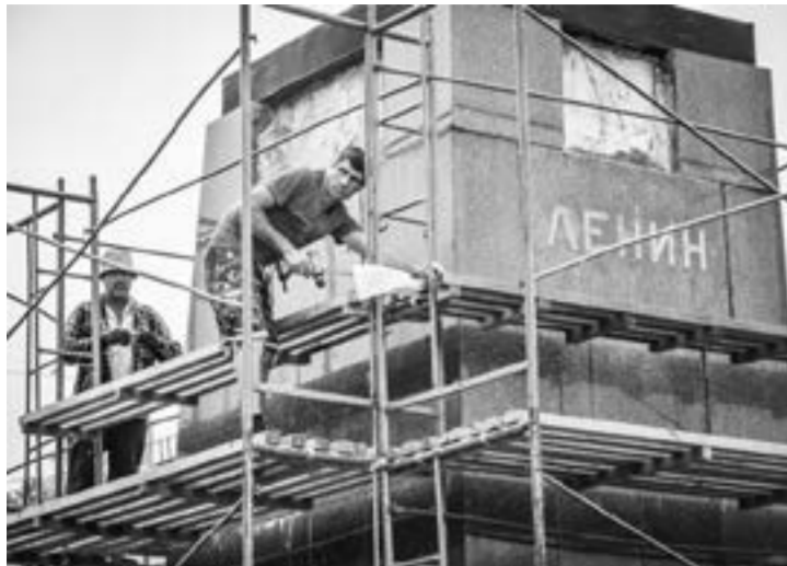
На постаменте памятника восстанавливают облицовочную плитку.