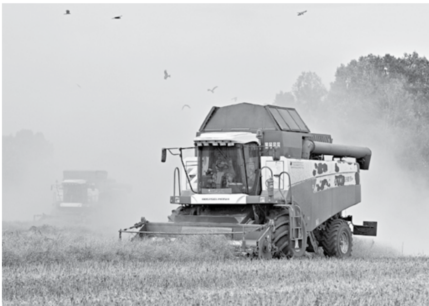
Идет уборка рапса.