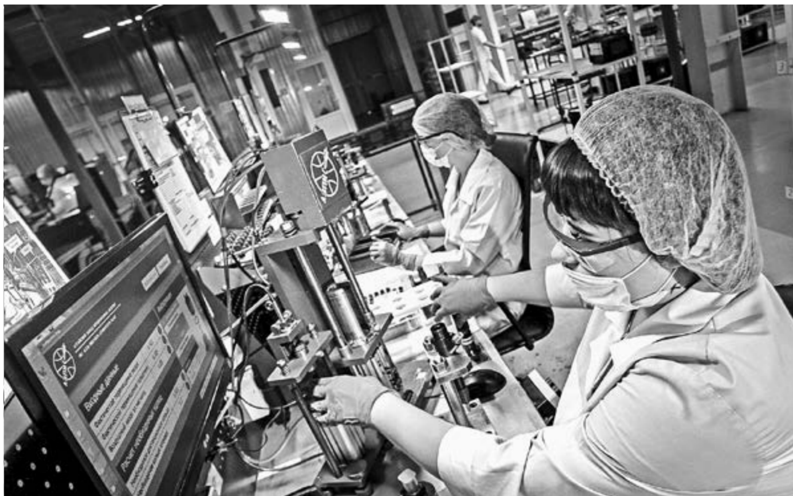
Несмотря на сложную экономическую ситуацию, завод увеличивает объемы производства.

– Нужно больше объемов федеральных ресурсов привлечь сюда, в экономику Алтайского края, – рассказал губернатор. – Президент страны поставил задачу перед всеми регионами не просто обеспечить устойчивость экономики в этот непростой период, но и к 2021 году восстановить рынок труда.