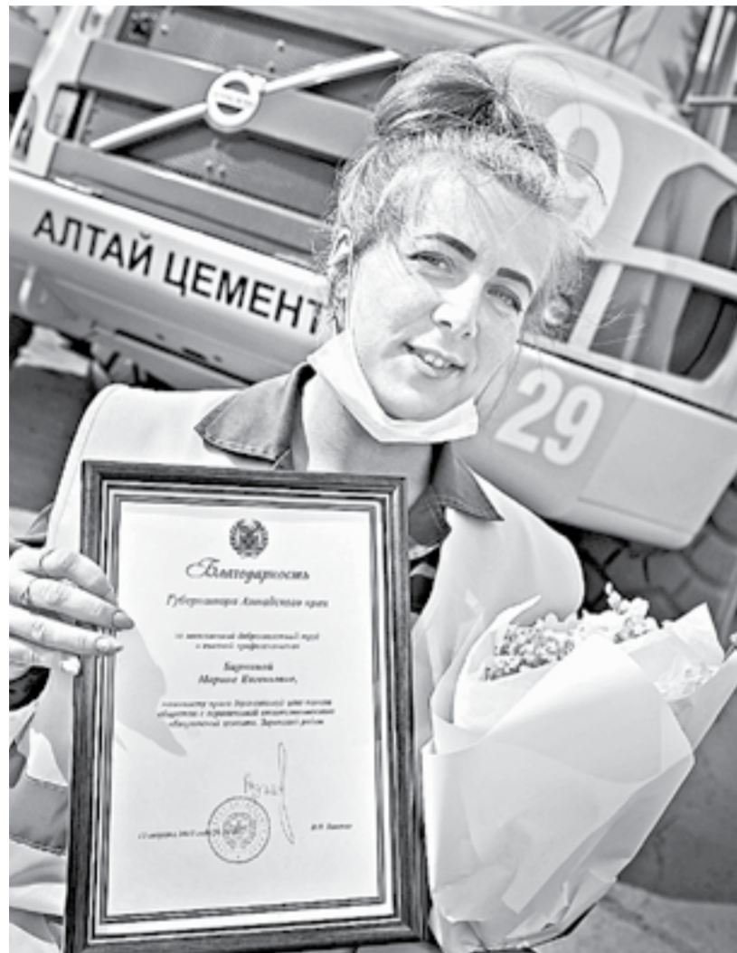
Лучшие сотрудники завода получили в день открытия награды.