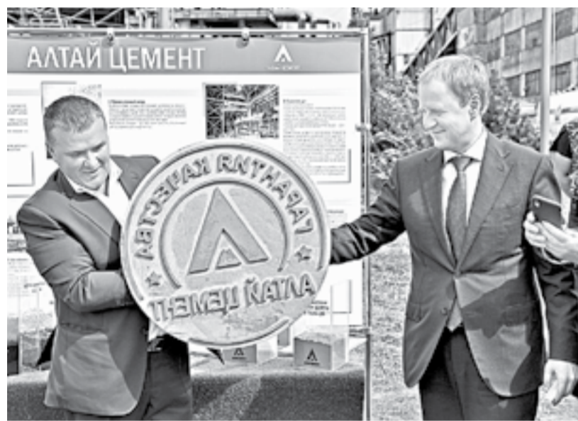
Памятный оттиск – первое изделие из голухинского цемента.