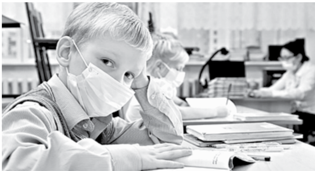
Учебный год по традиции начнется 1 сентября, но в особом режиме.

С 17 августа по предварительной записи возобновился прием в управлениях социальной за-