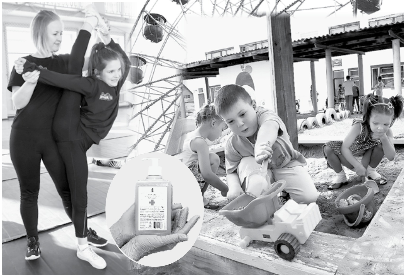
Основное требование – жесткое соблюдение рекомендаций Роспотребнадзора по профилактике коронавирусной инфекции.

– Родителям надо предварительно предупредить образовательную организацию о выходе ребенка в детский сад, а также взять справку в