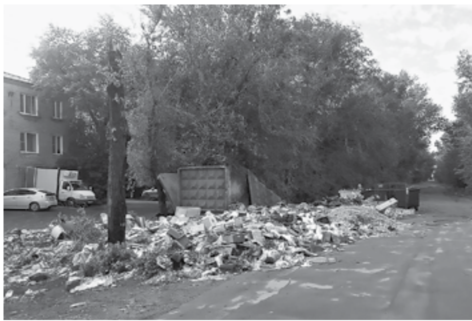
Около контейнерной площадки образовалась огромная свалка.

Но в последнее время свалки вновь стали расти, а на прошлой неделе мешки не вывезли и из частного сектора. В среду в администрации Рубцовска прошло заседание городской комиссии по предупреждению и ликвидации чрезвычайных ситуаций, на котором был рассмотрен вопрос о санитарном состоянии территории города. Участники признали, что работа по сбору и вывозу бытовых отходов и мусора организована ненадлежа-