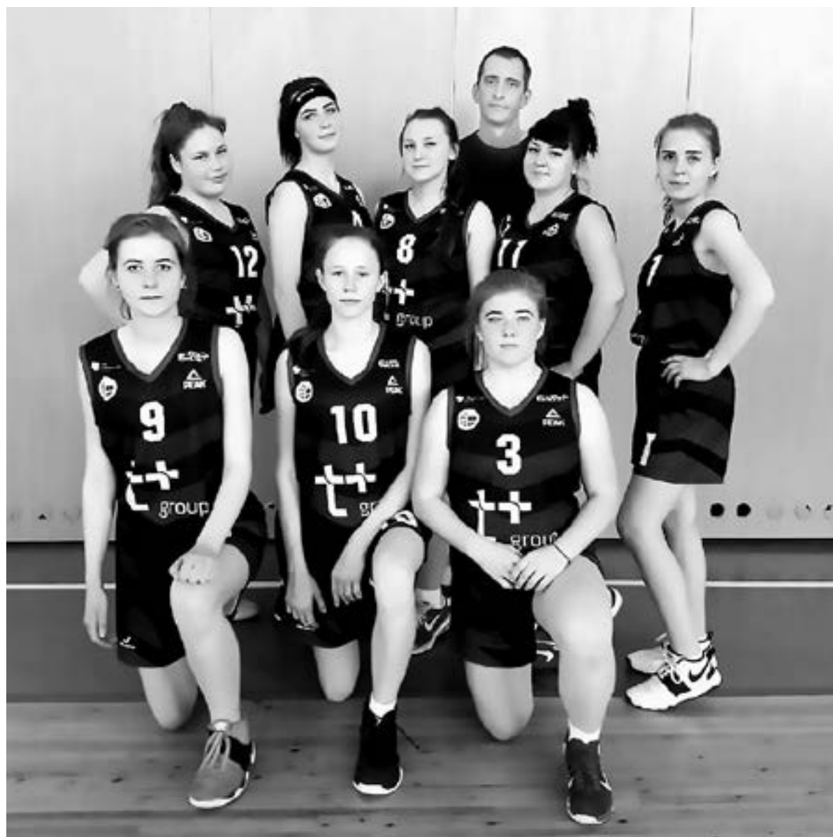
Девчонки-баскетболистки – одни из сильнейших в крае.

Большой вопрос. Скорее всего, далеко не все из них вернутся после снятия ограничений в залы, на игровые площадки. Ведь даже те, кто раньше не пропускал ни одной тренировки, после вынужденного карантина окончательно предпочли им мир виртуальный, общение в соцсетях. И это притом, что условия для тренировок