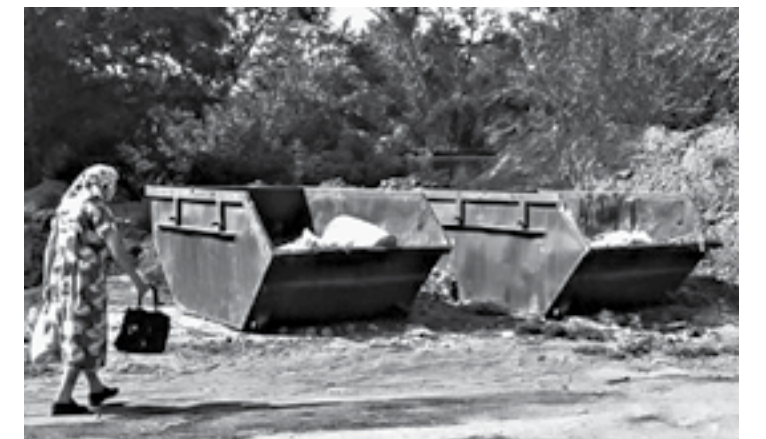
Такие бункеры устанавливают в частном секторе.