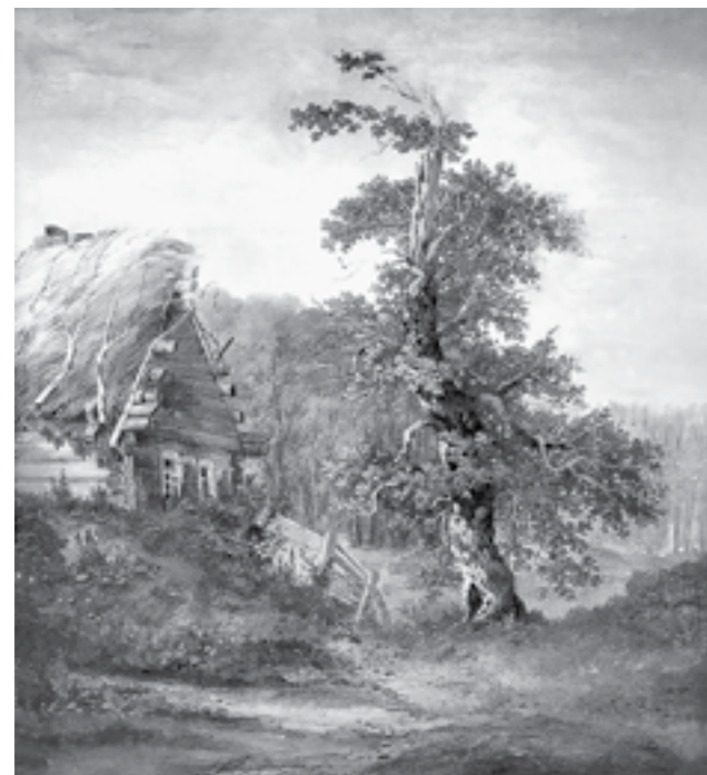
А. Саврасов «Избушка и сломанный дуб».

уникальна. Как известно, в России существовало два центра подготовки художников – Академия художеств в Санкт-Петербурге и МУЖВЗ. И было две школы – Санкт-Петербургская и московская.