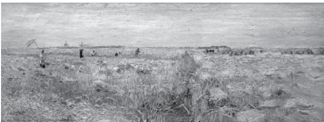
Герасимов А.М. «Рожь покосили».

История Московского училища живописи, ваяния и зодчества