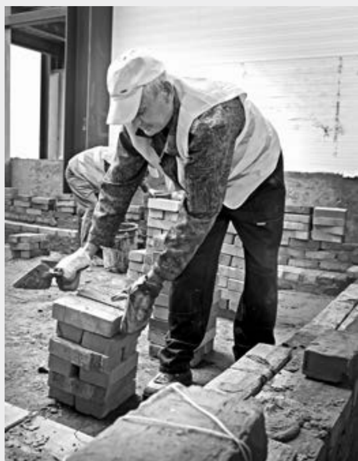
Здесь делают лестничную клетку.

Спортсмены тоже очень ждут, когда закончится строительство. Ведь им приходилось