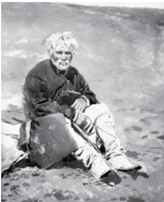
В. Манковский «Хрестьянин с нунтом».