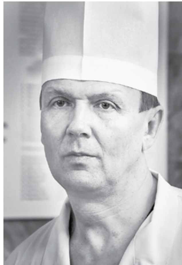
Врачи Краевой клинической больницы скорой медицинской помощи проводят наибольшее количество экстренных операций в регионе.