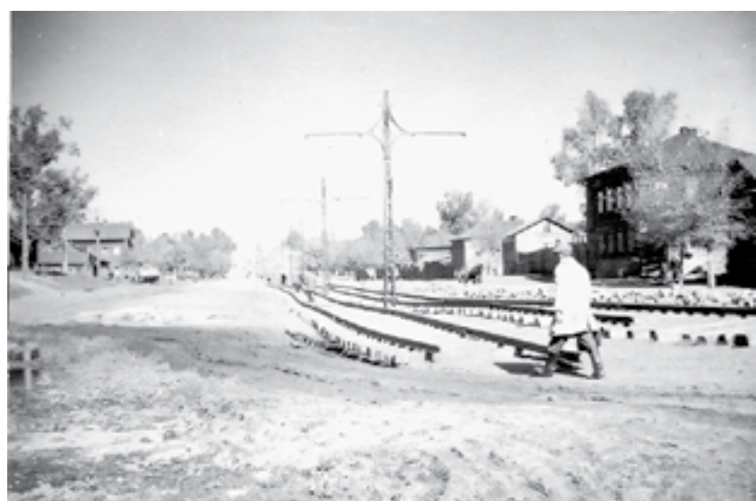
1947 год. Скоро пойдут трамваи...

Уникальную выставку подготовили к 290-летию Барнаула в краеведческом музее (АГКМ).