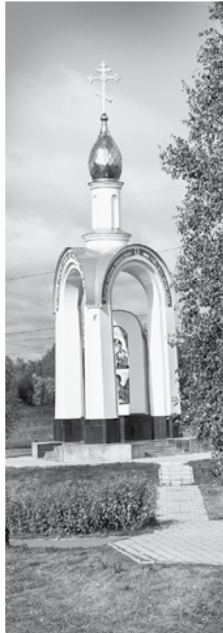
Часовня памяти Михаила Евдокимова.

– Михаил Евдокимов – это великий русский парень, – рассказывал про него народный артист России Александр Михайлов. – Сергееч мне говорил: «Вот если бы в каждой