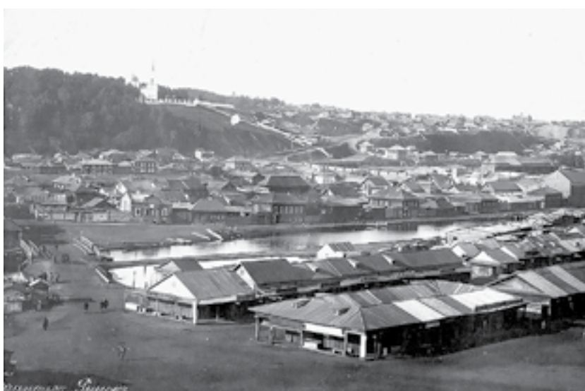
Дореволюционный «Рынок» Барнаула.

Работы фотографов – профессионалов и любителей – охватывают более века истории города. Здесь может быть увидеть творения (иначе их не назовешь!), ставшие классическими, – снимки Борисова, Казанского, Борисенко. Образы деревянного города будут дополнены старыми напечатанными, а также коллекцией навесных замков и ключей из фондов музея. Современный облик города мы увидим через объектив Михаила Хаустова, Олега Укладова, Сергея Семенова, Евгения Кучинева. Также в этом разделе представлены фотографии, собранные в рамках