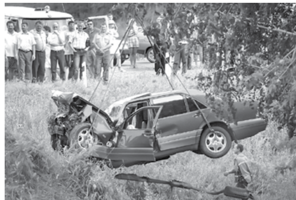
На месте аварии.

деревне было по маленькому Евдокимову...» И я думаю: что бы было с нашей деревней, с нашей Сибирью? К сожалению, таких ребят мало. Они берут на себя мощный груз возрождения России. Это люди, которые по-настоящему любят свою Родину, свои корни.