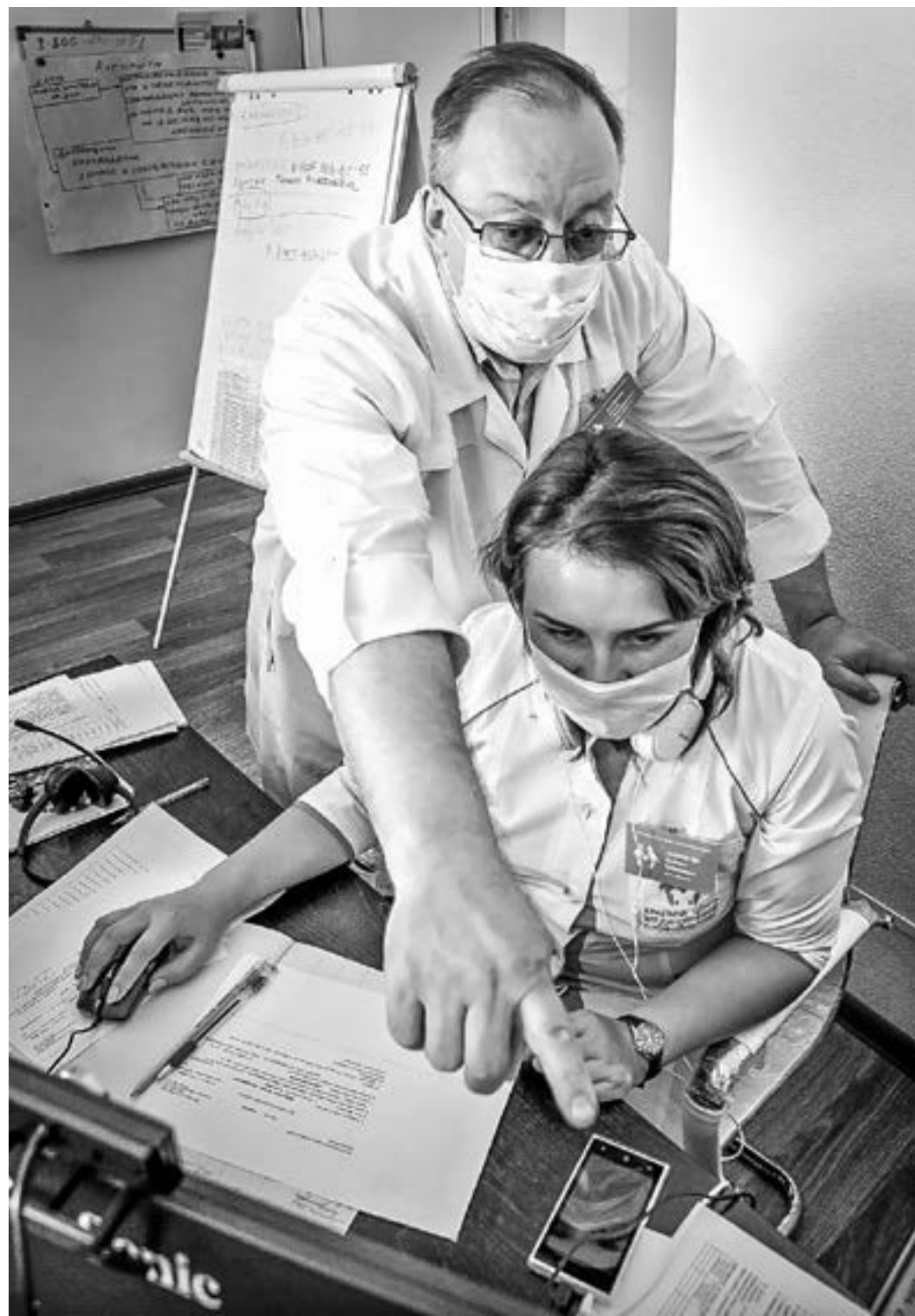
Эпидемия дала старт бурному развитию специализаций телемедицины.

Предпринимаемые сегодня властями страны и региона меры поддержки отраслей, пострадавших в эпидемию,