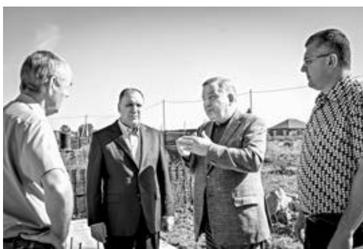
Обсуждение вопросов строительства.

Его визит был связан со строительством в райцентре двух социально значимых объектов: яслей-сада и школы, так необходимых для этого крупного рабочего поселка. Перед районом сегодня стоит задача – обеспечить для 2,5 тысячи проживающих в нем детей современные условия получения