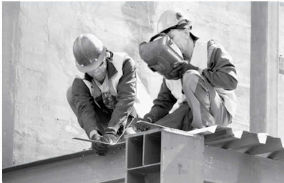
На строительстве объекта.