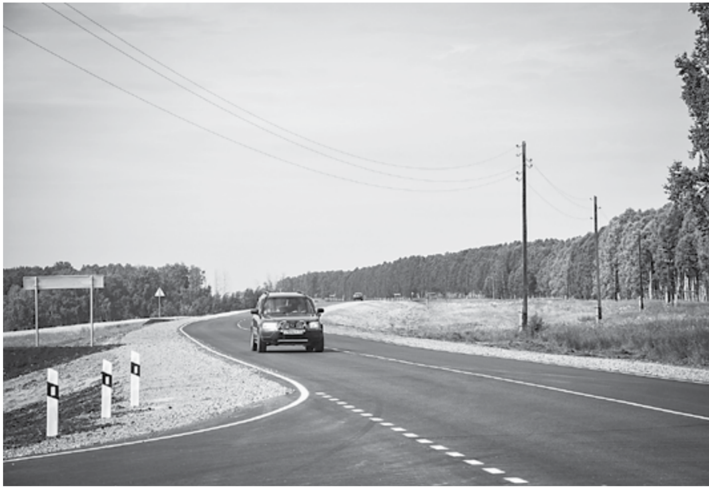
В перспективе трасса Белоярск – Заринск разгрузит Чуйский тракт.