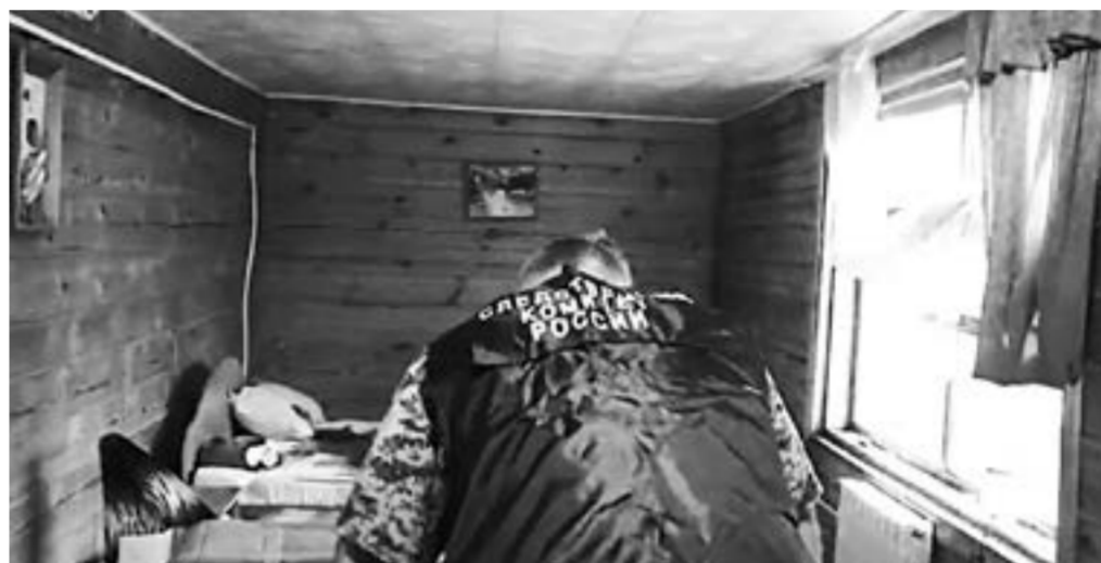
Криминалисты управления Следственного комитета РФ по краю обследовали номер.

О драке высказались и профессиональные спортсмены. Например, трехкратный олимпийский чемпион по греко-римской борьбе Александр Карелин так прокомментировал драку в Барнауле: «Мы все – оружие». Навыки единоборств накладывают на спортсмена определенные обязательства – он не должен быть несдержанным в быту.