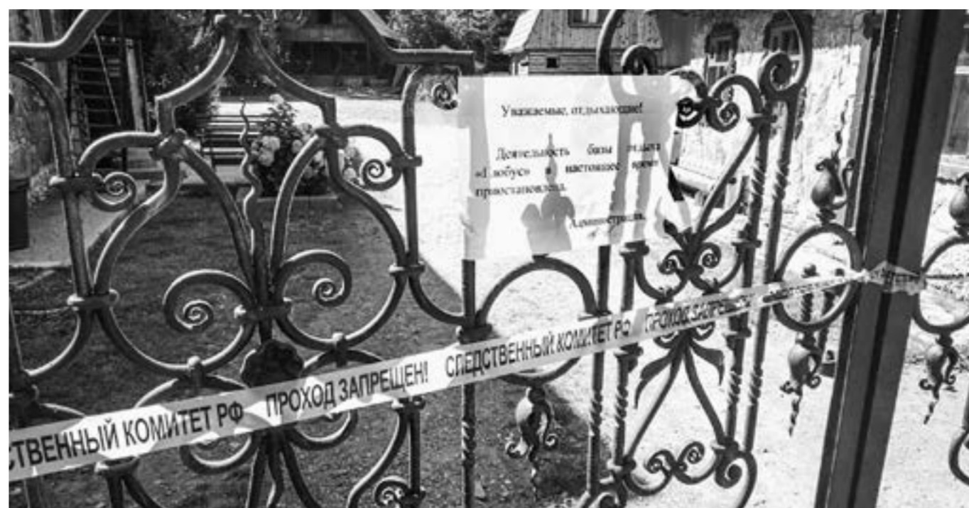
Турбаза, где погибла семья, пока закрыта.