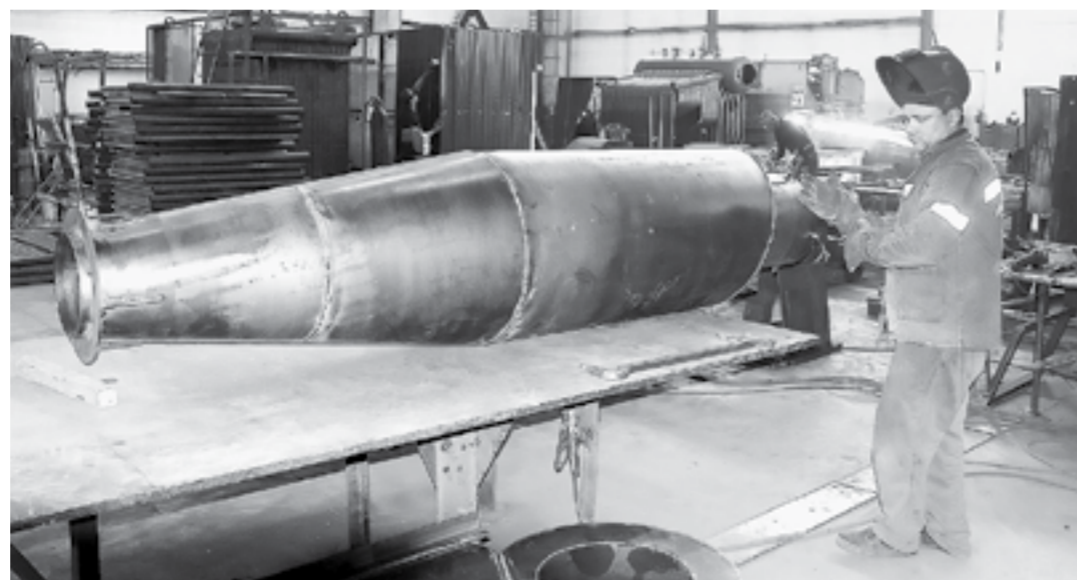
Изготовление циклона для очистки воздуха в одном из цехов «Промкотлоснаба».

Участвующим в нацпроекте «Повышение производительности труда и поддержка занятости» котельным заводам края удалось перевыполнить плановую эффективность производства. Речь идет об ООО «Производственное объединение «Межрегионэнергосервис» и группе компаний «Промкотлоснаб». Впереди у них большие планы.