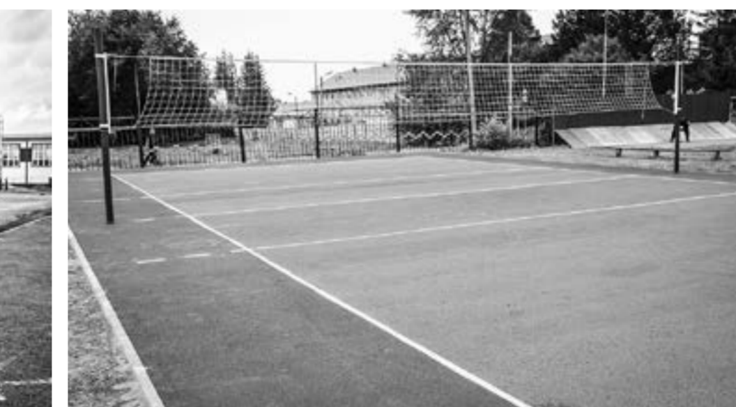
Стадион стал центром спортивной жизни села.

– Сделана заново беговая дорожка на 330 метров, стометровка теперь с резиновым покрытием. Отремонтировали городскую площадку, появилась новая