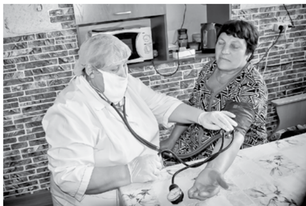
Теперь мобильные бригады оказывают помощь на дому.

В Алтайском крае в связи с риском распространения коронавирусной инфекции COVID-19 была полностью переориентирована работа мобильных бригад в сельской местности.