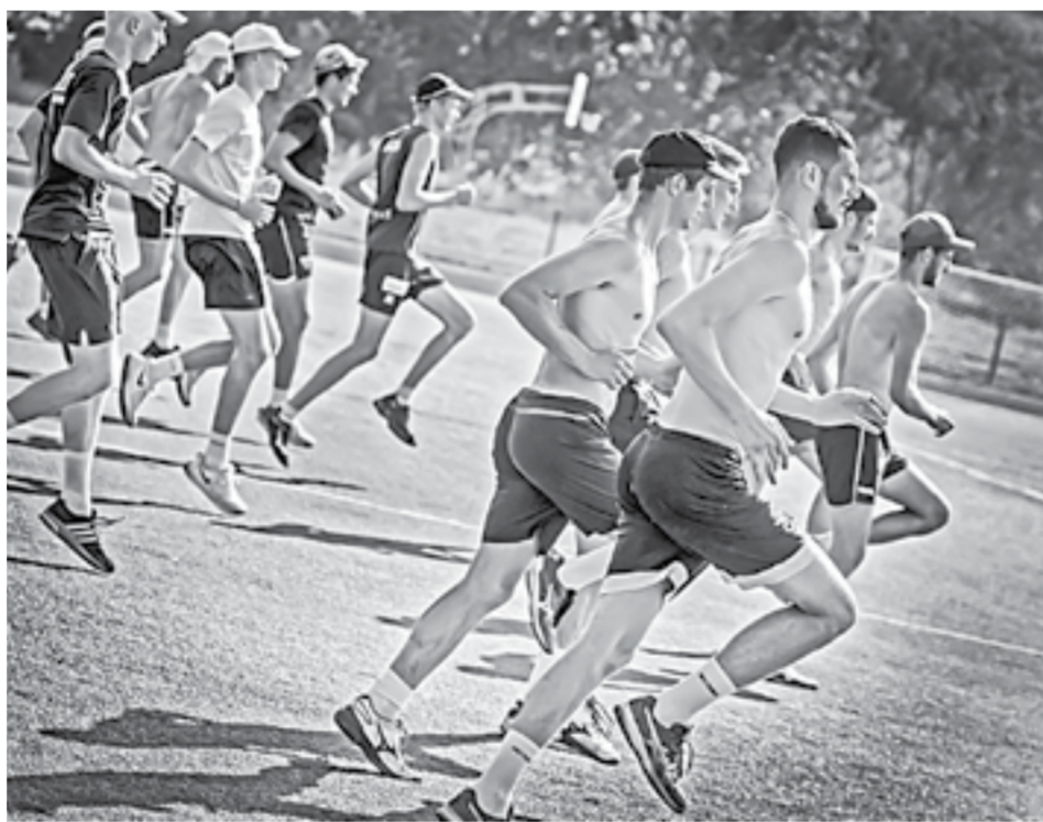
Волейболисты начали подготовку с лёгкой атлетики.