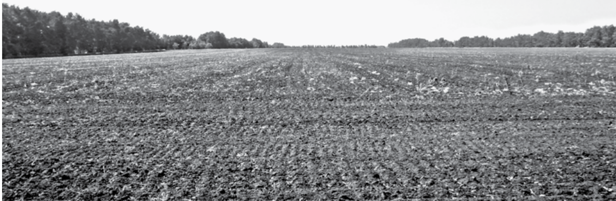
Пусто в поле – пусто и в закроме.