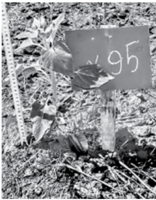
На почве, зноем раскаленной.

Не будет ли так и в этот раз? Мы канителемся, собираем документы, чтобы получить господдержку, а если вдруг в августе пойдут дожди