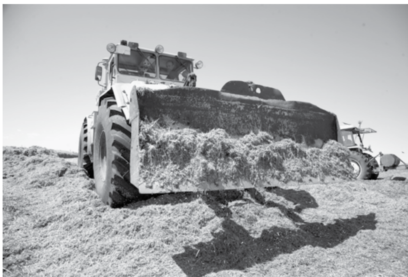
В «Кулундинском» активно готовятся к уборочной кампании.

Вслед за этим сохнуть начала у нас и лесная мелиорация. В поселке Октябрьском на центральной усадьбе ЗАО «Кулундинское» функци-