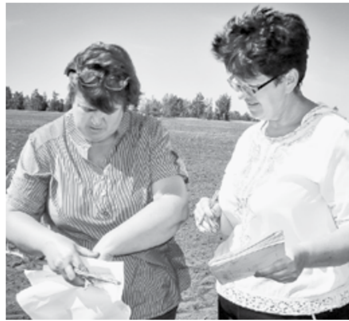
Специалисты «Кулундинского» оценивают ущерб от засухи.