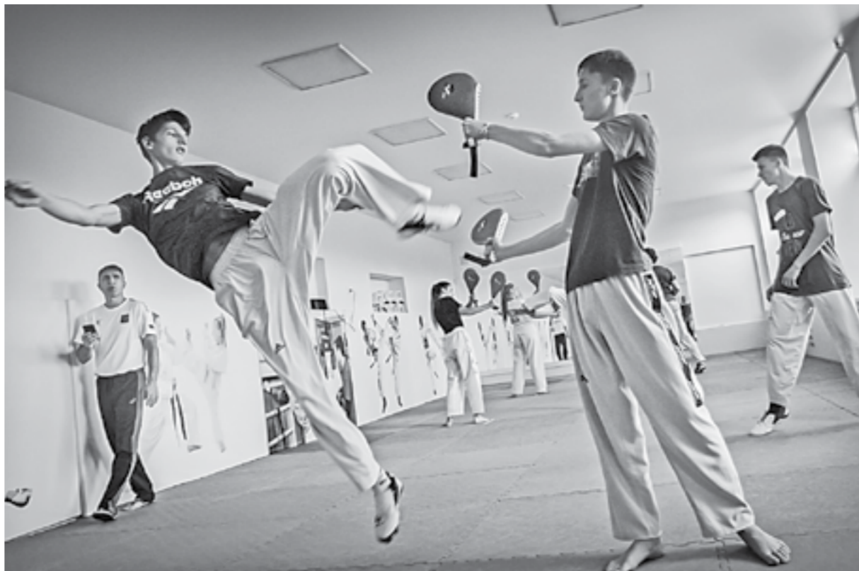
Спортсмены приступили к тренировкам в зале с отличным настроением.

Произошло оживление и в школе «Звёздные клинки». Из открытых окон помещения автоколонны 1247, где последние годы базируются фехтовальщики, вновь раздаётся сабельный звон. «Мушкетёр» идеально вписывается в рекомендации Роспотребнадзора: во время поединков они без проблем соблюдают полуметровую дистанцию друг от друга, к тому же работают в специальной экипировке и защитных масках, которые после каждой тренировки обрабатываются антисептиками.