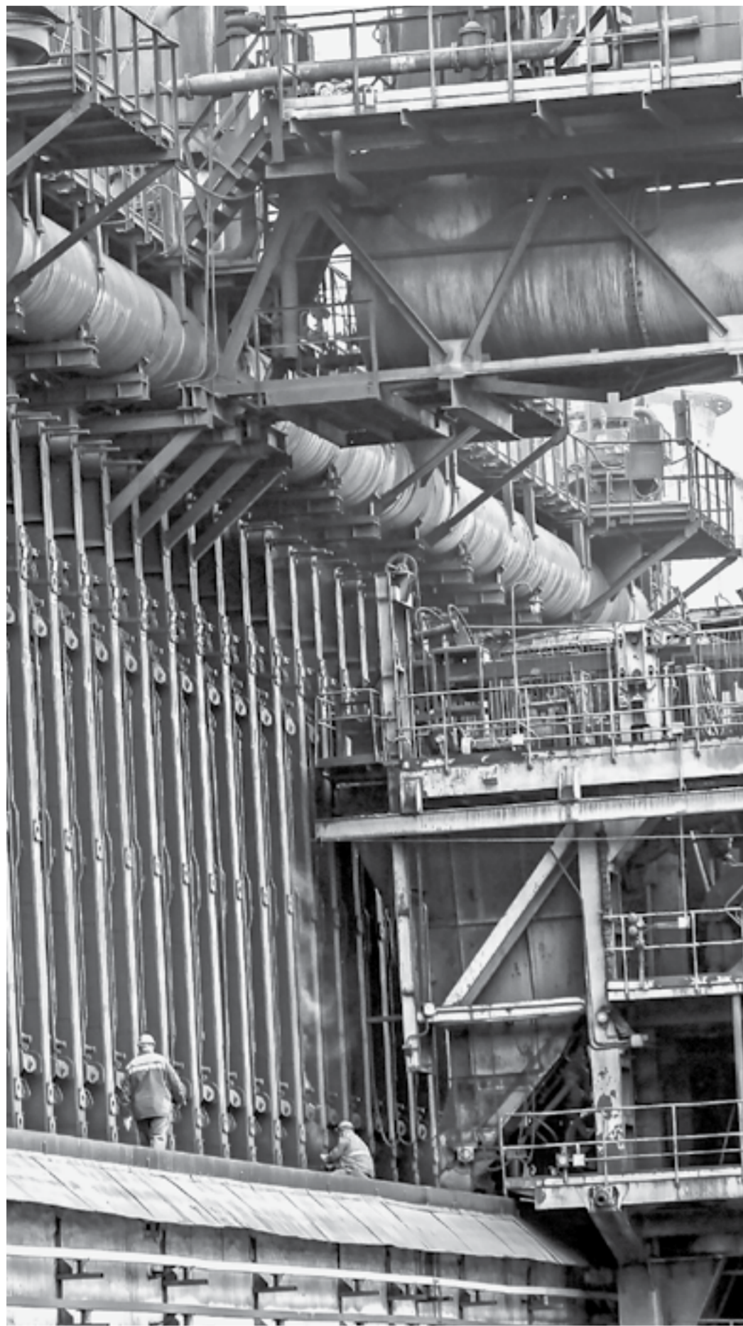
На предприятии «Алтай-Кокс».

Всё первое полугодие крупнейшее в крае предприятие «Алтай-Кокс» наращивало выпуск продукции, поэтому отмечает профессиональный праздник с чувством выполненного долга.