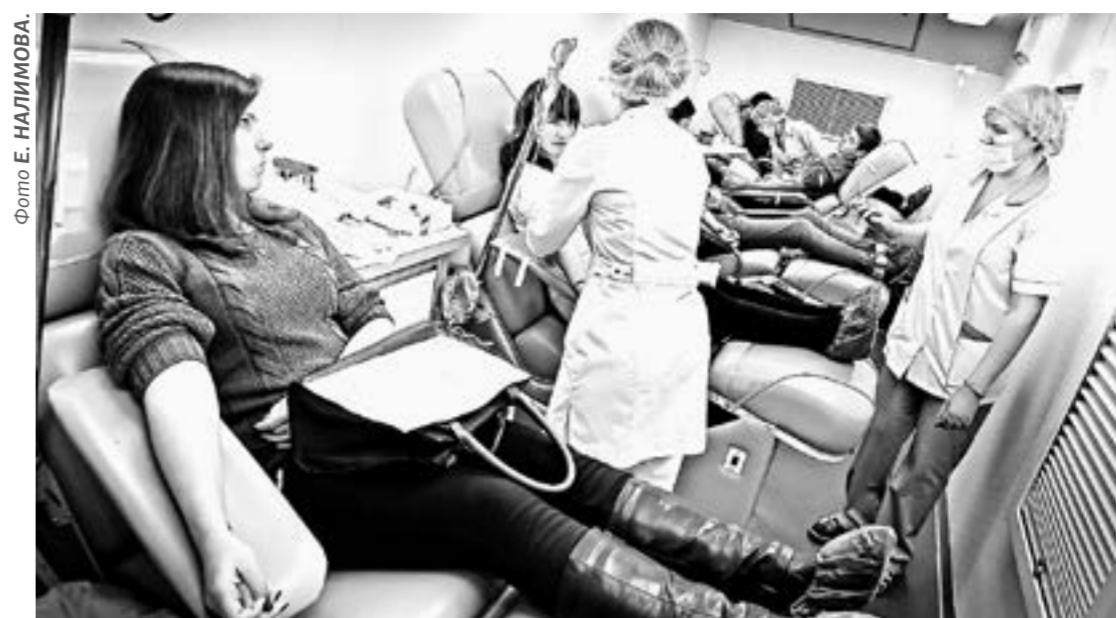
Готовиться к сдаче крови нужно загодя.