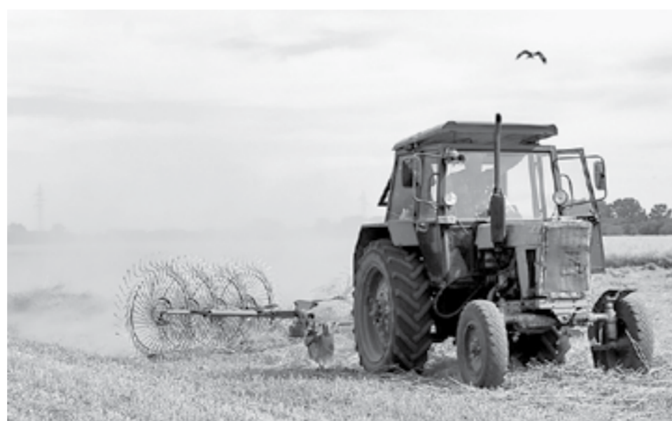
Сено собирается в валки.