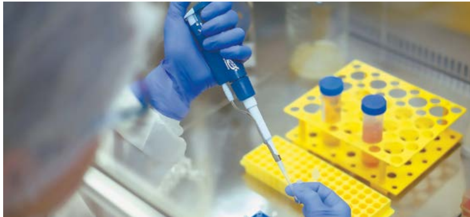
Вакцина на подходе, надо продержаться.

– Под классической пневмонией мы понимаем острый воспалительный процесс с поражением бронхиального дерева и ткани легкого. Ковид-пневмония по своей сути – это инфаркт легкого. Развивающийся при COVID-19 тромбоз сосудов органа препятствует свободному попаданию кислорода в кровь, вызывая острую дыхательную недостаточность. Позднее на фоне застойных явлений может присоединяться и обычная бактериальная пневмония, но уже как осложнение. Аналогичная картина наблюдалась и при поражении легких во время эпидемии свиного гриппа. Уже в тот период алтайские ученые разработали методику лечения тяжелых вирусных пневмоний, основанную на применении антикоагулянтов для восстановления кровотока в легких. Так удалось снизить летальность с 16% в первый месяц до 1,5% – в последующие.