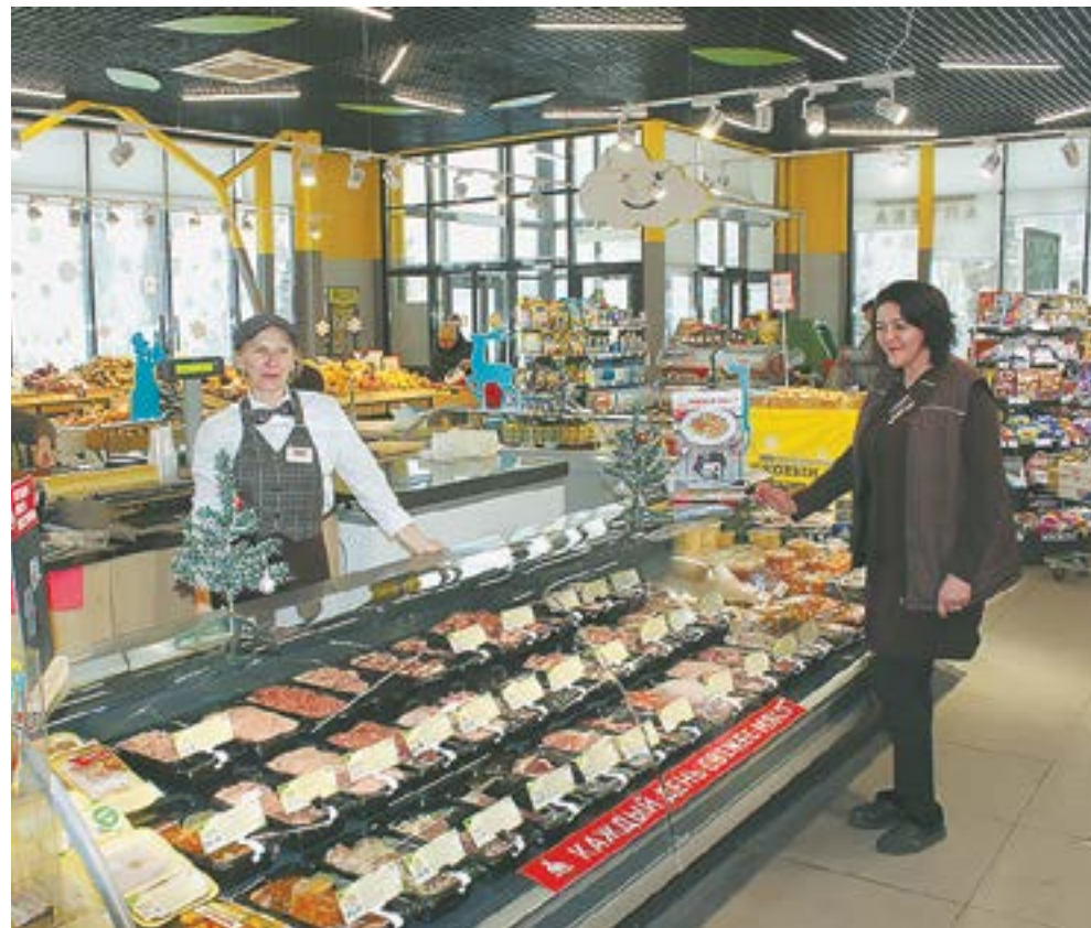
Алтайский край способен обеспечить себя местными продуктами питания.

– Цены на эти товары, конечно, выросли. На некоторые товары влиял спрос. Так, например, подорожали бинты, из которых граждане могли делать маски. Подорожали поливитамины. Люди покупали их, что-