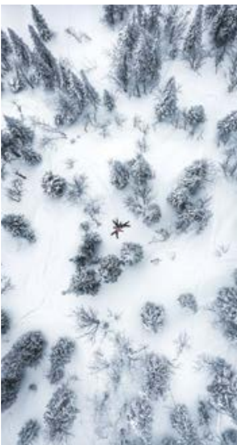
Тайга – километры!