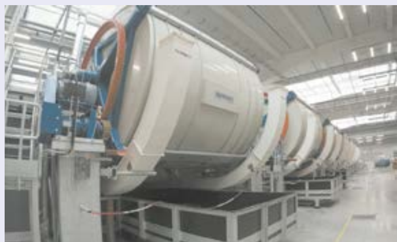
Один из резидентов ТОСЭР в Заринске – предприятие «Русская кожа».

Пятнадцать предприятий, которые первыми начали осваивать элементы эффективного