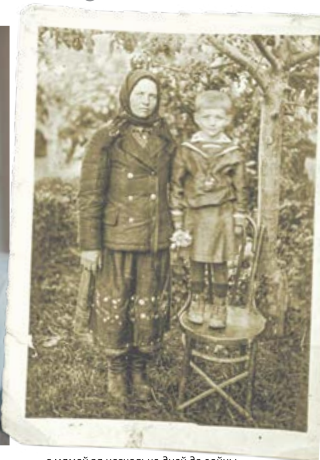
...с мамой за несколько дней до войны.

пулемёты в ту сторону. Уже тогда очень боялись партизан. «Гостевали» они недолго, съехали в центр села, ближе к комендатуре, устроенной в доме бабушки Мокриной. Там безопаснее было.