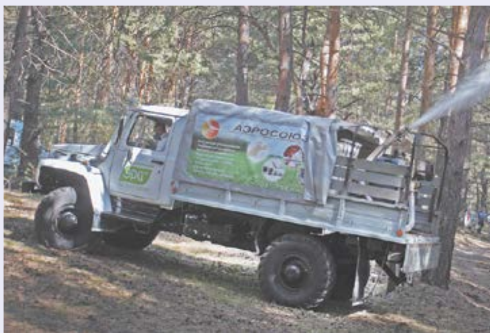
Новая техника на службе лесу.

В рамках регионального проекта «Сохранение лесов» национального проекта «Экология» в 2020 году на приобретение специализированной лесопожарной, лесохозяйственной техники и оборудования Алтайскому краю выделены почти 45 миллионов рублей из средств федерального бюджета. Уже поступили гусеничные бульдозеры, малые лесопатрульные комплексы, колесный трактор, лесные плуги. По сообщению Министер-