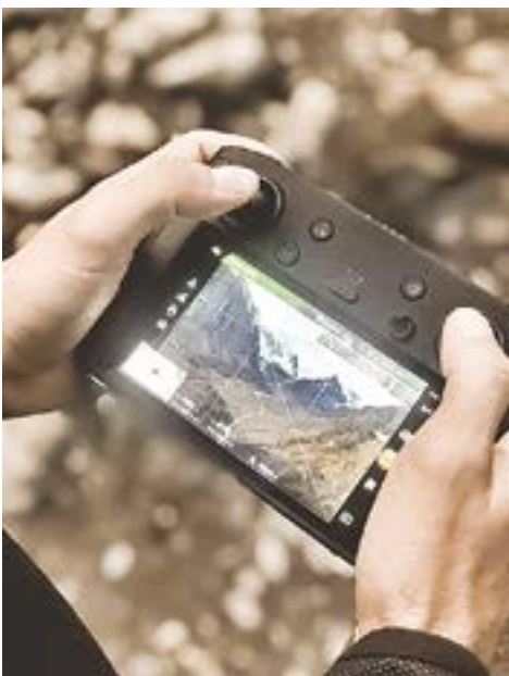
В поиске лучшего кадра.