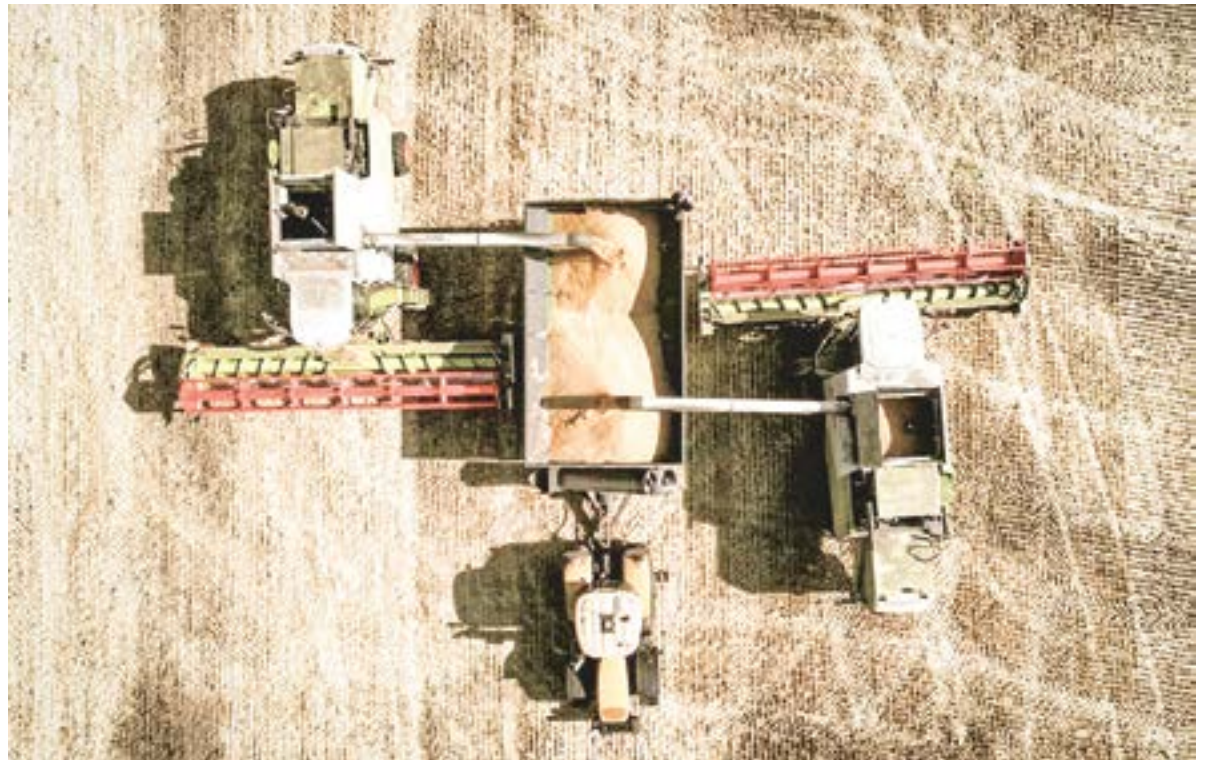
Уборка урожая в Мамонтовском районе.