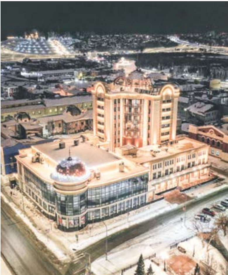
Концертный зал «Сибирь».