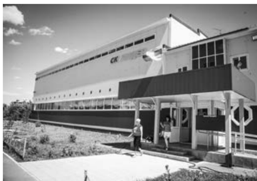
Новый спорткомплекс ждёт своих победителей.

Год с небольшим назад в райцентре Староалейское открылся современный спорткомплекс «Лидер». Обрадованным сельчанам казалось, что вот теперь в спортивной жизни района случится прорыв. Однако жизнь показала: вводом в строй нового здания не решаются проблемы, копившиеся годами.