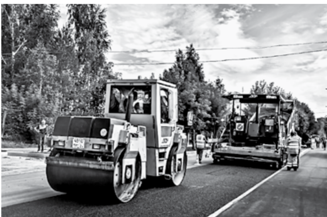
Дорожные работы в Новоалтайске запланированы до 2025 года.

Буквально на прошлой неделе мы получили возможность использовать еще