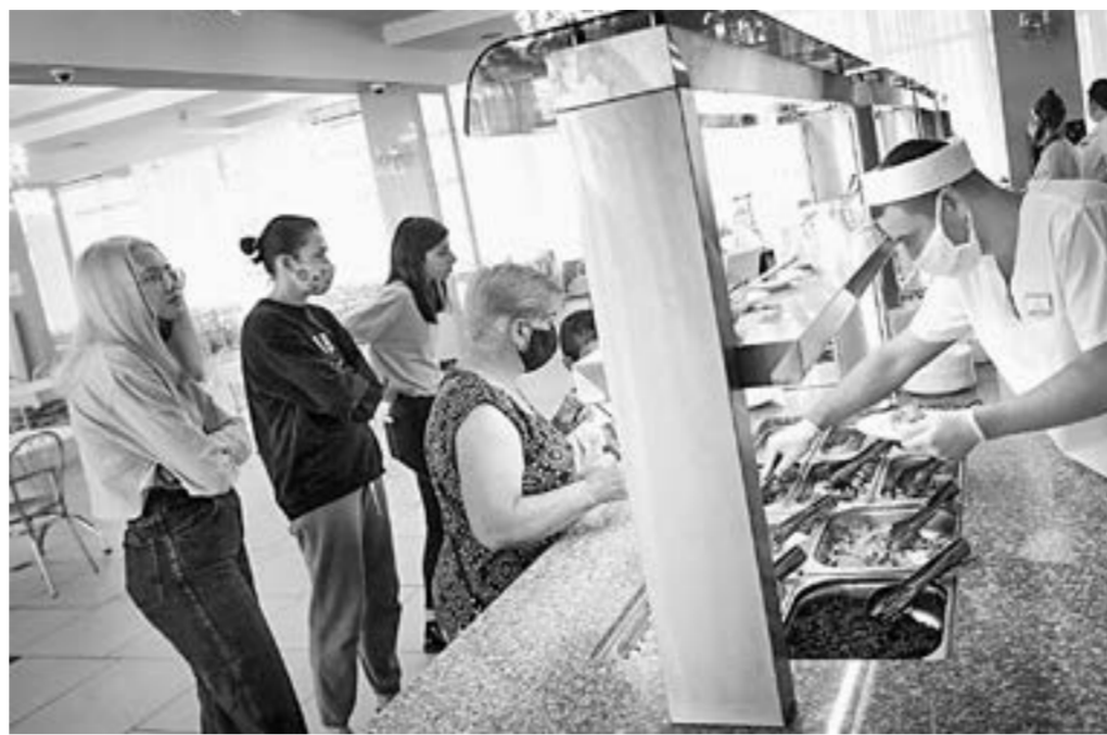
Пандемия пандемией, а обед – по расписанию.

В Алтайском крае уже открыто более 600 туристических объектов.