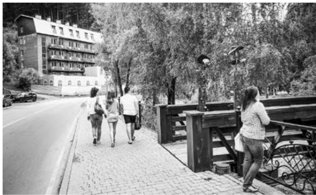
Санатории Белоноурихи постепенно заполняются.