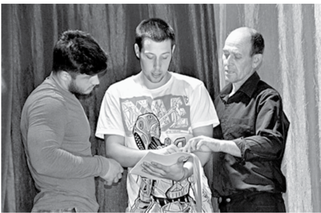
Во время работы над постановкой.

Когда работа над постановкой была закончена, все занятые в ней артисты обратились к молодому режиссеру с предложением: «Приходи к нам работать!»