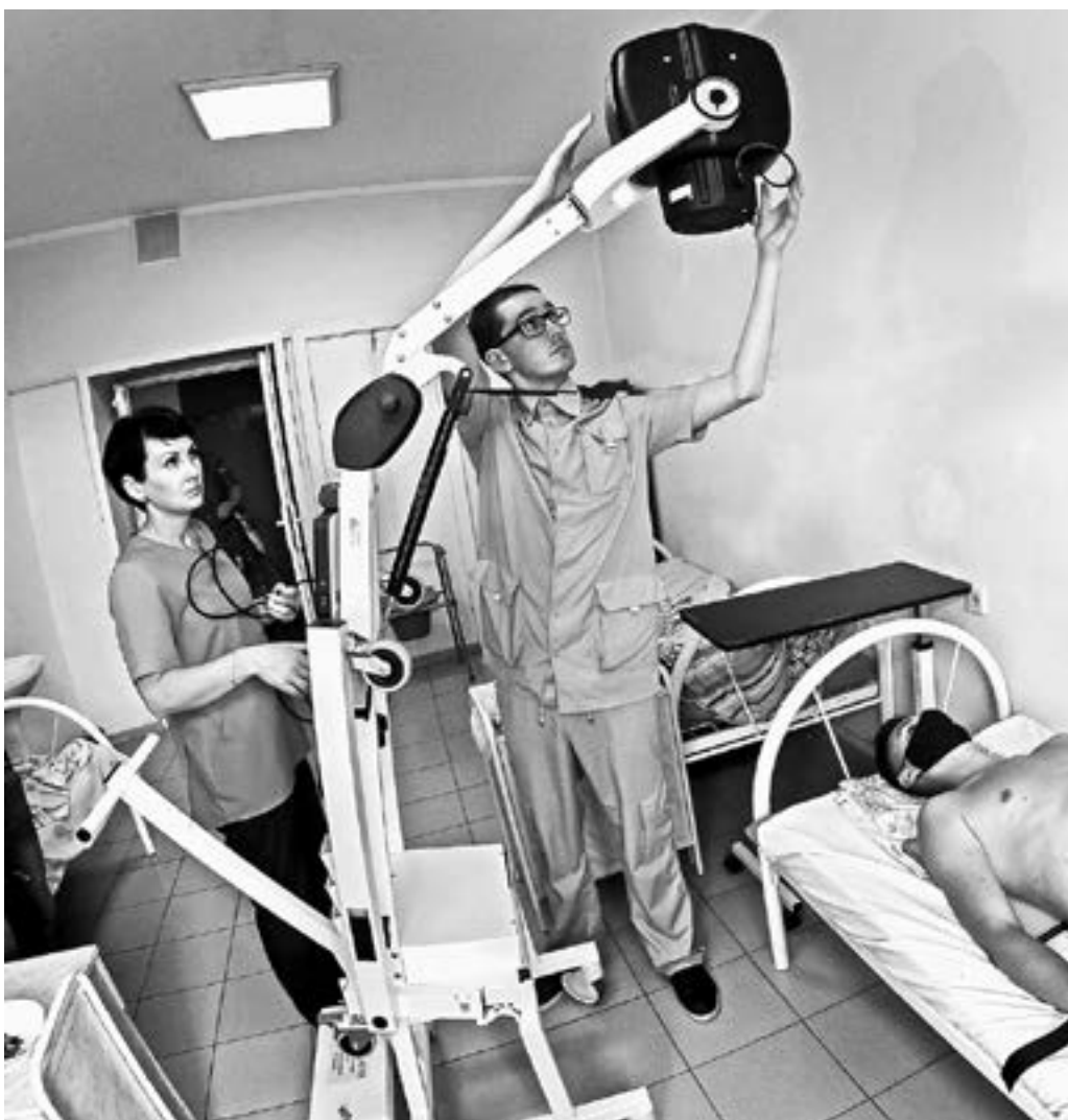
Передвижной рентгенаппарат в палате.

В барнаульскую городскую больницу № 11 поступило дорогостоящее рентген-оборудование, позволяющее проводить исследование не отходя от постели больного.