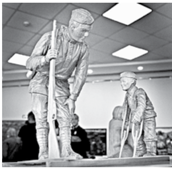
Главная тема – война и Победа.