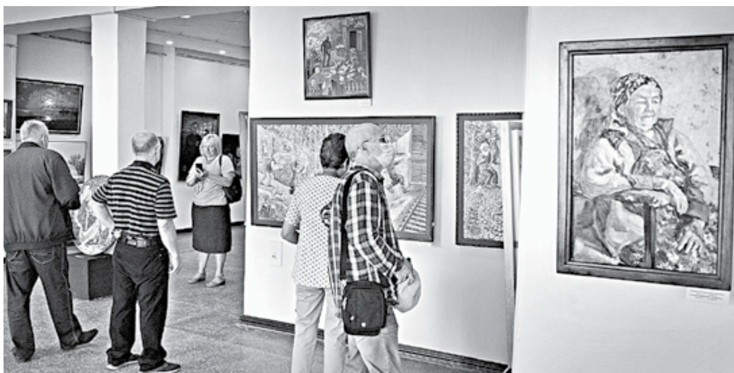
В экспозиции – более 200 произведений живописи, графики, скульптуры и декоративного искусства.

К работам самостоятельных авторов, не являющихся членами союза, по словам Петренко, во время отбора подходили особенно строго. В зале их все равно много, и некоторым опрошен-