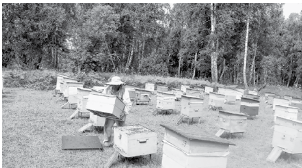
Пчеловоды считают свои убытки.