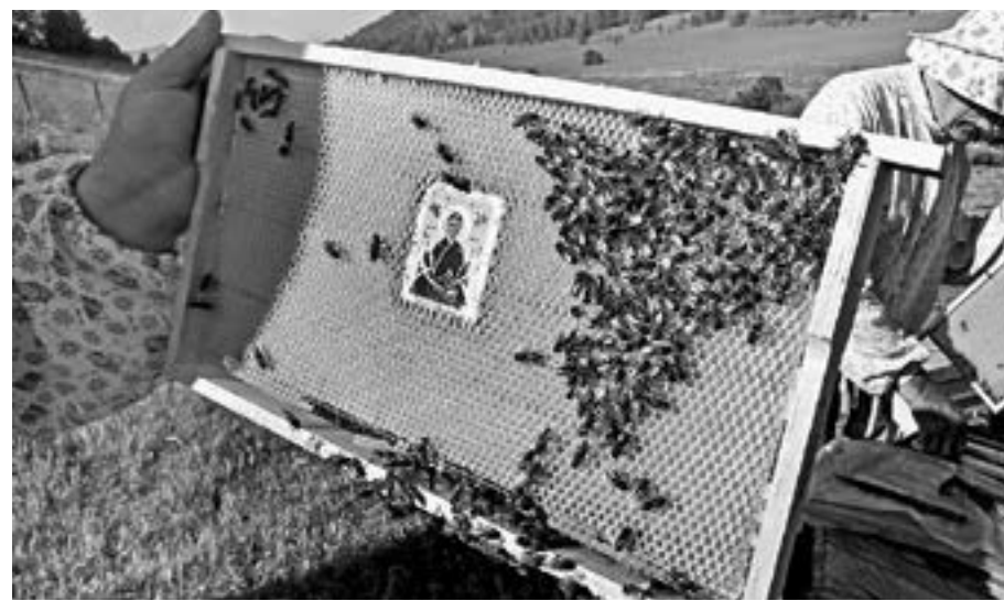
Кто спасет и сохранит пчел?

В Минсельхозе края предупреждают, что если пчеловод работает в статусе ЛПХ и не имеет записи о количестве содержащихся на его пасеке пчелосемей в похозяйственной книге, а также у пасечника нет ветеринарно-санитарного паспорта на пасеку, то доказать гибель или потерю части пчелосемей будет невозможно.