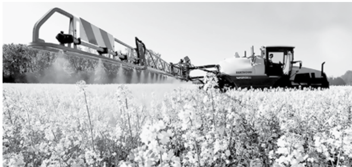
Обработка рапса инсектицидами.