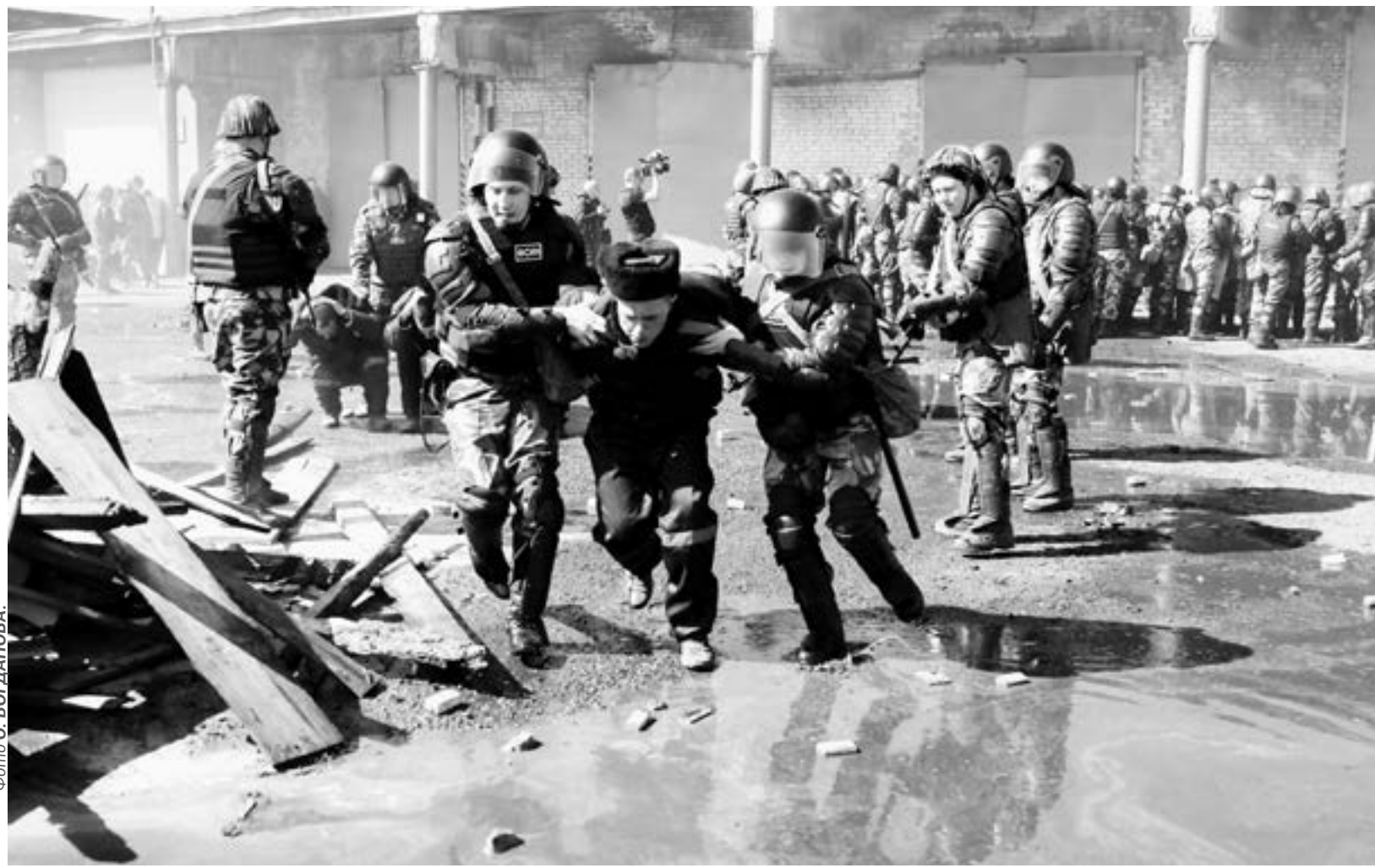
Учения ФСИН. Сотрудники отрабатывают навыки задержания.