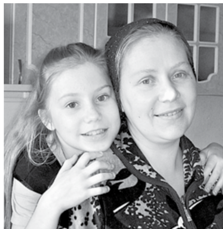
В обнимку с мамочкой.