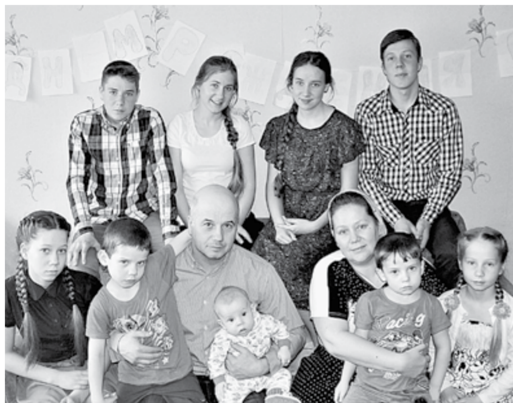
Когда вся семья в сборе.

Об этом волнительном дне я, конечно, пытаю подробности. «Получили телеграмму правительственную, поздра-