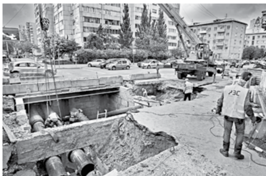
Необходимо подготовить более 17 тыс. км тепловых и водопроводных сетей.