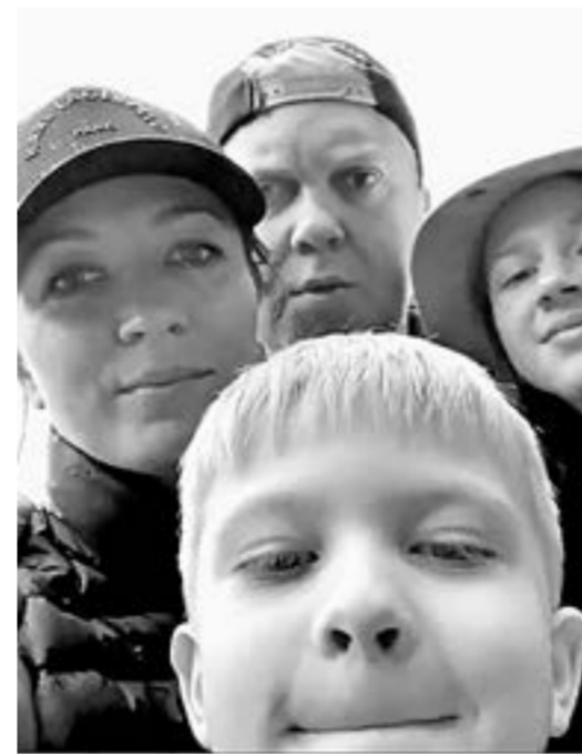
Сергей Светлаков отдыхает с семьей.