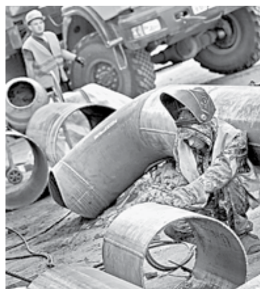
Главная задача – сократить риски аварий.