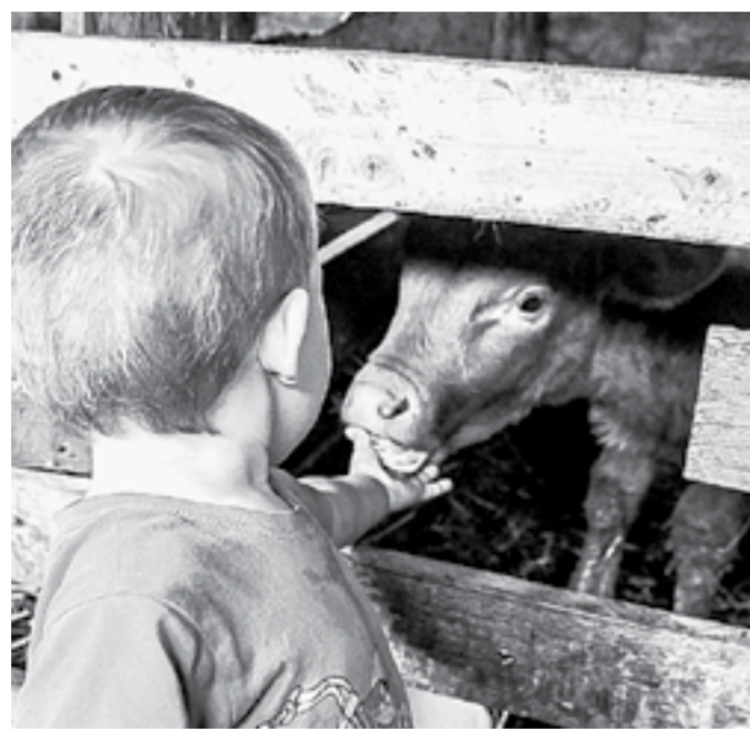
Два малыша. Знакомство.