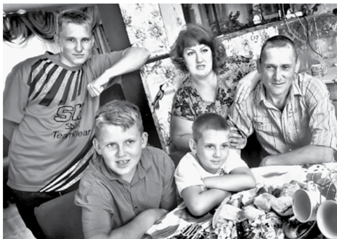
Грибенко. Полный состав.

Многодетная мама из Алейска организовала в своем городе онлайн-клуб семейного общения и бесплатно консультирования по социально-правовым вопросам.