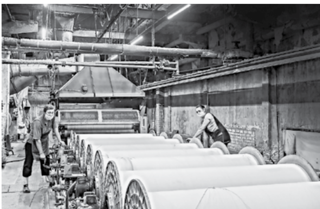
Комбинат перерабатывает в год 2,5 тысячи тонн хлопка.

– Упали ли объемы производства, когда закрылись границы с Китаем?