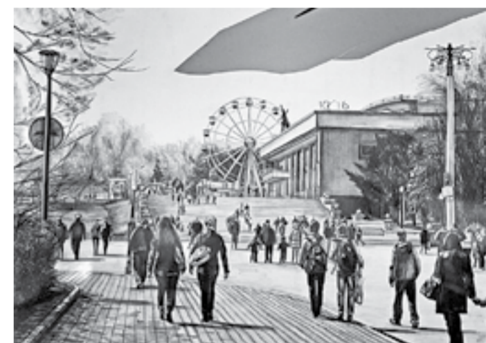
Юрий Гребенщиков. «Барнаульцы» (2016).