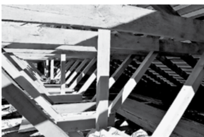
Стоимость работ составила около 5,5 млн руб.