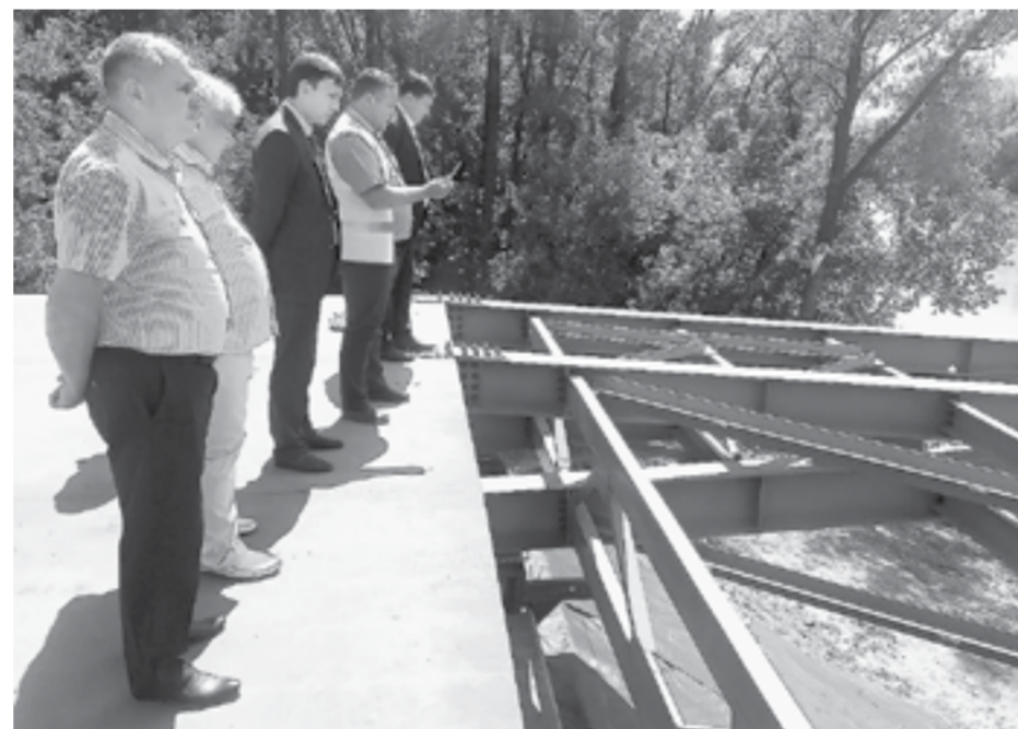
Работы — под пристальным контролем.