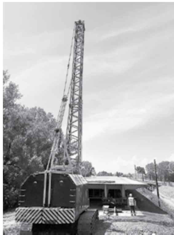
На строительство потратят 500 млн руб.