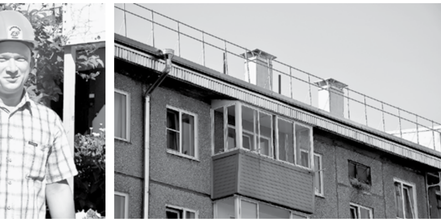
Раньше жильцы боялись дождей, а теперь с надеждой их ждут.

В текущем году многоквартирник попал в программу капремонта, от подрядчика требовалось полностью заменить проблемную кровлю. — Мы поменяли стропильную и водосточную системы, из оцинкованной стали выполнили настенный желоб.