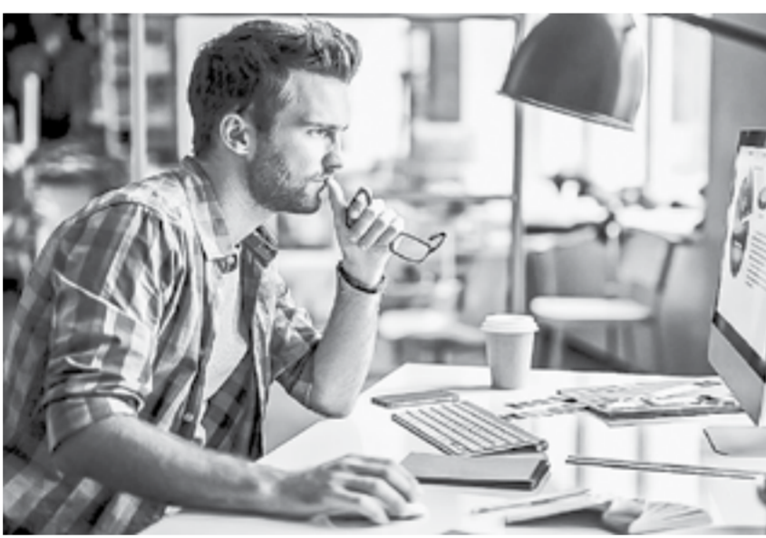
Российские программисты пользуются спросом на Западе.