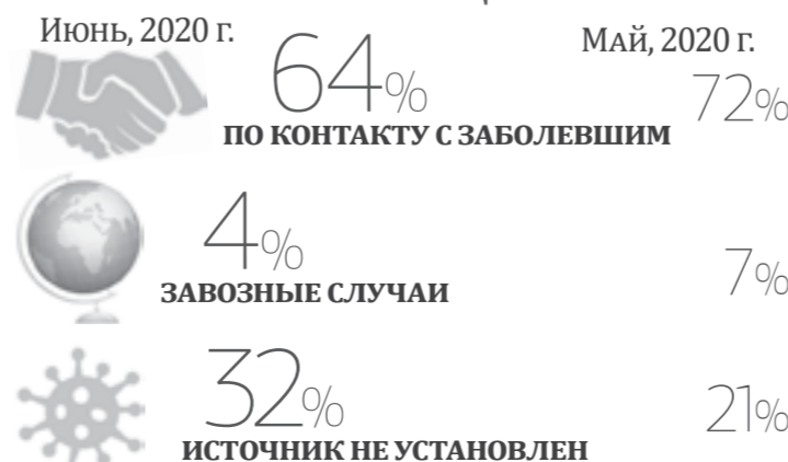
Инфографика Д. СТАРЦЕВА.

35,1 МЛН РУБ. НАПРАВИЛИ В КРАЕ НА ВЫПЛАТЫ СОЦРАБОТНИКАМ