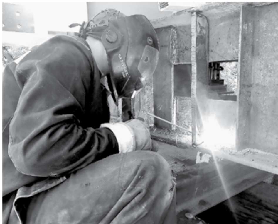
Сейчас ведутся сварочные работы.