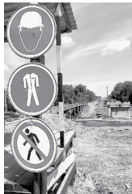
Техника безопасности — превыше всего.