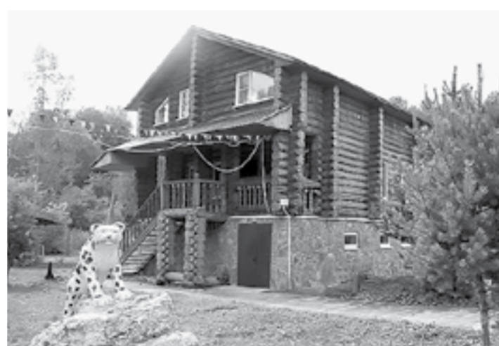
Базы пустуют. Но не все.

В нашей алтайской региональной ассоциации туризма более сдержаны в оценке положения дел. Отмечают: смысла выходить на пикеты нет, нужно решать проблему конструктивно.