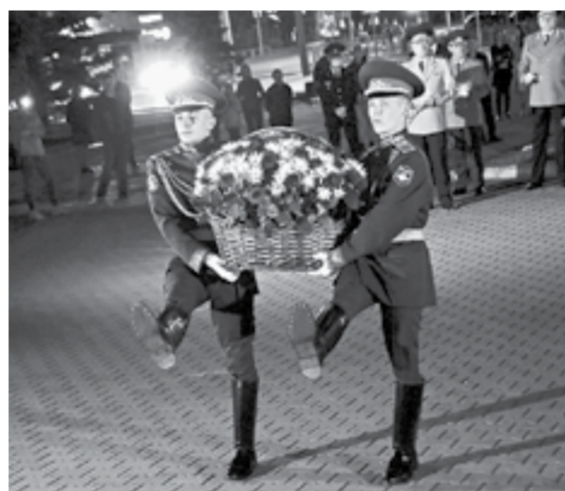
Мемориальным шагом марш!