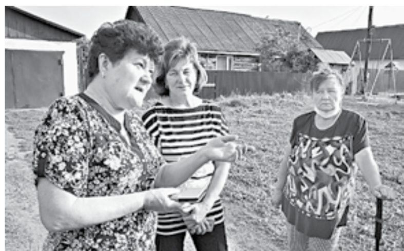
Жители села безуспешно обращались во многие инстанции.

В селе Боровиха Первомайского района завод по производству костной муки «Алтайкорм» почти пять лет отравляет местных жителей. Предприятие сливает сваренный жир в находящийся неподалеку лес, хотя надзорные органы заявляют, что оно закрыто на модернизацию.