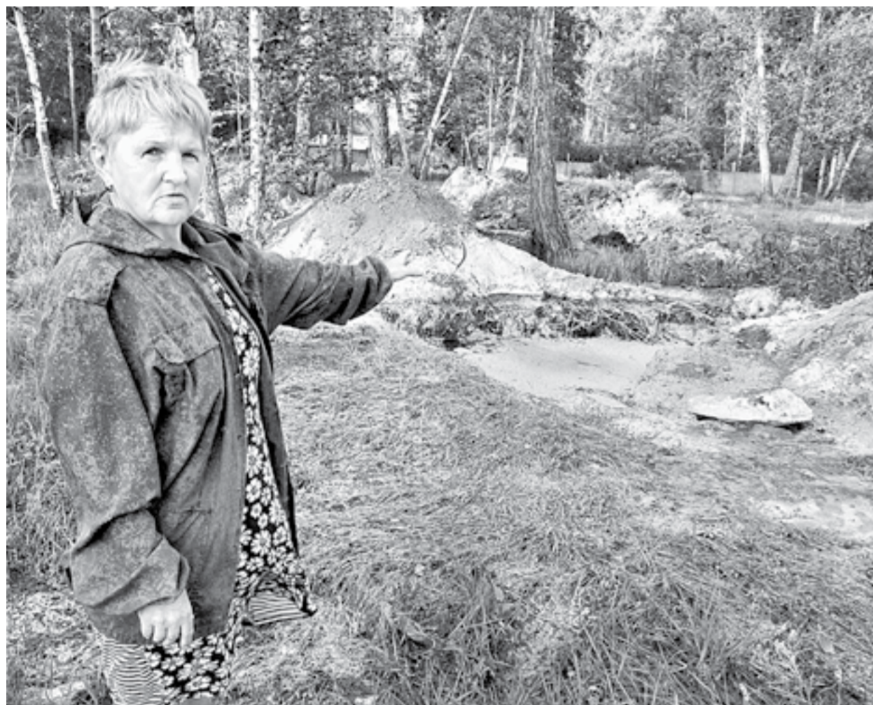
Яма с гниющим жиром находится в 300 метрах от жилых домов.