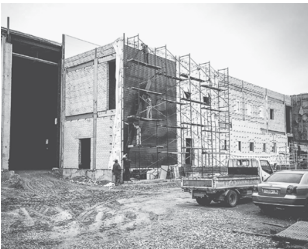
В северной части Рубцовска строится ледовая арена.