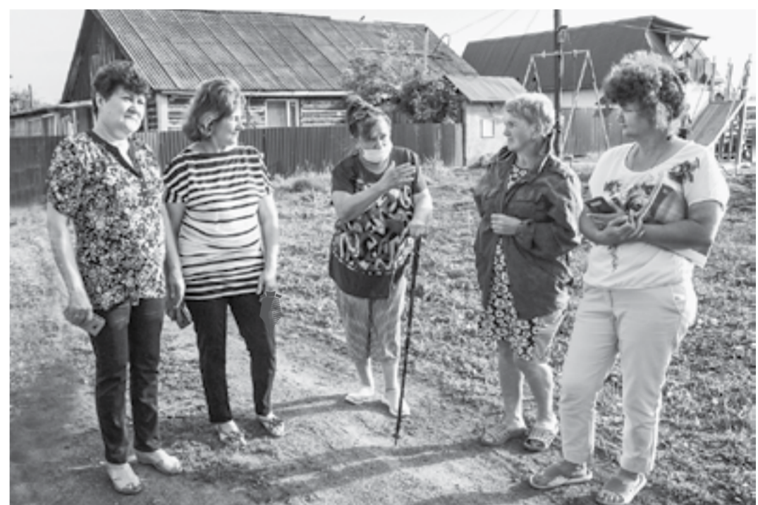
Жители Боровихи обеспокоены проблемой отходов.