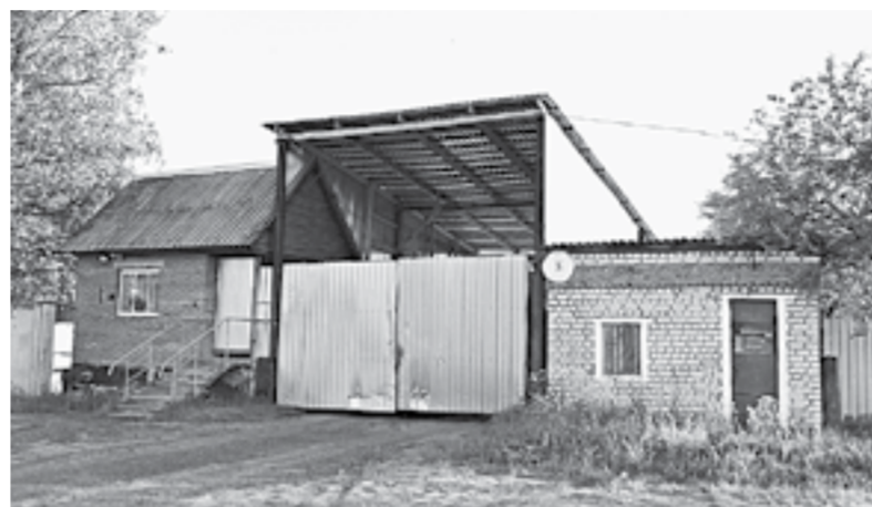
Дальше проходной корреспондентов «АП» не пустили.