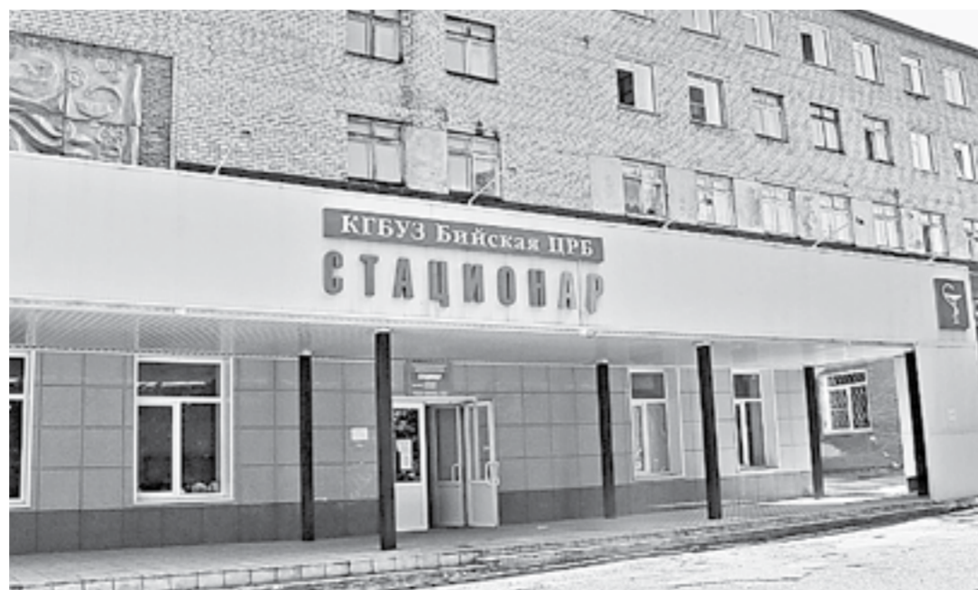
Здесь продолжают оказывать медицинскую помощь жителям района.

Бийская Центральная районная больница, что в селе Первомайском, может стать ковидным госпиталем.