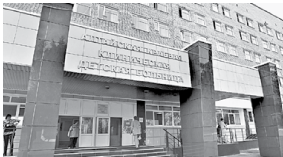
Здесь заработало новое отделение травматологии и ортопедии на 50 коек.

Министр здравоохранения региона Дмитрий Попов назвал все недоразумением. В медицинском учреждении начинает работать новое отделение травматологии и ортопедии на 50 коек. Он подчеркнул, что никого не планировалось увольнять. По поводу самого же видеобращения министр сказал, что это «эмоциональный всплеск». – Мы достаточно давно обсуждали возможность реорганизации, травматологи-