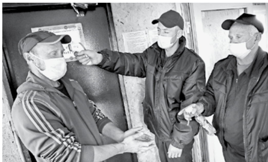
Алтайский мясокомбинат. Без контроля не пройдем.