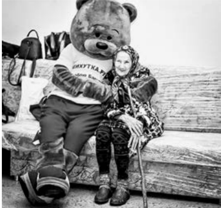
...постигил в Кытмановском доме престарелых...