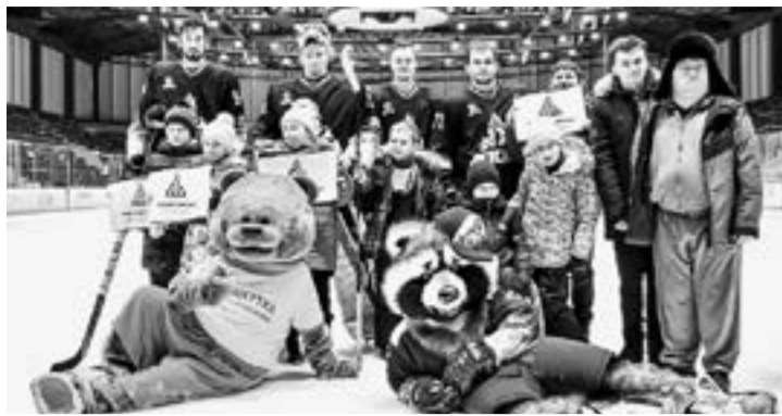
Мишутка с детьми побывал на игре команд Динамо-Алтай - Чебоксары Высшей хоккейной лиги...