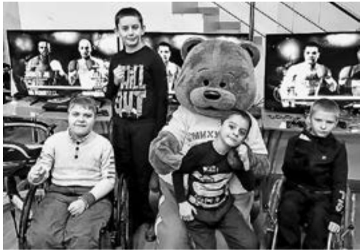
...с детьми поучаствовал в соревнованиях по киберспорту.

Симпатичный медведь Мишутка устроил на днях веселый праздник для маленьких пациентов детской краевой больницы. Там было все – выступления танцоров, спортсменов и даже байкеров.