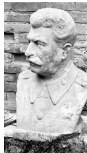
Высота бюста – 80 см.

В завершение отметим, что Центр общественных объединений в Бийске занимает старинный особняк купца Васенева, построенный в 1900 году. И кто знает, сколько еще интересного хранит это здание?