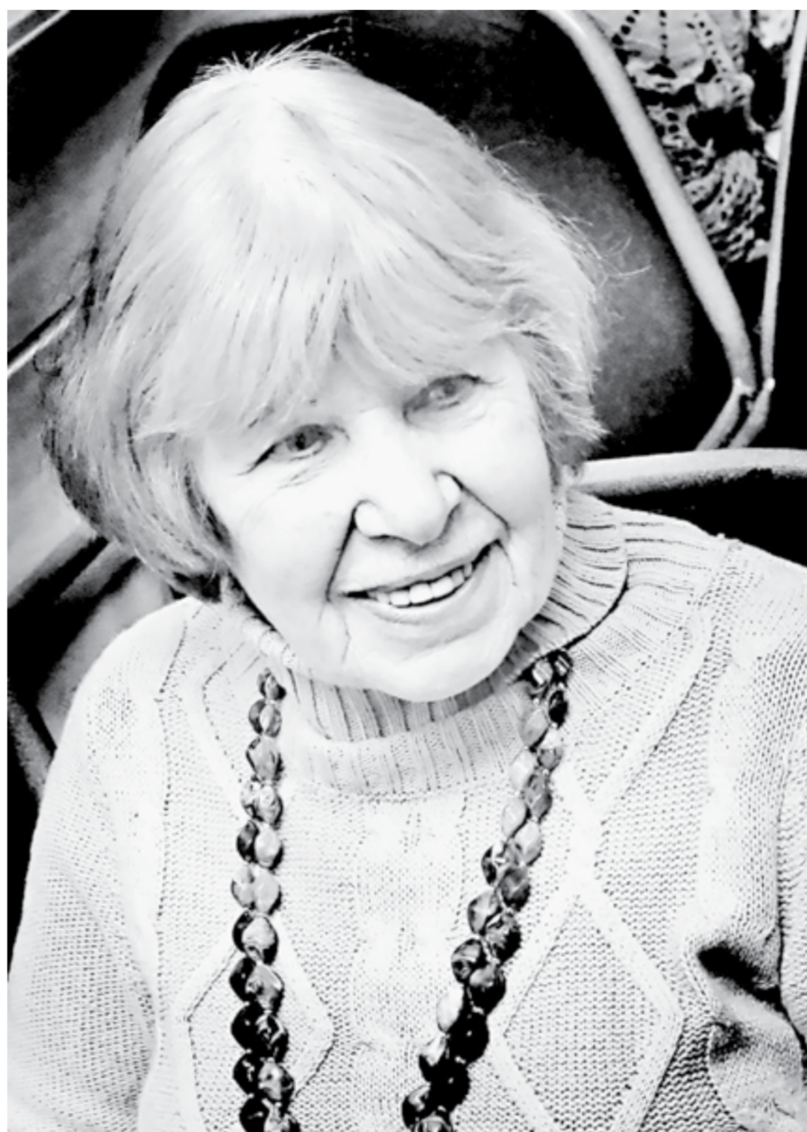
С творчеством Валентины Новичихиной знакомы многие поколения читателей края.

– Сравнивая автопортреты Рублева и свои, я вижу, что в техни-