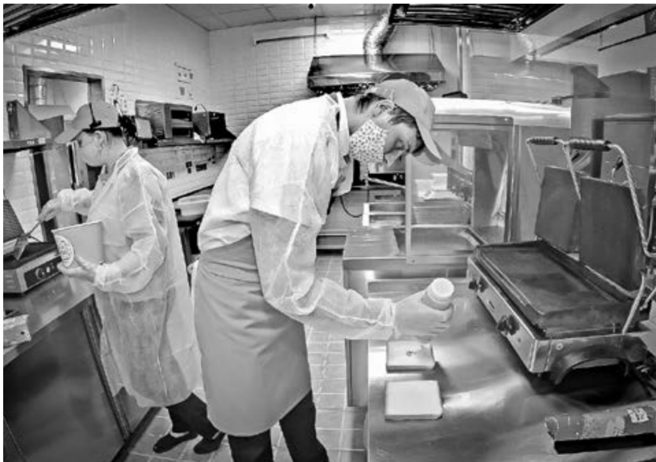
По итогам апреля оборот общепита в сравнении с мартом текущего года снизился на 14,2%.

Ухудшение условий ведения бизнеса коснулось и собственников торговых центров. На сегодня арендаторы объектов не вносят арендную