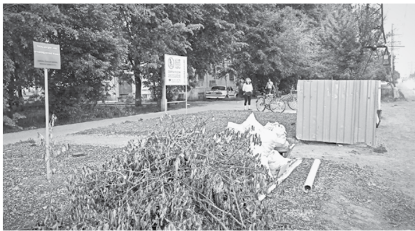
Рядом с контейнером – специальная площадка для крупногабаритного мусора.

В Бийске управляющие компании изменяют подход к содержанию контейнерных мусорных площадок. Администрации наукограда это нравится, но поддержат ли начинание сами горожане?