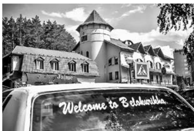
(Начало на 1 стр.)

Снят запрет на ковры в номере. А самое главное – убрали обязательную обсервацию санатория при выявлении большого коронавируса. Сейчас в случае