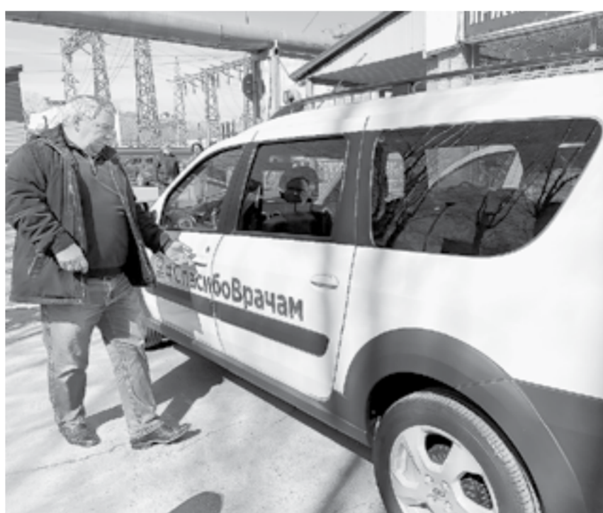
Вручение машин горбольницам № 4 и 5 от «Единой России».