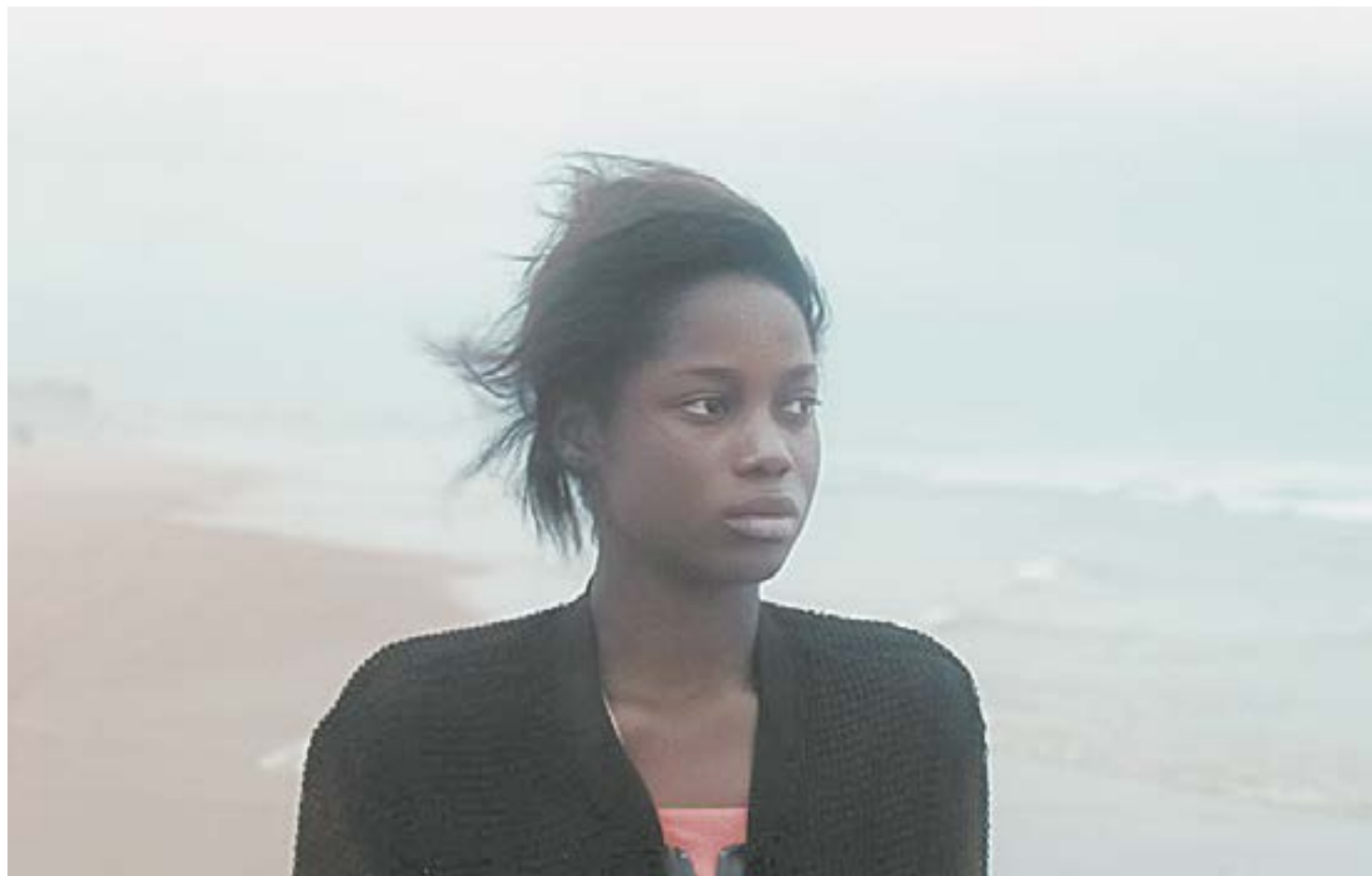
«Атлантика» – мистическая сказка с социальной подоплекой, завоевавшая Гран-при в каннах в 2019 году.

Но как раз во время свадьбы в городе начинаются странные пожары: сперва неизвестный поджог белоснежное