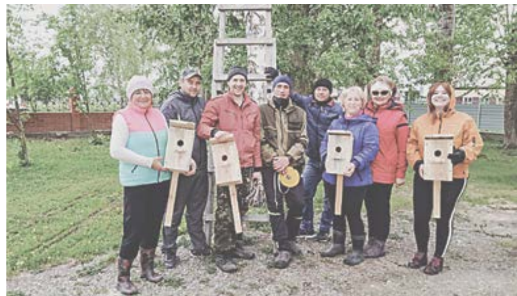
Участники акции развесили скворечники, изготовленные школьниками.

«Наш парк был заложен во времена освоения целинных земель. К юбилею Победы очень хотелось продолжить традицию и обновить посадки. До конца не верилось, что вот так, бесплатно, мы получим прекрасный проект и посадочный мате-