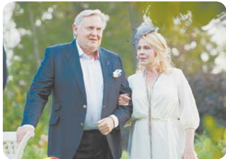
Х.ф. «МОЖЕТЕ ЗВАТЬ МЕНЯ ПАПКОЙ» (16+)

05.10 Т.с. «Москва. Три вокзала» (16+) 06.00 Утро. Самое лучшее (16+) 08.00 Сегодня 08.25 Т.с. «Мухтар. Новый след» (16+) 09.25 Т.с. «Морские дьяволы. Смерч» (16+) 10.00 Сегодня 10.25 Т.с. «Морские дьяволы. Смерч» (16+) 13.00 Сегодня