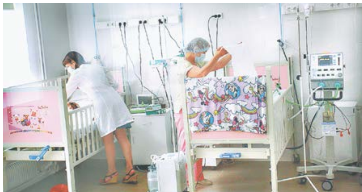
Маленьких пациентов лечат здесь.

Но сотрудники больницы № 11 рук не опустили. Собрали из других отделений что смогли. Только и для шести мест, куда могли поступить маленькие пациенты