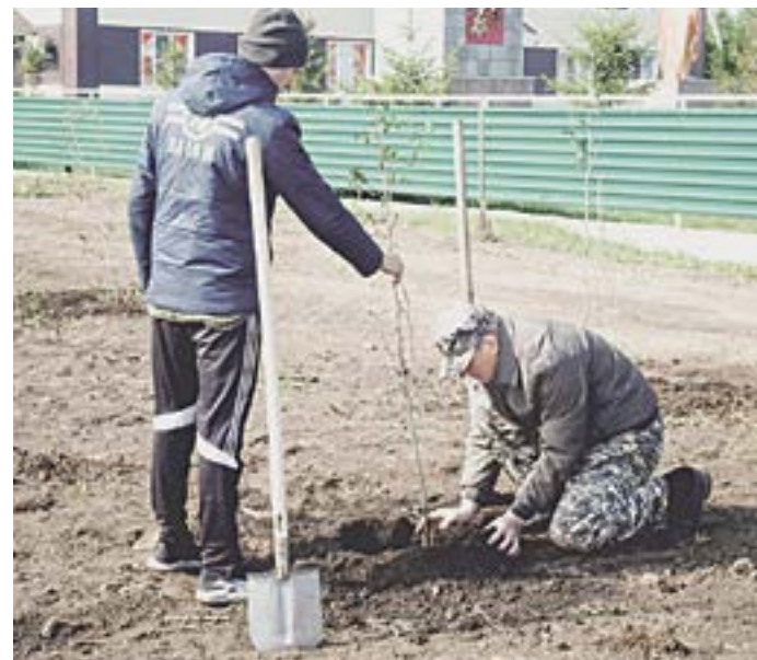
Каждое дерево будет носить имя ветерана.

Выбор территории закладки парка был доверен редакции газеты «Алтайская правда». Мы проголосовали за район, лидирующий по показателям подписки на наше издание. Подготовку саженцев, дизайн-проект и консультирование по посадке взял на себя Алтайский краевой детский экологический центр. Но это было бы невозможно без поддержки Алтайской краевой экологической общественной организации «Моя малая родина», организатора марафона «Зеленые колокола». Проект получил грант губернатора Алтайского края в сфере экологического воспитания, образования и просвещения.