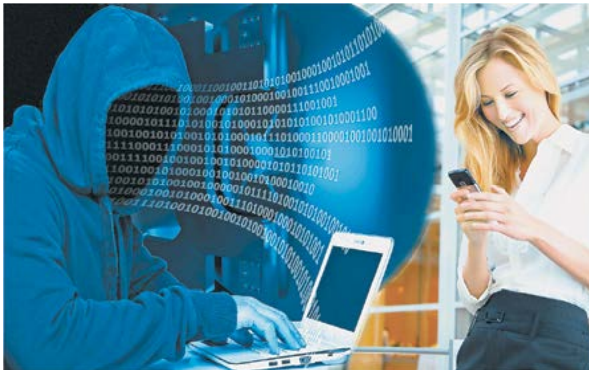
Коллаж Д. СТАРЦЕВА.

От оформления 200 тысяч кредита напуганную маму остановил мой брат, который, к счастью, оказался рядом. Он краем уха услышал разговор и подошел узнать, все ли в порядке. Увидев, что звонок по-