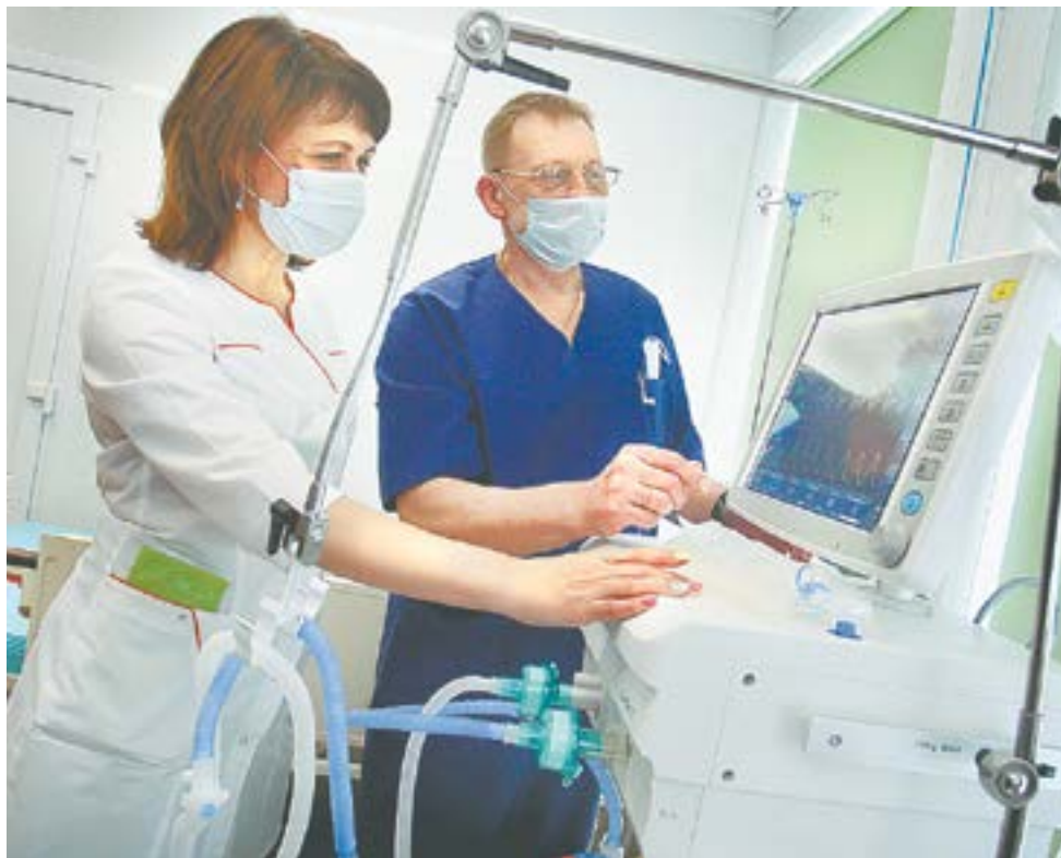
В детской реанимации суперсовременный аппарат.