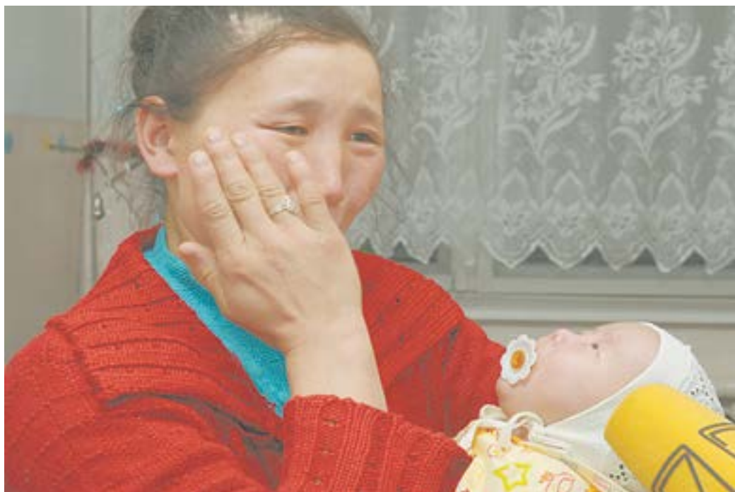
Сулушаш в момент встречи с сыном.