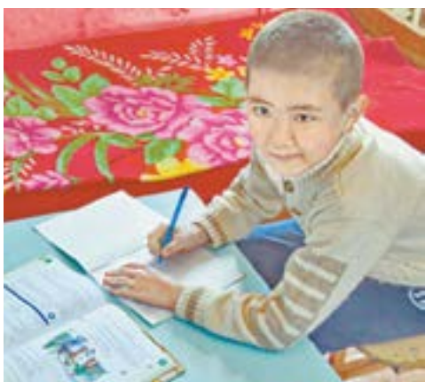
Родино. Спустя 10 лет.