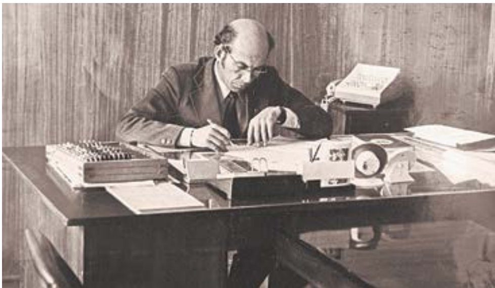
Вопросы строительства решались и в кабинетах.

«Мы пробивались через скальные породы, возводили мосты, перекидывали трассу на другую сторону Катуня, расширяли узкие бомы на скальных участках Чуйского тракта до кондиционных 10–12 метров, гравийки и грунтовок переводили в категорию дорог с твердым покрытием. Словом, закладывали основу современной дорожной инфраструктуры».