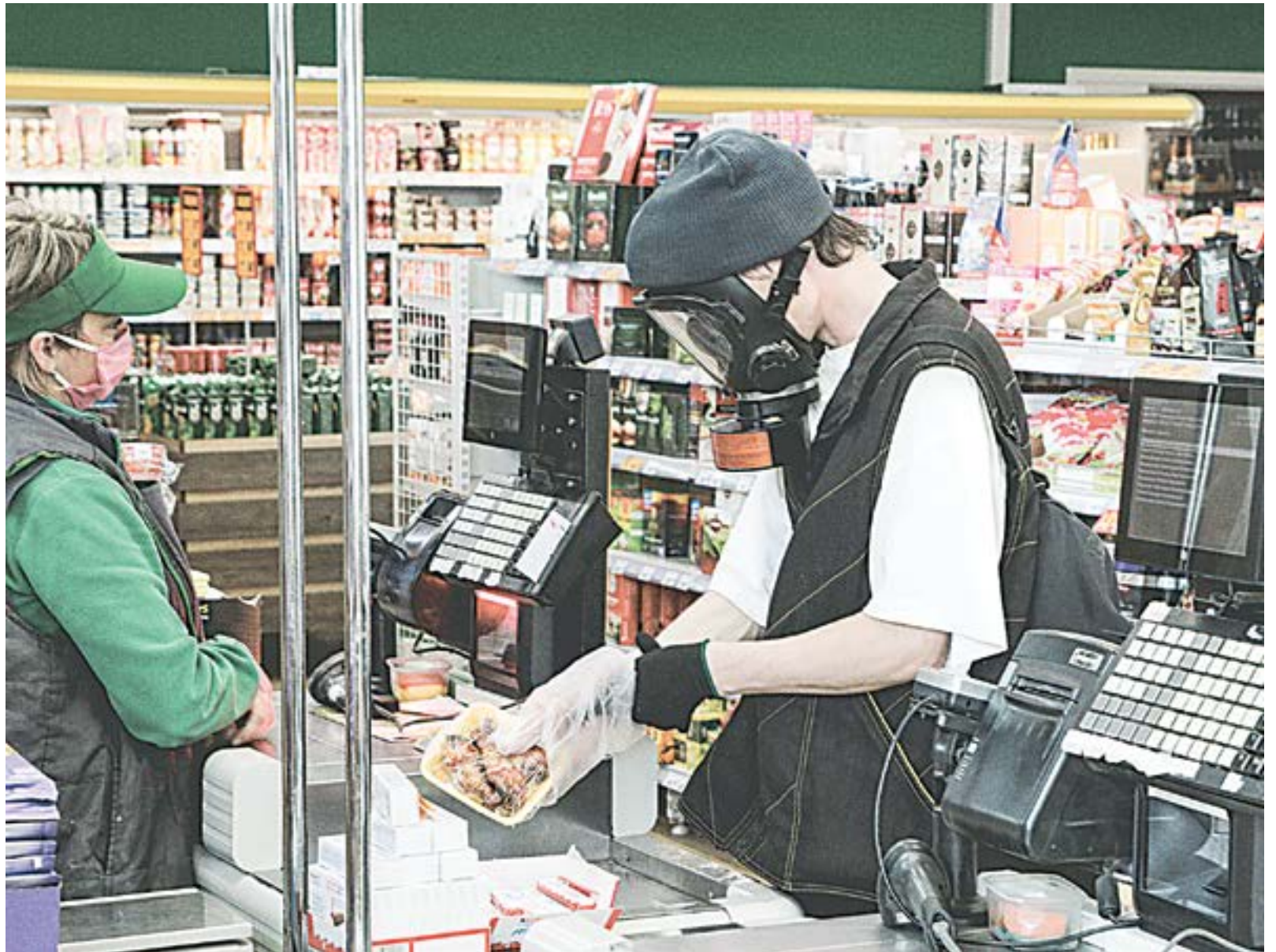
В магазинах соблюдаются все меры безопасности.

– На стоимость без слез не взглянешь. Вот уж никогда не думала, что одноразовая маска будет стоить дороже пакета молока. 41 рубль за несколько часов ношения маски – это перебор. Конечно, одну и ту же приходится использовать по несколько раз. Иначе можно просто разориться. Такая же история с перчатками. Пару беру за 35 рублей на рынке