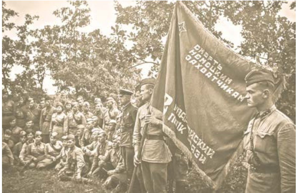
Полковое знамя хранили как зеницу ока.

Едва дети свернули с дороги, мимо них пронеслись мотоциклы, крытые машины. Они перекрыли детям дорогу с обоих