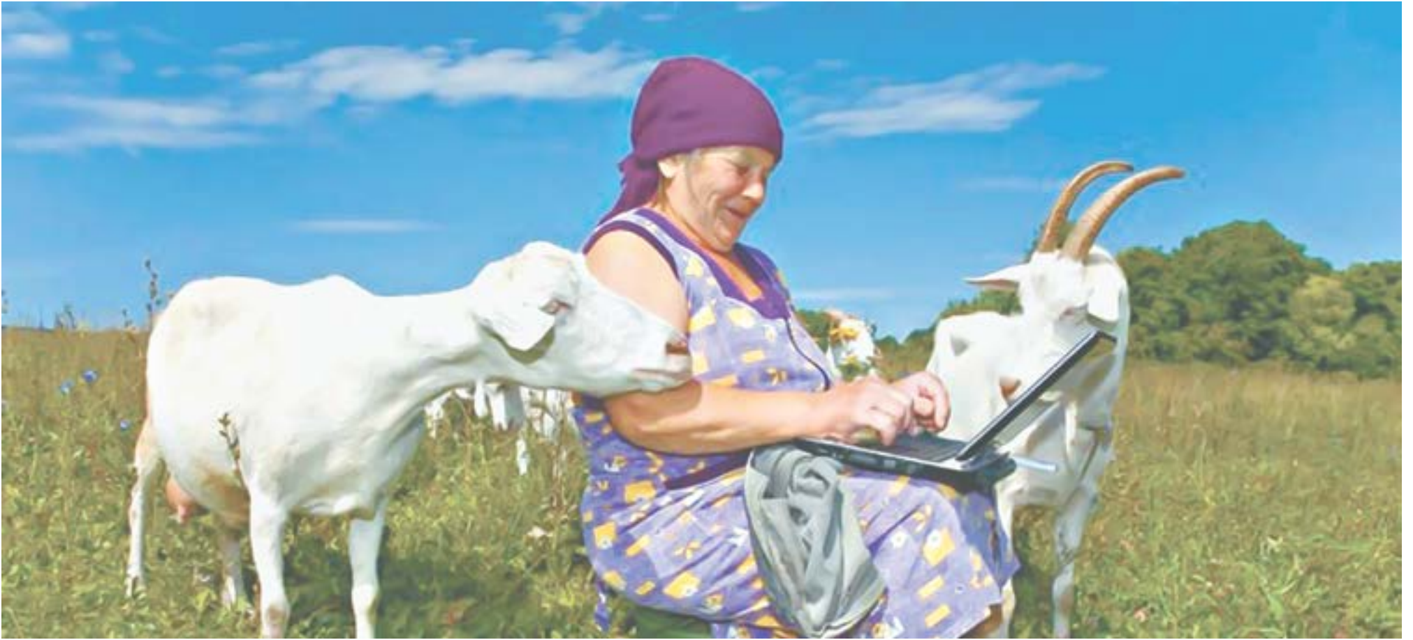
Появились возможности приобрести новые знания и навыки людям разных возрастов.