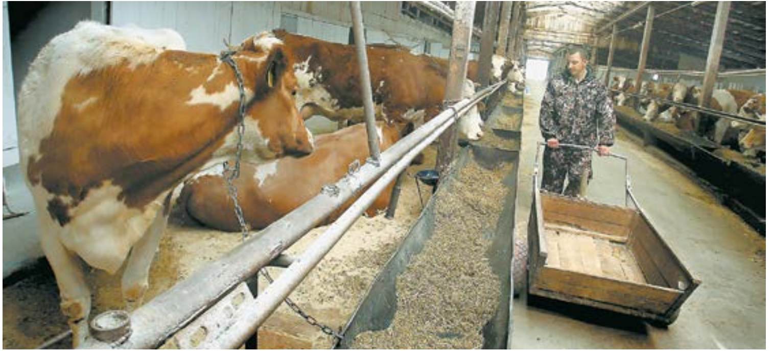
Коровы в «Бурановском» – крупные.

Коровы на ферме большие, мясомолочной симментальской породы. Весят они по 650 кг. Но в хозяйстве есть около 300 более