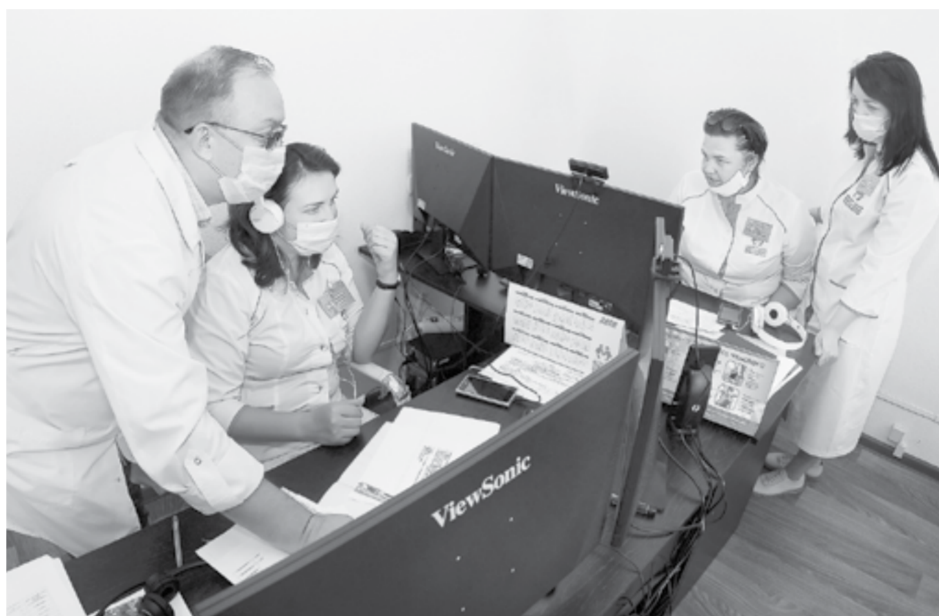
Дистанционный врачебный консилиум.

Наш край включил в борьбу с коронавирусной инфекцией новую технологию лечения на дому больных с легкой и бессимптомной формами болезни. За краткий период уже доказала свою эффективность такая схема партнерства врачей поликлиник и консультативного дистанционного центра, созданного на базе краевого центра профилактики.