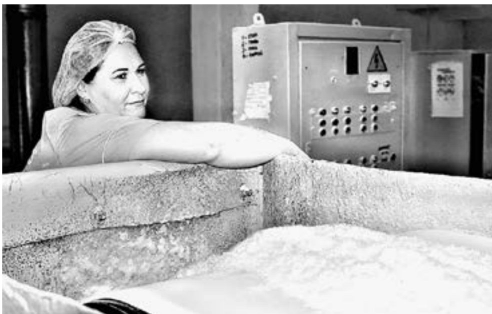
Повышенный спрос разгрузил склады сахарных заводов.

Поскольку отрасль не пострадала, то говорить о дополнительных мерах экономической поддержки не приходится, хотя предприятия по-прежнему имеют право на получение льготных ссуд от Фонда развития Алтайского края, Алтайского фонда микрозаймов и на услуги лизингового фонда края.