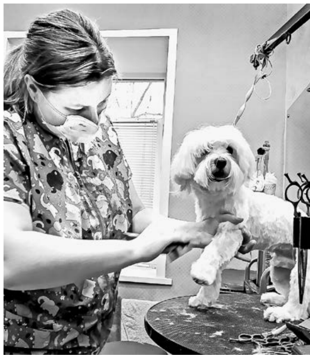
Грумеры и прочие самозанятые могут уменьшить свою налоговую нагрузку.

Он отметил, что краевые власти создают стимул для вывода самозанятых из тенивого сектора экономики. Действующие предприниматели смогут оптимизировать свои налоговые расходы, высвободив