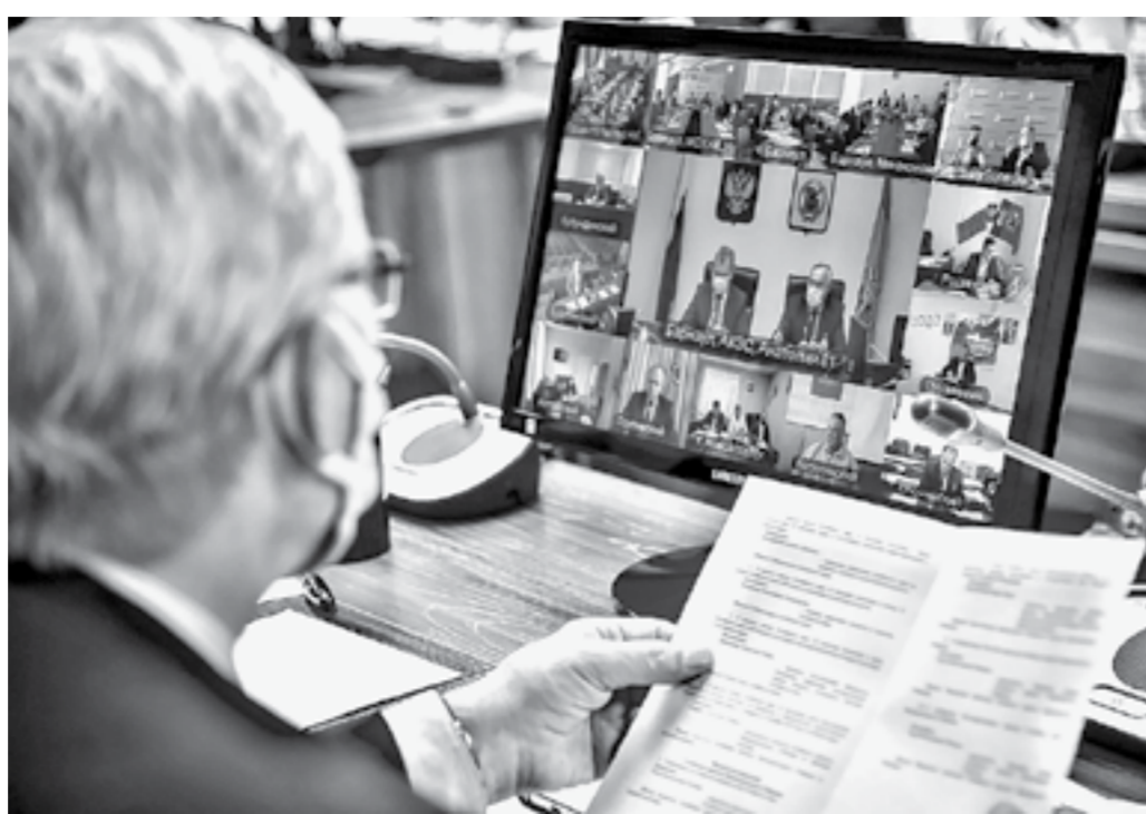
Всего для проведения 43-й сессии АКЗС на территории Алтайского края было организовано 23 площадки.

– На текущей сессии депутаты рассмотрели ряд важных вопросов. В том числе приняли законопроект о приостановле-