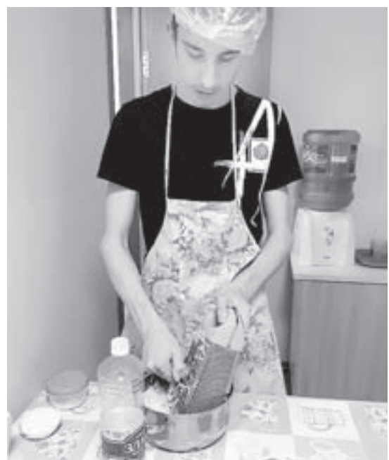
Кулинарные уроки пригодятся в самостоятельной жизни.