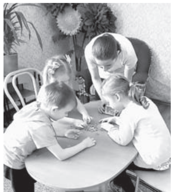
Младшие воспитанники любят собирать пазлы.

Людмила МАКОВЕЦКАЯ