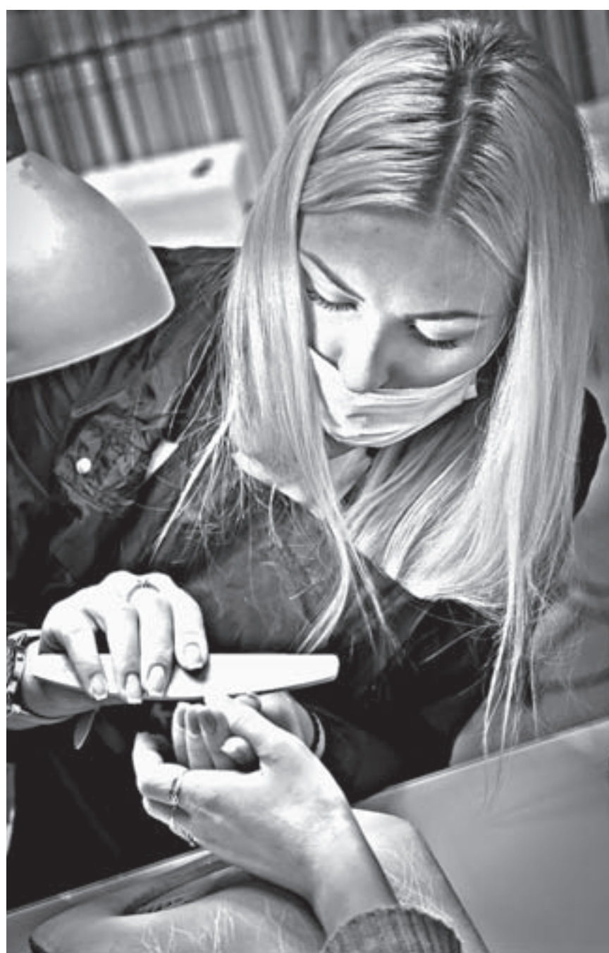
Мастера салонов красоты и до пандемии работали в масках.