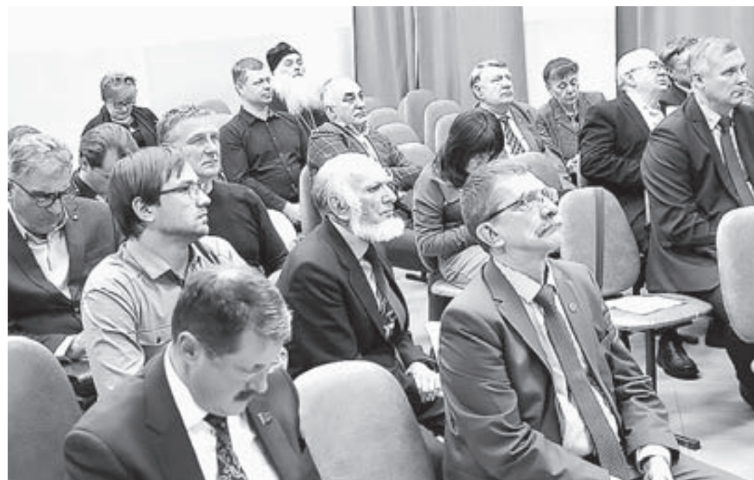
Общественная палата Алтайского края формируется из 45 человек.