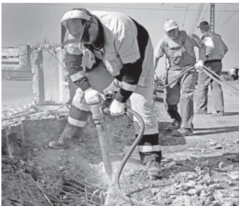
На северной стороне путепровода.