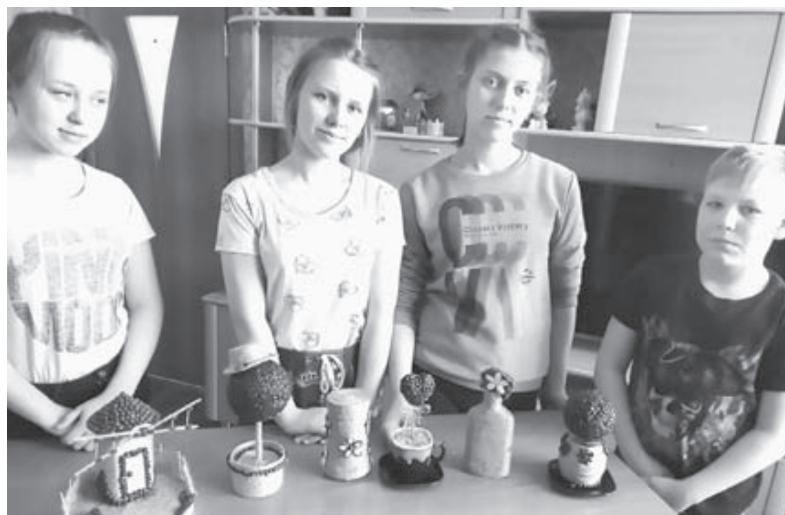
В свободное время можно изготовить интересные поделки.

Начало положил ролик, которым дети подхватили «Эста-