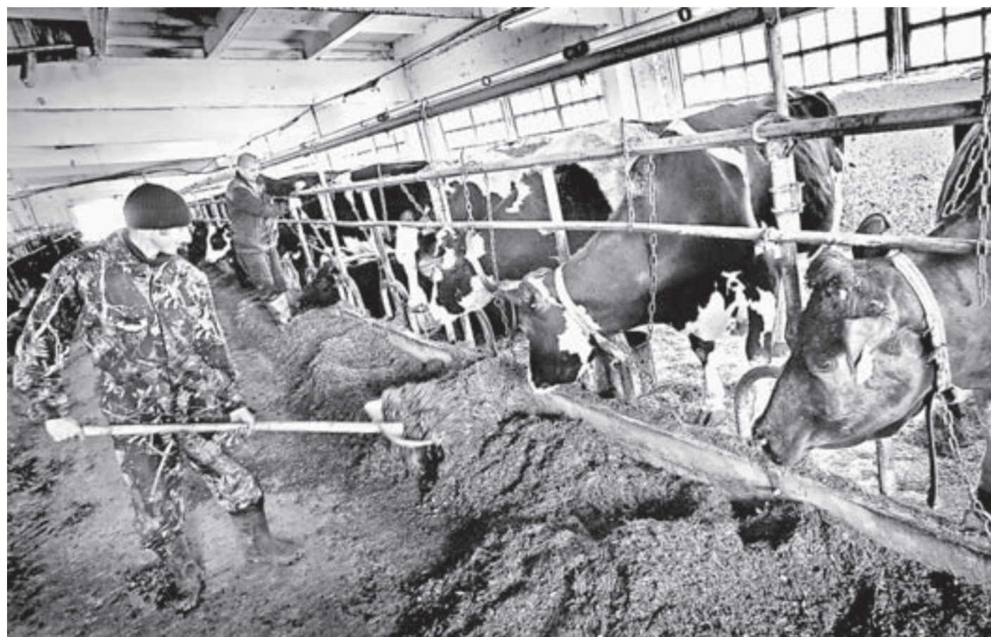
Коровы в «Комсомольском» крупные и высокопродуктивные.