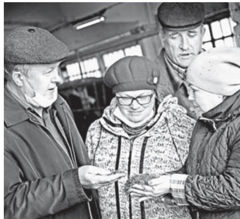
Специалисты «Комсомольского» обсуждают качество норма.