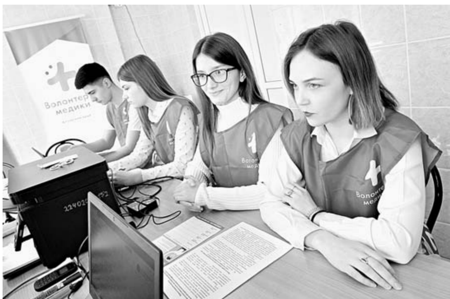
В региональном штабе работы волонтерам хватает.

– Достаточно сложно запустить этот механизм, так как речь идет о больших денежных суммах. Мы в тесном контакте