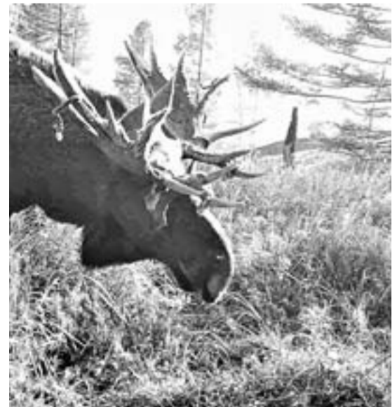
Животные и не подозревали о том, что попали в объектив камеры.