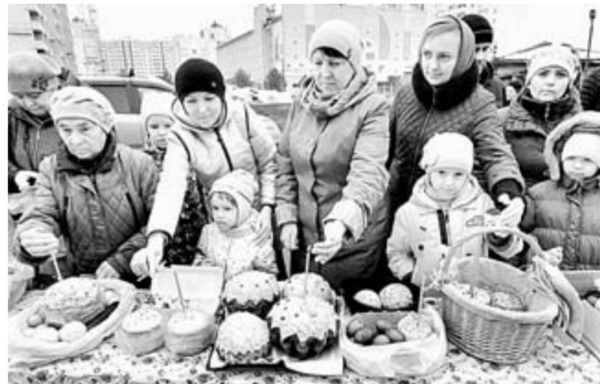
Накие только куличи не пекут хозяйки на праздник!

Она дает очень красивый синий цвет. Есть два метода окрашивания –