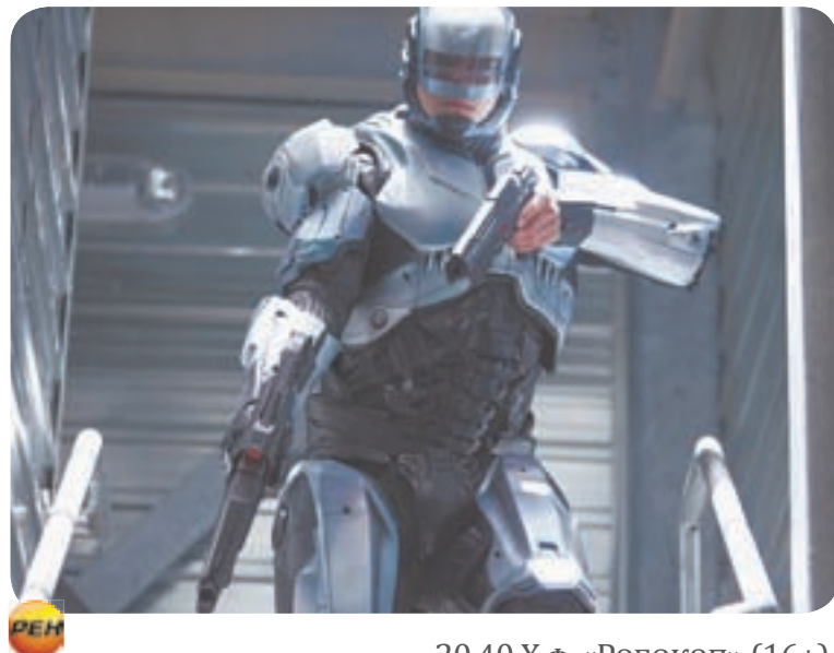
РЕН 20.40 Х.ф. «РОБОКОП» (16+)

14.10 Однажды... (16+) 15.00 Своя игра (0+) 16.00 Сегодня 16.20 Следствие вели... (16+) 18.00 Новые русские сенсации (16+) 19.00 «Итоги недели» с Ирадой Зейналовой 20.10 Маска (12+) 22.50 Звезды сошлись (16+) 00.25 Основано на реальных событиях (16+) 03.00 Т.с. «Кодекс чести» (16+)