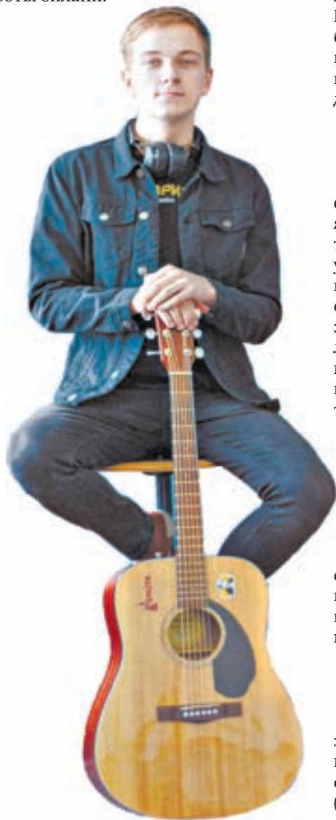
Музыкант Алексей Боровиков.