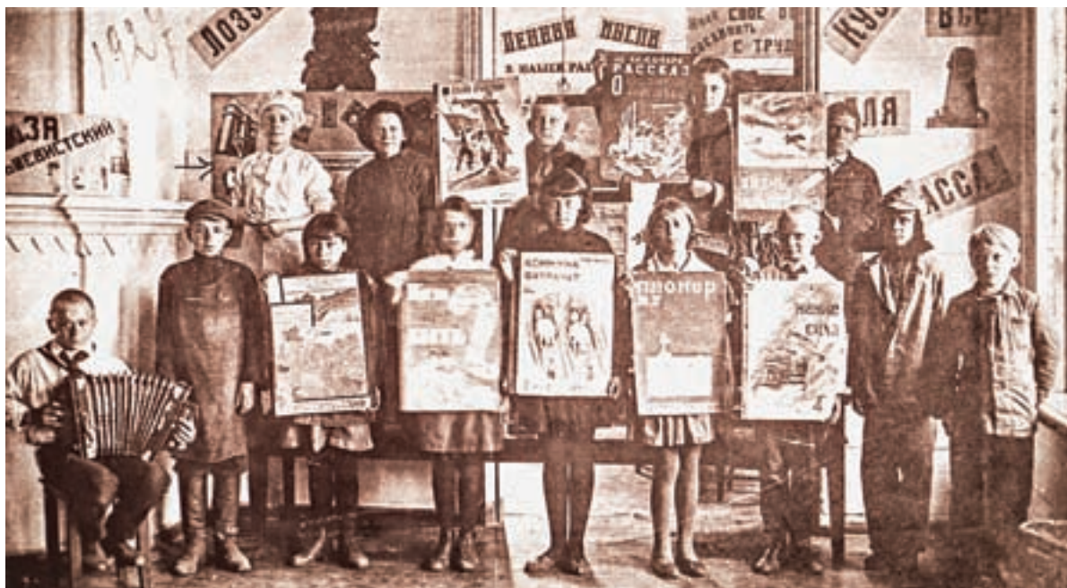
1927 год. Кружок «Друзья библиотеки».