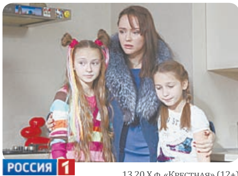
РОССИЯ 1 13.20 Х.ф. «КРЕСТНАЯ» (12+)

ИД 05.30 Д.ф. «Москва. Матрона-заступница столицы?» (16+) 06.20 Центральное телевидение (16+) 08.00 Сегодня 08.20 У нас выигрывают! (12+) 10.00 Сегодня 10.20 Первая передача (16+) 11.00 Чудо техники (12+) 11.55 Дачный ответ (0+) 13.00 НашПотребНадзор (16+)