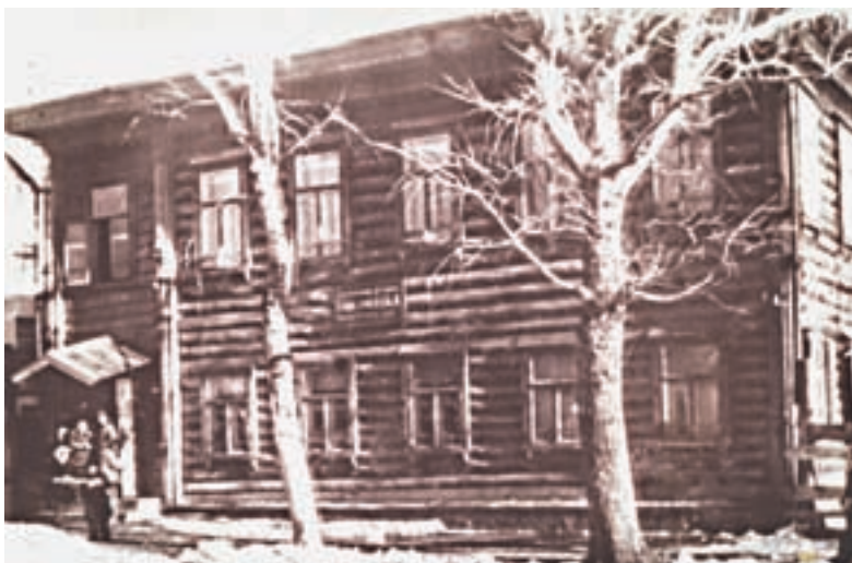
Здание на ул. Интернациональной до 1955 г.

– Да, это была переписка. Дети рассказывали Надежде Константиновне о своей жизни, задавали ей вопросы, посылали фотографии. Например, сообщали, что собирали книги для деревенских детей, «еще отравили краску, потому что они просили – им рисовать нечем». И Крупская в ответном послании хвалила их. В другом письме дети писали ей, мол, узнали, что ее