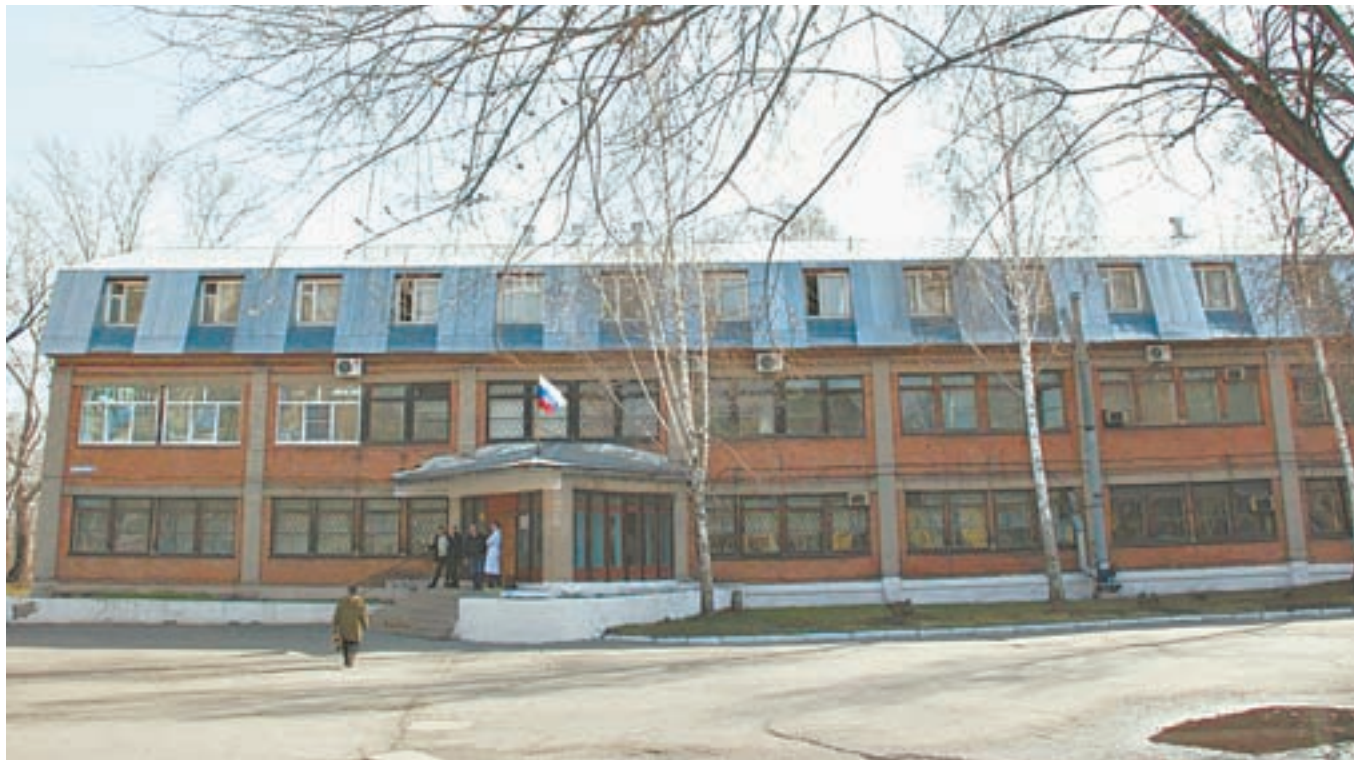
Бийская городская больница № 2.