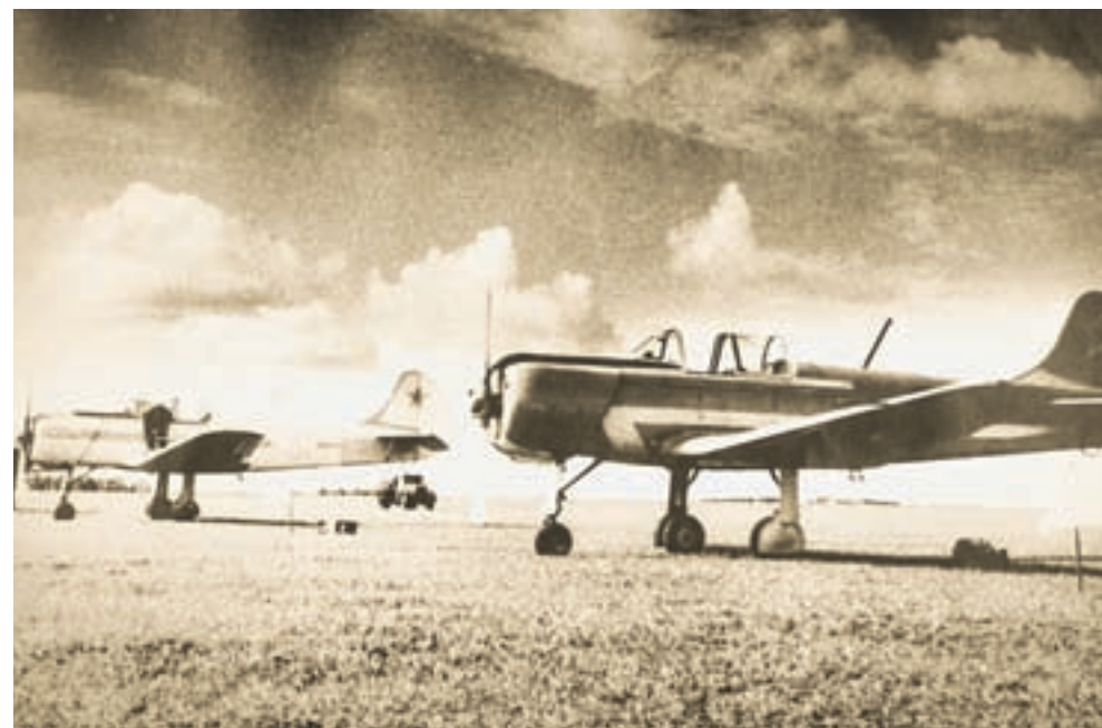
Машины Барнаульского аэроклуба.

Исторический факт. После полета Гагарина главным конструктор Королев стал про-