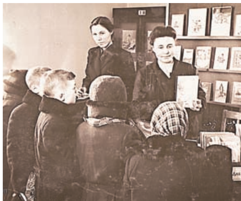
Сотрудники библиотеки в 50-е годы.