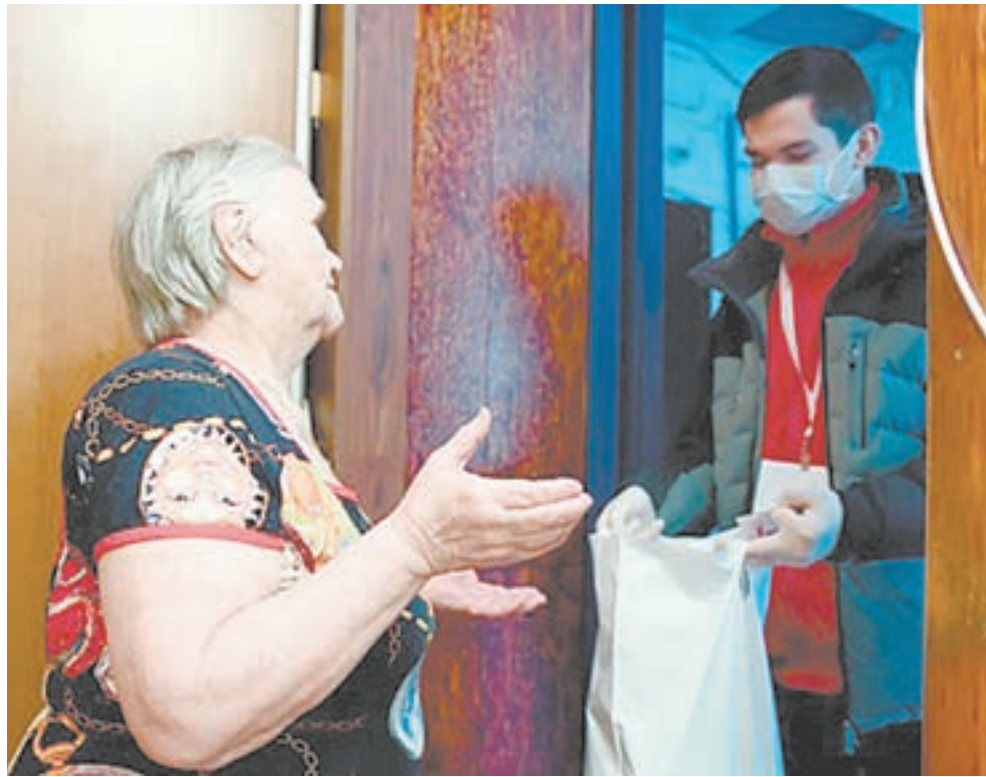
Многие молодые люди стали волонтерами и помогают пенсионерам.

Работаем по 14 часов в день, нам важно научиться жить в новых реалиях. Создана целая программа работы онлайн.