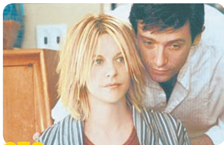
СТС 09.00 Х.ф. «КЕЙТ И ЛЕО» (12+)

РД 05.10 Т.с. «Москва. Три вокзала» (16+) 06.00 Утро. Самое лучшее (16+) 08.00 Сегодня 08.25 Т.с. «Мухтар. Новый след» (16+) 10.00 Сегодня 10.25 Т.с. «Морские дьяволы»