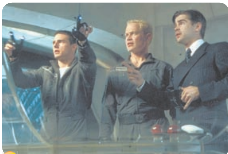
21.45 Х.ф. «ОСОБОЕ МНЕНИЕ» (16+)

ИМЕЮТСЯ ПРОТИВОПОКАЗАНИЯ НЕОБХОДИМА КОНСУЛЬТАЦИЯ СПЕЦИАЛИСТА