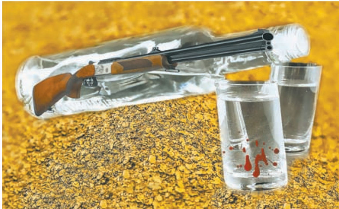
Коллаж Д. СТАРЦЕВА.

О том, что в артели произошло двойное убийство, директо-