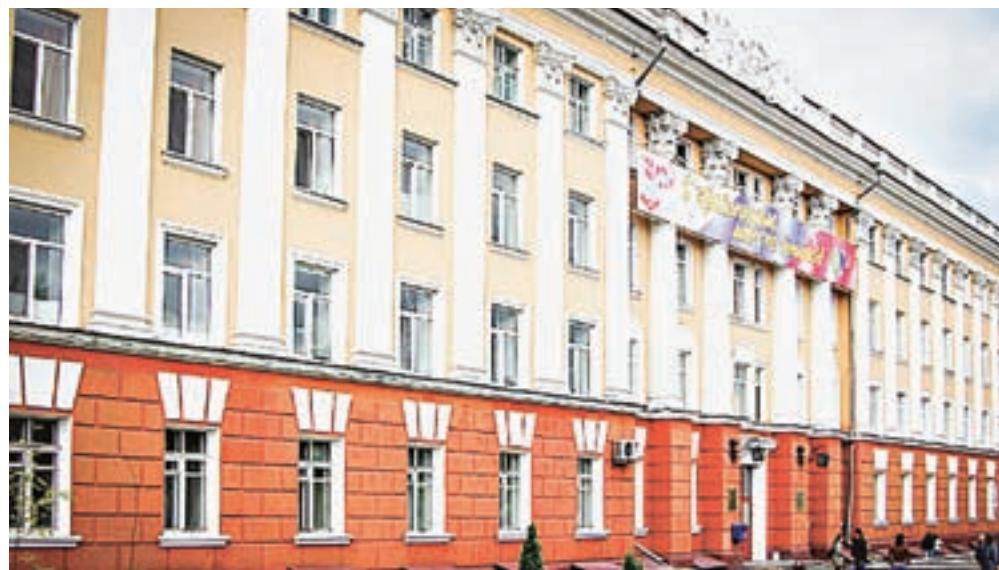
АГМУ – за здоровый образ жизни.

В Москве подвели итоги XI Всероссийского конкурса образовательных организаций высшего образования Министерства здравоохранения РФ на звание «Вуз здорового образа жизни». АГМУ стал призером соревнования, причем единственным из всех медицинских вузов Сибири. Золото и серебро достались коллегам из Санкт-Петербурга и Воронежа.