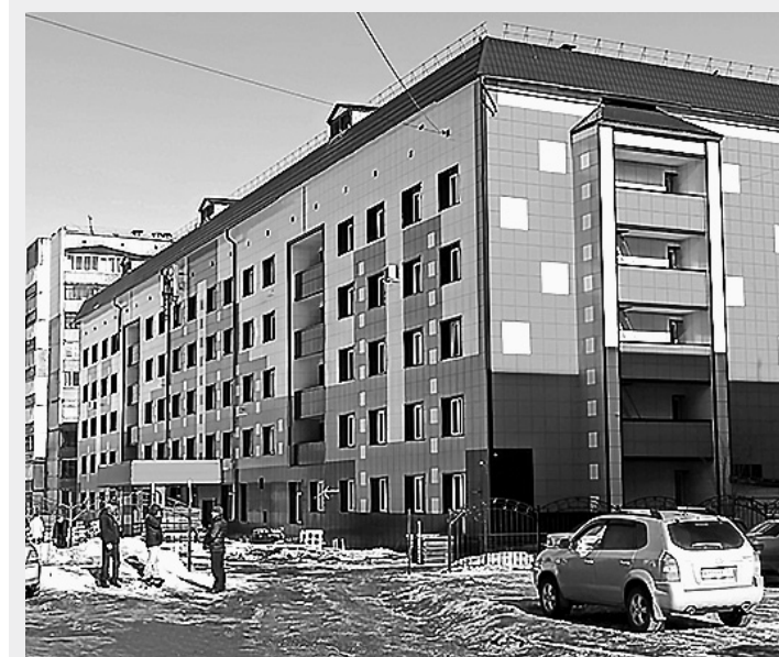
Больница притягивает взгляд.

Теперь мечта сотрудников больницы — это ремонт первого этажа, его перепланировка. Хочется сделать нормальный