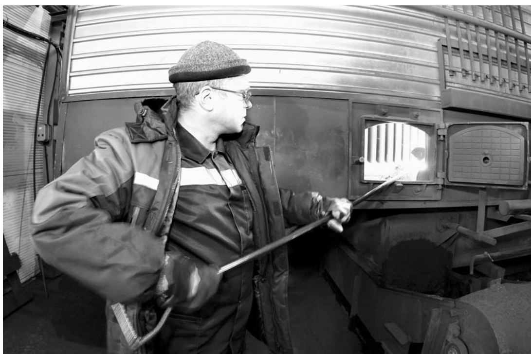
Новое котельное оборудование позволяет серьезно экономить ресурсы.

Конечно, теплая зима дает право делать лишь относительные выводы об экономии, но они очевидны на котельных с новым оборудованием — в Перясловке, Сидоровке, Победине, Топчихе, Хабазино... И там, где исключили теплопотери путем реконструкции зданий 22 школ, 13 детских садов, 3 учреждений допобразования. На эти цели краевой бюджет направил 35 миллионов рублей в 2018-м и 23 млн — в прошлом.