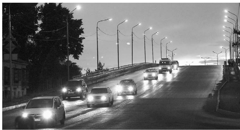
Света в Рубцовске — больше, а потребления электроэнергии — меньше.

Данный опыт принес положительные результаты. В результате модернизации достигнута существенная экономия бюджетных средств и повышено качество освещения. Поэтому в последующие годы местные власти продолжили практику заключения энергосервисных контрактов. Так, в 2019 году заменили почти 1000 светильников. Всего же за четыре года удалось в рамках двух энергосервисных контрактов