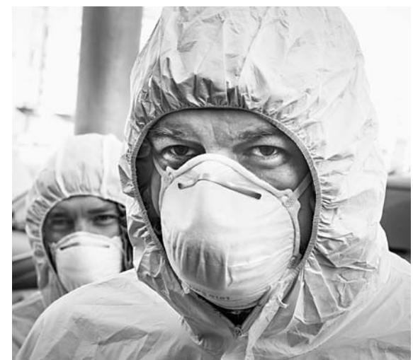
Спецотряд в действии.