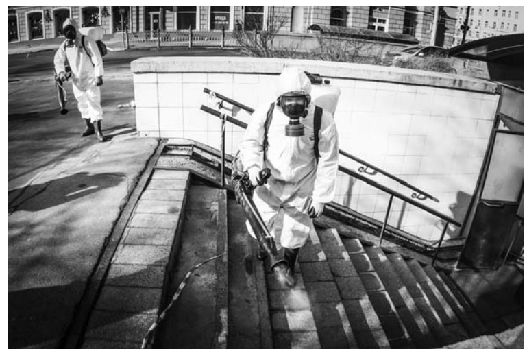
Остановки и переходы будут обрабатывать раз в неделю.

В краевой столице проводится дезинфекция территорий. К ним относятся подземные переходы, остановочные павильоны, улицы и дороги.