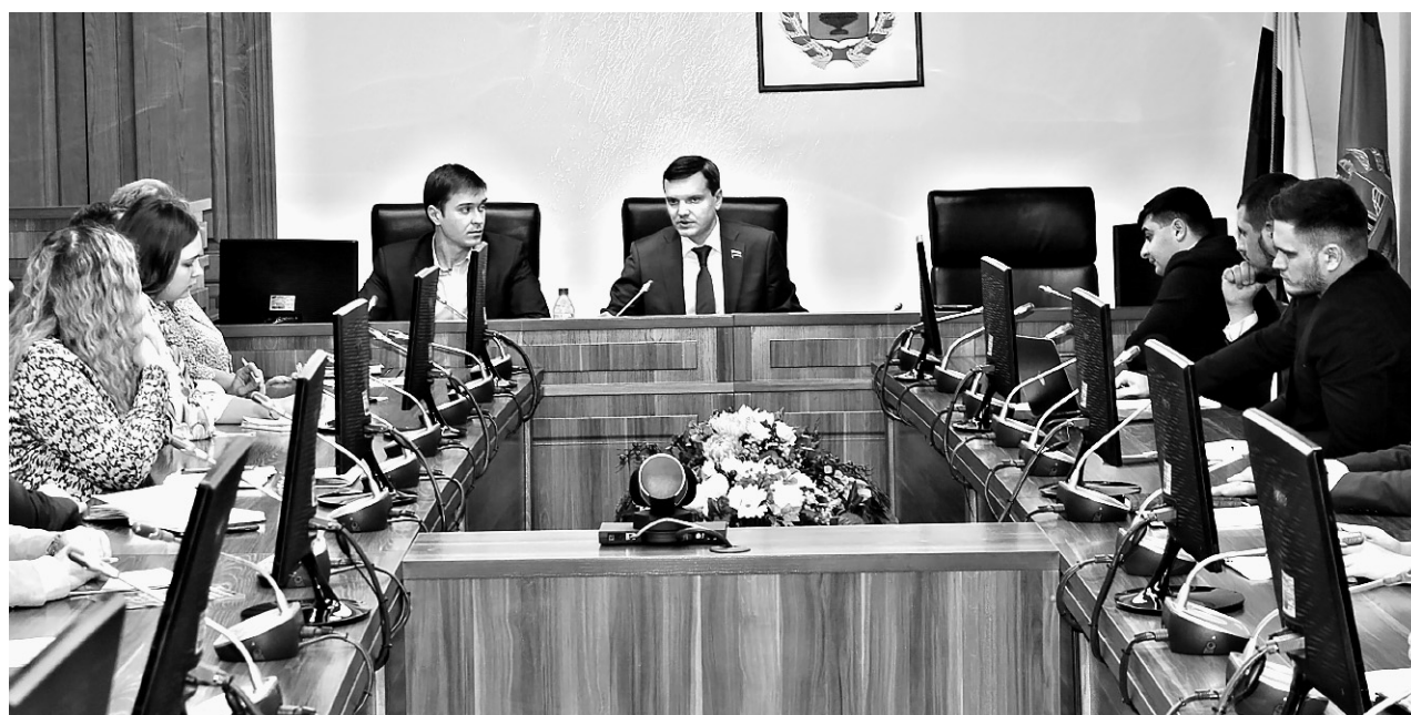
Во время обсуждения.

Россиян интересуют вопросы, касающиеся защиты и поддержки семьи. Вводится норма о том, что дети — важнейший приоритет государственной политики и долж-