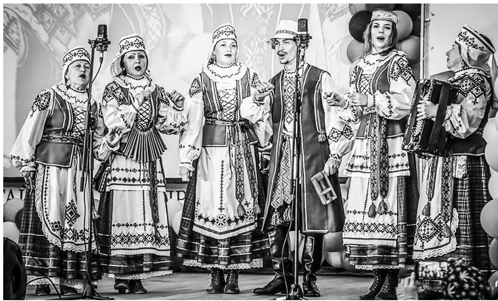
«Вячорки» – частый гость фестивалей и концертов.

всего двенадцать человек. Каждый – белорус на «половинку», «четвертинку» или по зову сердца.