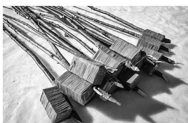
Лёд взрывают тротильными шашками.

вания Нового года. Саперам помогают местные – бурят лунки, заготавливают вехи. Так вот совместными усилиями и снимается угроза возможного наводнения.