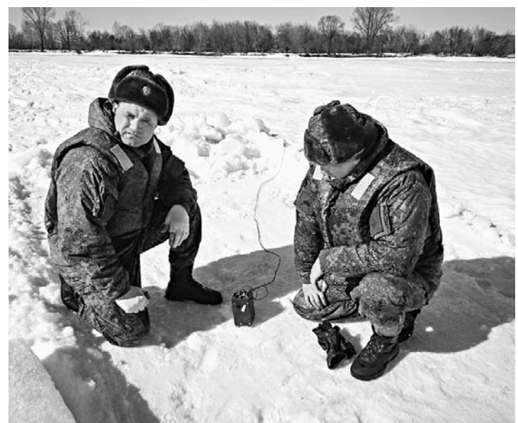
Военные сапёры за работой.

Каждый год во сне несколько поселков Бийского района замирают в ожидании ледохода. Из-за затопления льда может случиться подтопление, которое принесет много бед жителям. Чтобы этого не произошло, ежегодно на Бии военные предприниматели прорывают меры. Говоря по-простому, торосы взрывают.