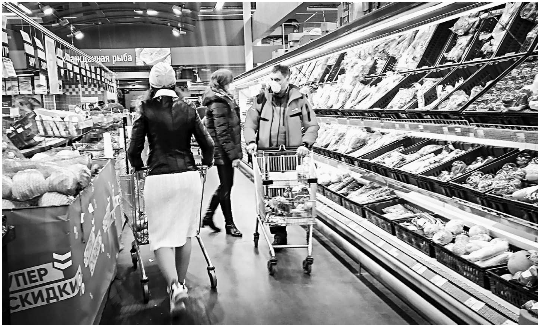
Барнаульские супермаркеты работают в обычном режиме.

Барнаульская городская больница № 5 перепрофилируется в госпиталь на 360 коек для лечения новой коронавирусной инфекции. «В нем предусмотрены палаты для пострадавших, которым требуется искусственная вентиляция легких, для пациентов, нуждающихся в кислородной поддержке дыхания, также