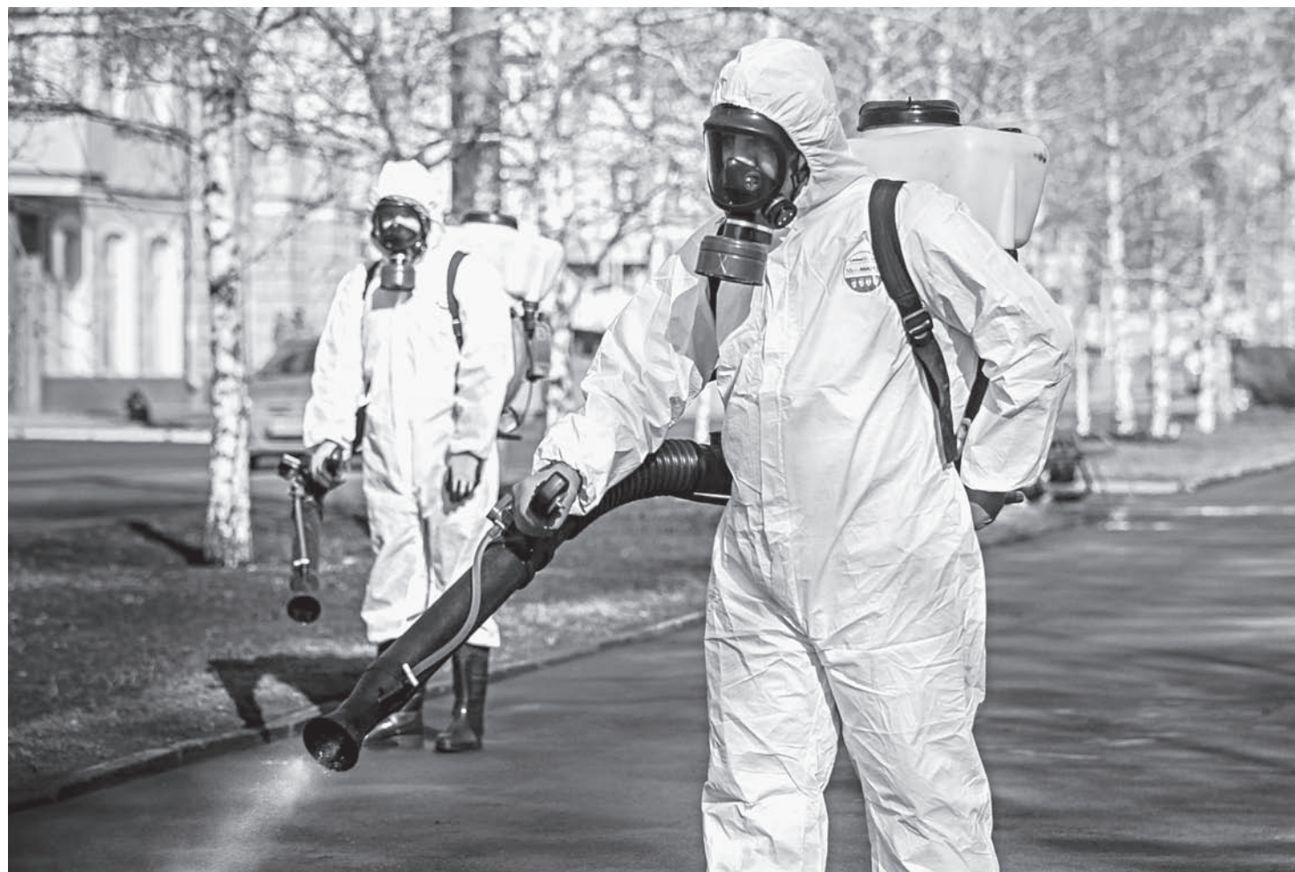
Гигиена. Самоизоляция. Дезинфекция улиц краевого центра.