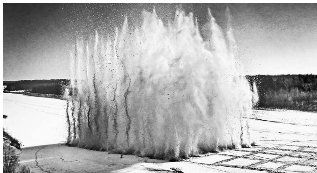
Глубокий вздох реки.

Глава Устьского сельсовета сообщила, что работы по подрыву льда производятся с 2002 года, в этом Бийский район постоянно выручает военная часть из Алейска. Договор с ней заключается еще до праздни-