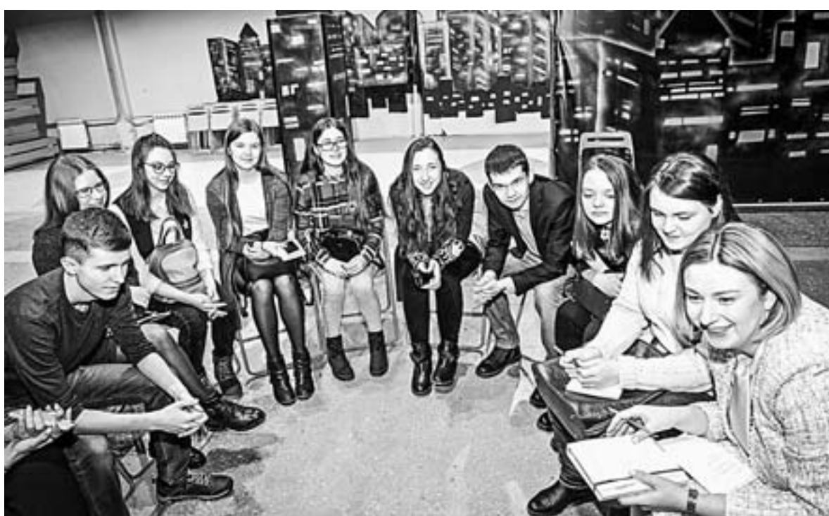
Участники выполняют практическое задание.

На базе краевой образовательной программы научат писать новости, делать хорошие снимки. Расскажут, как стать теле- и радиоведущим, продвигать себя в Интернете и многое другое. Занятия будут проходить два раза в месяц по субботам. По итогу участники получат сертификаты о пройденном обучении.