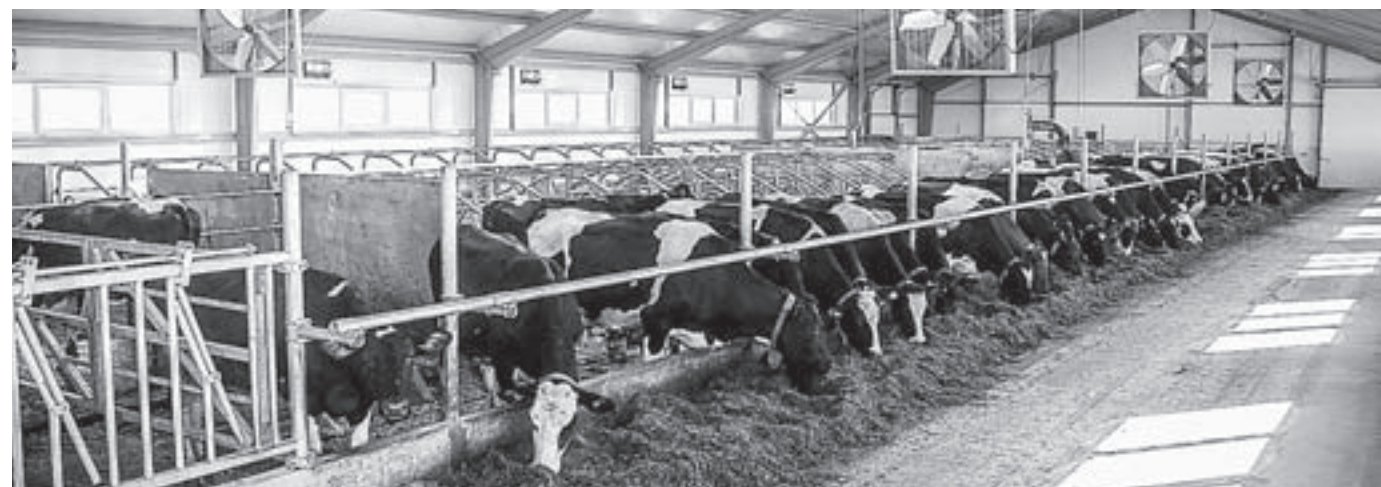
Сейчас на работоферме 60 коров, а будет 67.