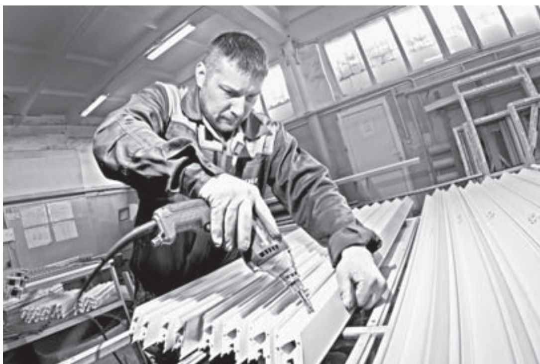
Мощности цеха позволяют изготавливать 70 оконных профилей в сутки.

– В своем городе мы застеклили все учреждения, от роддома до morga, – шутит предприниматель. – Нам доверяют, мы в списке добросовестных подрядчиков, если беремся, то сроки не затягиваем и с качеством не подводим. Последний объект, сданный в Заринске, – детская поликлиника.