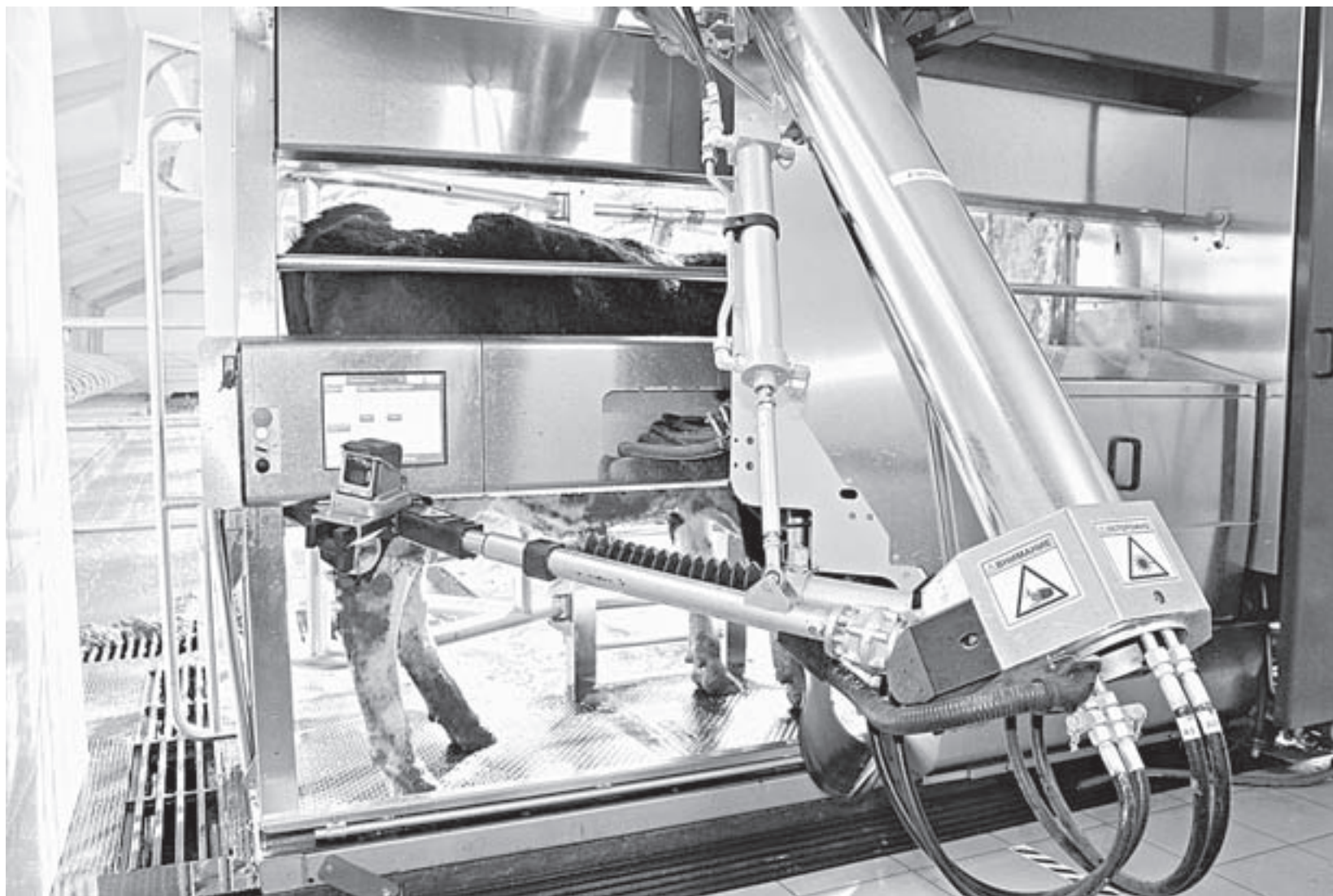
Вот так робот доит корову.

В селе Фунтики Топчихинского района появилась первая в Алтайском крае роботизированная ферма, в которой умные машины доят, кормят буренок и даже почесывают им бока.