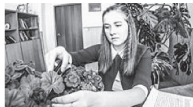
Работает секция лекарственных растений.

ДАННЫЕ ИССЛЕДОВАНИЙ ЗАФИКСИРОВАНЫ В ОТЧЕТЕ И ПЕРЕДАНЫ В МИНПРИРОДЫ РЕГИОНА. ЛОГИЧНЫМ БЫЛО БЫ ИСПОЛЬЗОВАНИЕ ЭТИХ МАТЕРИАЛОВ В РАБОТЕ С ПРЕДПРИЯТИЯМИ, ЧЬЯ ДЕЯТЕЛЬНОСТЬ ДАЕТ ОСНОВНУЮ НЕГАТИВНУЮ НАГРУЗКУ НА БИОЦЕНОЗ.