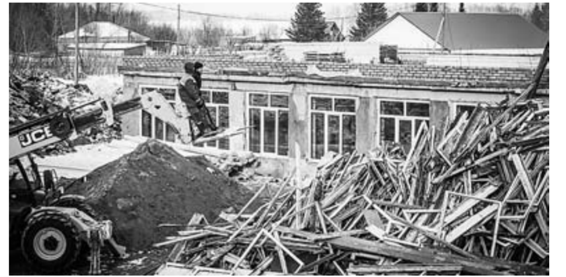
Из демонтированных материалов можно построить целый дом.

– Когда освобождали помещение, какая-то мебель развалилась. Настолько она была ветхая, – рассказывает