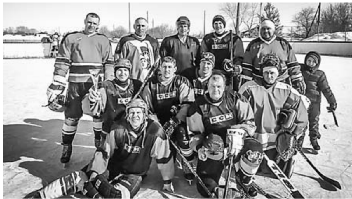
Хоккейная команда Баевского района.