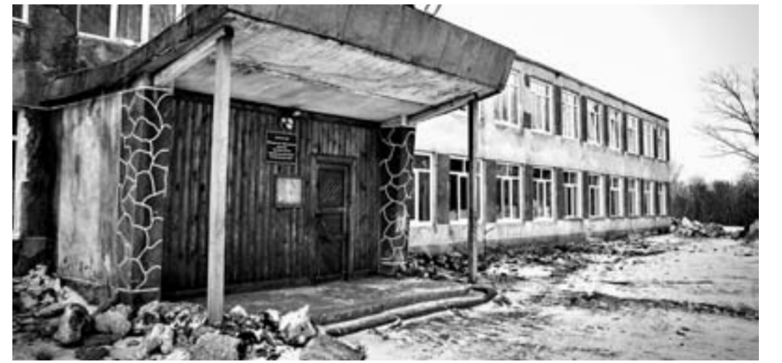
Это первый капремонт в Паутовской школе.

Кашлева. – Старые шкафы просто страшно ставить обратно, особенно когда вокруг все обновится.