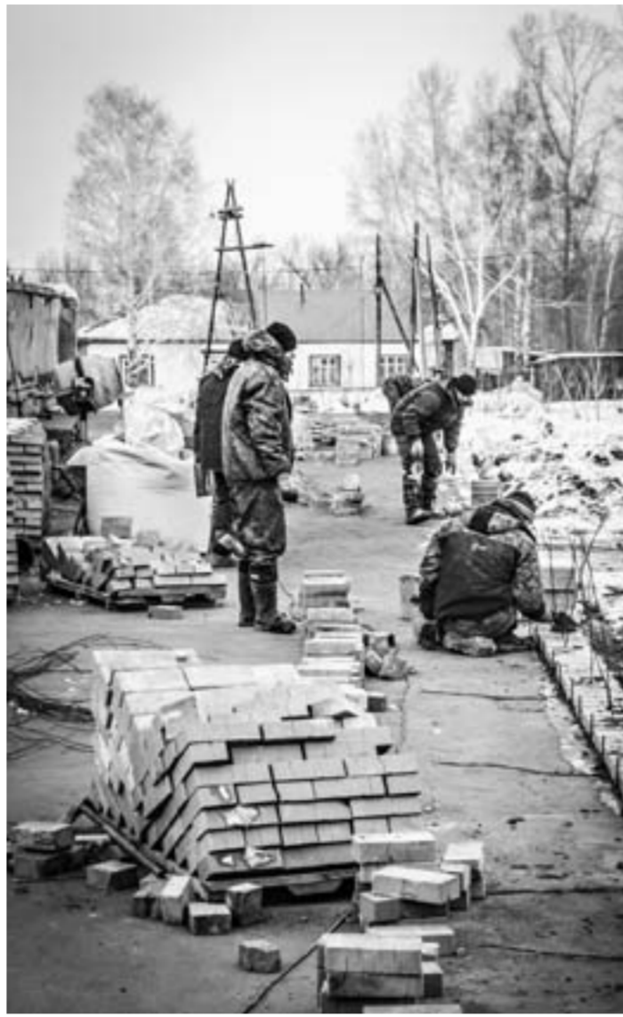
Сейчас основные работы идут на крыше.

Через полгода Паутовскую школу ждет капитальное об-