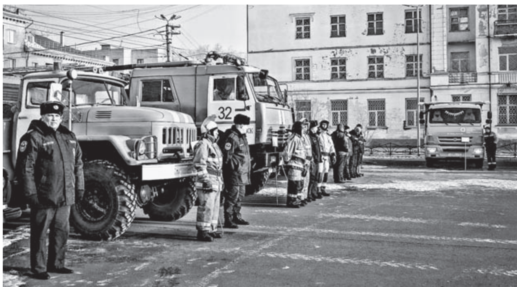
В Рубцовске провели смотр готовности сил и средств.

Между тем ученые умы второй год бьются над загадкой внезапного поднятия грунтовых вод. На изыскательские работы выделены немалые средства – около 9 млн руб. В итоге разработан проект дождевой канализации для отвода атмосферных осадков и талых вод, а также дренажной системы и водоема-отстойника. Полная стоимость строительства всего комплекса сооружений выхо-