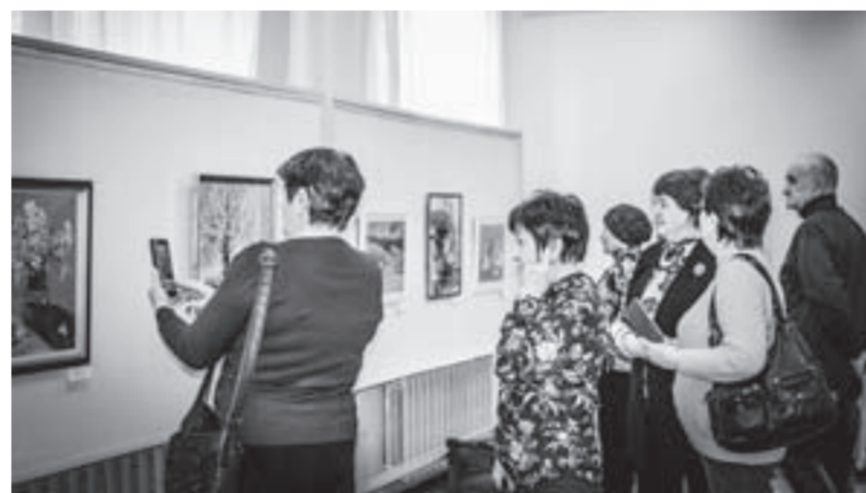
Посетители проявили большой интерес к выставке.

– У меня занимаются ребятами в возрасте от трех до 11 лет. Чьи-то способности видны сразу, а кого-то нужно раскрывать. Для этого подобрать интересные техники, разные жанры. Если