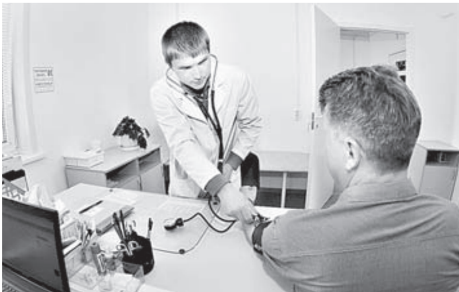
Первичному звену необходимы терапевты и педиатры.

Выполняется серьезная комплексная работа по подготовке, закреплению специалистов, – сказал он, – их распределению по территории края, приближению квалифицированных врачей к