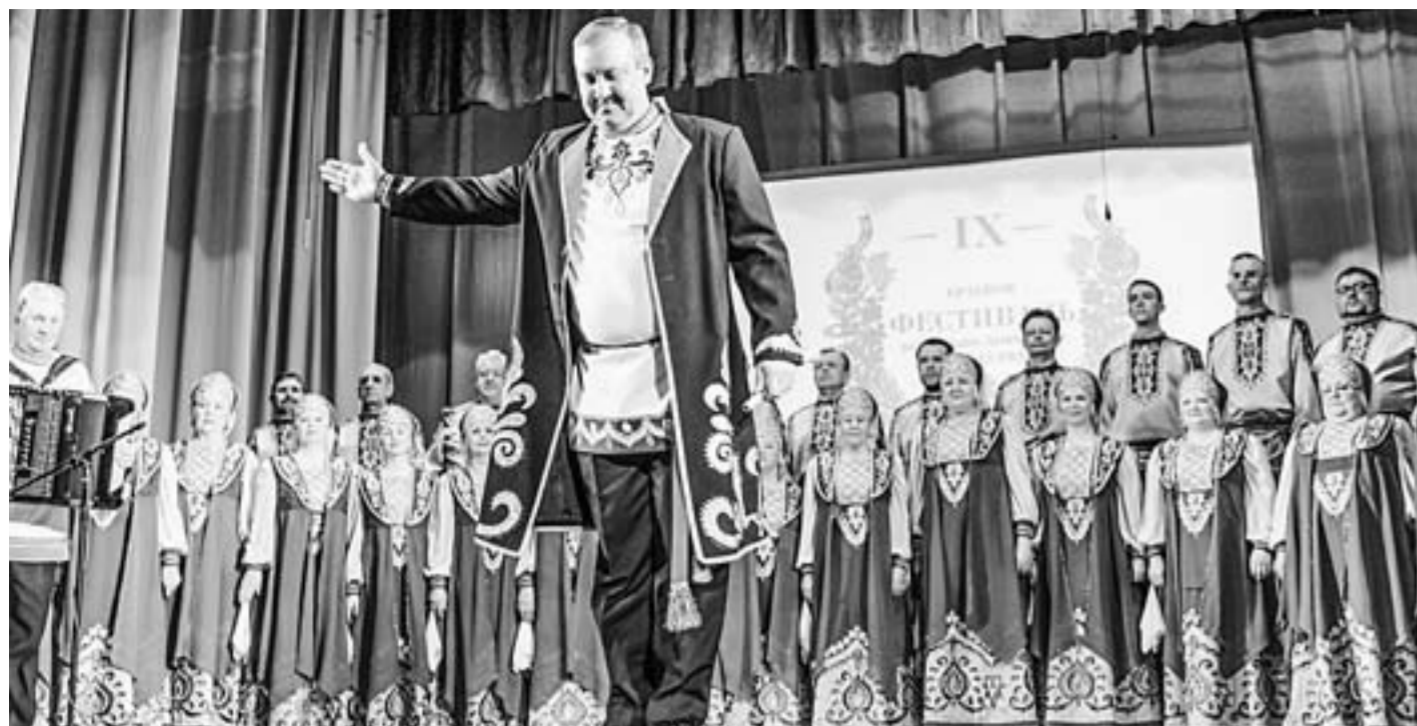
Народный ансамбль «Звонница» – неоднократный участник фестиваля.