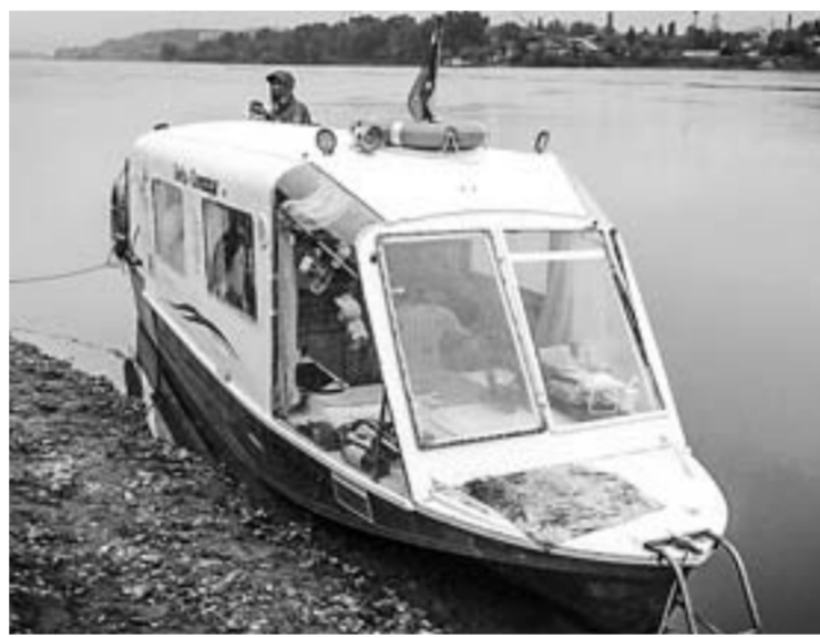
Легендарный катер, прошедший всю Обь в 2018 году.

– Прежде нас ждет сухопутная часть путешествия, когда придется катер дотащить до места отплытия, то есть Кызыла. У нас есть легкая сумасбродная идея – хотим