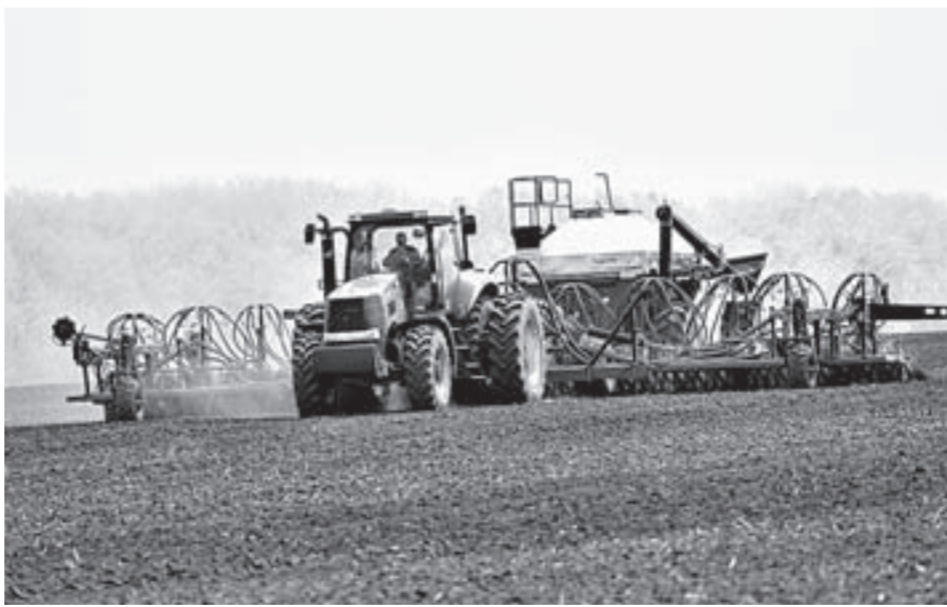
Аграрии края уже получают господдержку на нынешний год.

По данным регионального Минсельхоза, государственная поддержка сегодня трансформирована в два направления: компенсирующая и стимулирующая суб-