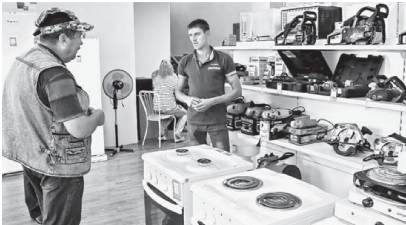
Владельцам маленьких магазинов со следующего года запретят работать на ЕНВД.

ФНС России считает, что создает в стране стройную налоговую систему и отмена в следующем году единого налога на вменённый доход (ЕНВД) лежит в логике этого процесса. На прошлой неделе около 600 предпринимателей края пытались разобраться в перипетиях реформы. А помогло им в этом руководство регионального управления ФНС.