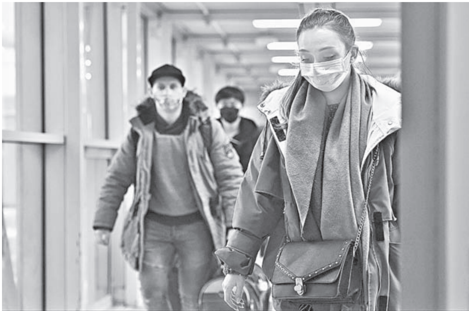
Профилактика – лучший способ уберечься от инфекции.

Несколько извещений края решили перейти на дистанционное обучение из-за коронавирусной инфекции в соответствии с рекомендацией Министерства науки и высшего образования РФ. Также принято решение о том, что школьники уйдут на каникулы досрочно – с 20 марта.