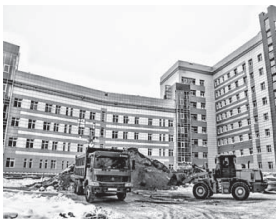
Завершить строительство-реконструкцию планируется до конца 2021 года.

Активные работы возобновились в 2018 году. Спивак подчеркнул, что риски повторной заморозки строительства исключены, поскольку про-