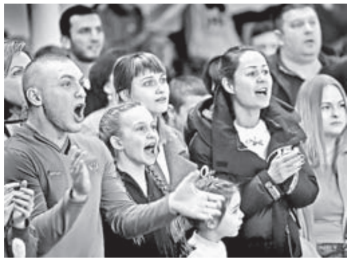
Спортсмены горячо поддерживали своих товарищей.

Самое интересное организаторы оставили напоследок – 8 марта награды разыграли старшие спортсмены.