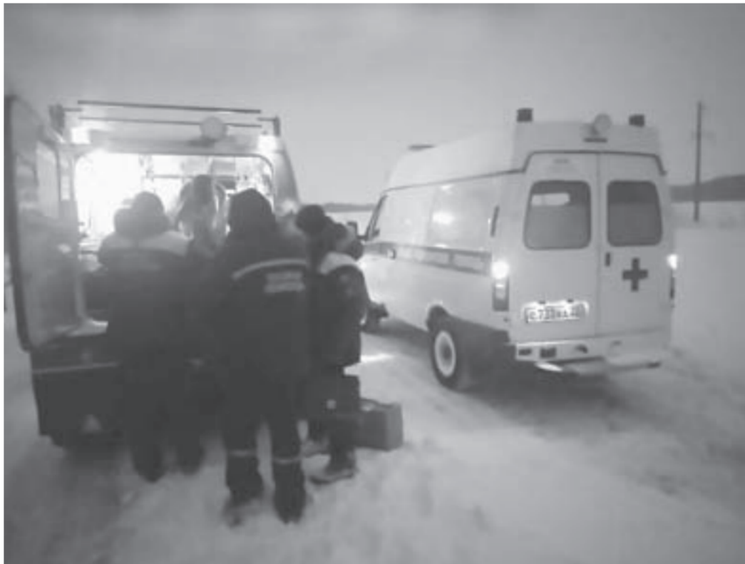
Поздним вечером 9 марта у села Родино спасали роженицу.