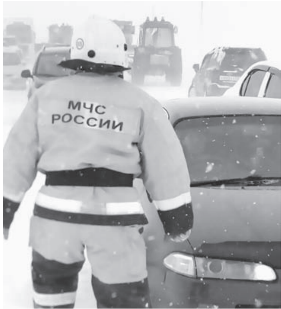
Спасатели уже несколько суток работают в режиме повышенной готовности.

Благодаря оперативным действиям сотрудников МЧС и врачей 9 марта в Алтайском крае была спасена жизнь роженицы и ее малышки.