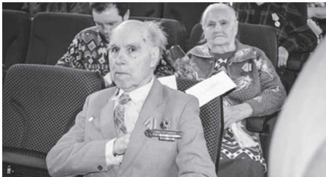
Медали к 75-летию Победы – еще один повод собраться вместе.