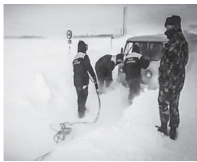
В метель лучше оставаться дома.

– Роды у женщины не первые, поэтому она немного запаниковала, когда скорая не смогла пробиться к ним из райцентра, – сообщили нам в пресс-службе ведомства. – С помощью снегохода и вездехода «Лось» ребята доставили ее до скорой, далее – Шипуново, а там уже врачи приняли решение отправить роженицу в краевой перинатальный