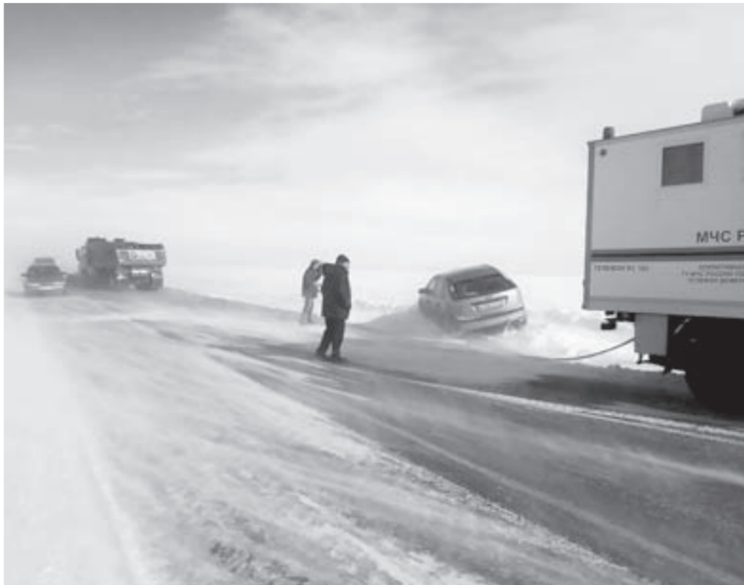
На 10 марта ограничение движения действовало на 15 участках краевых автодорог.