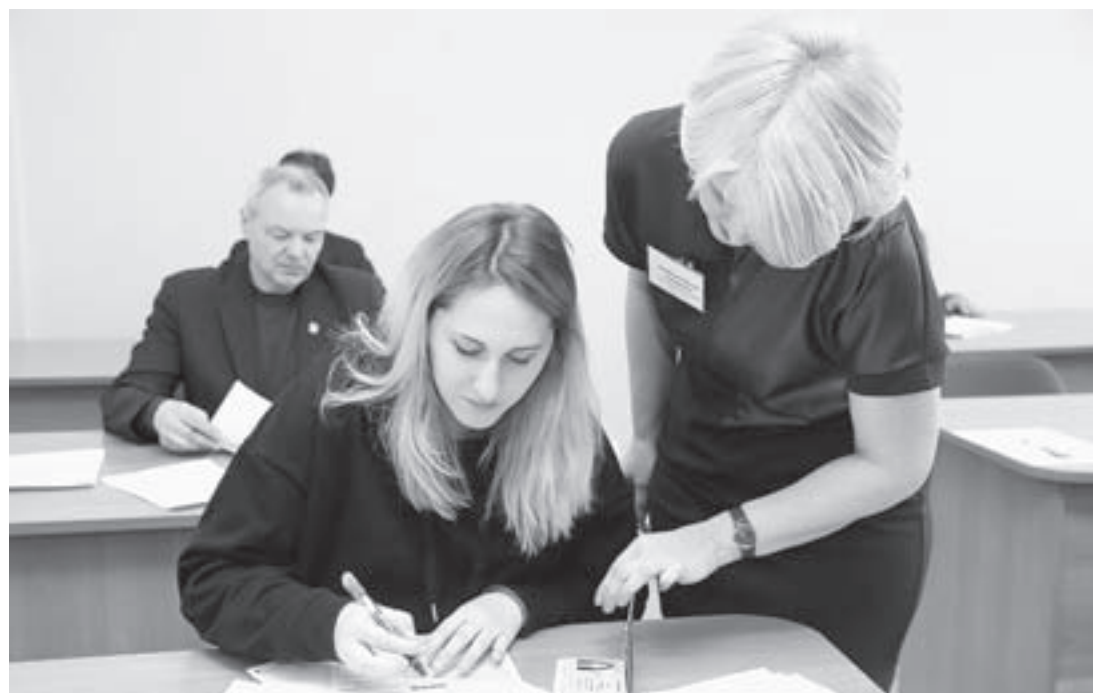
Словнее всего оказались правильно заполнить бланки.