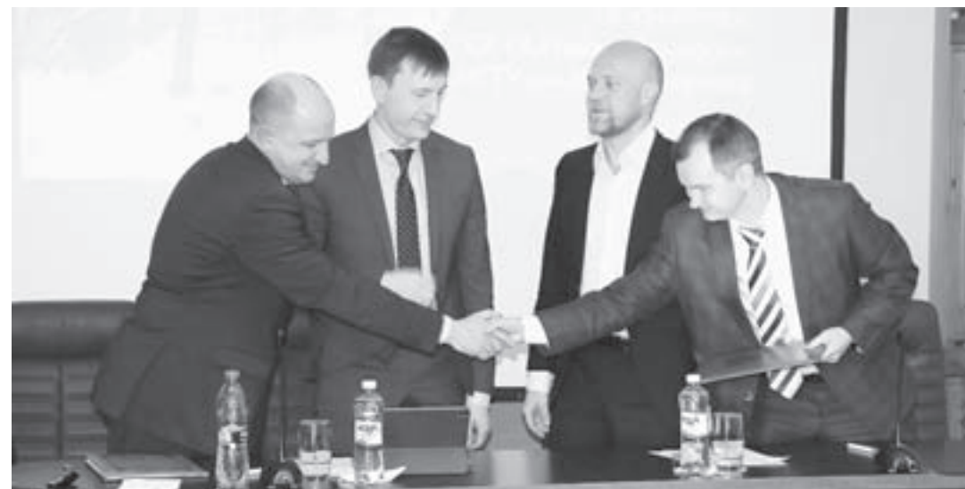
Рука об руку с прогрессом.

2 марта в Барнауле было подписано сразу два четырехсторонних соглашения. Их реализация повлечет за собой цифровую трансформацию региона, которая коснется сферы промышленности, кибербезопасности, транспортной инфраструктуры и подготовки IT-специалистов.