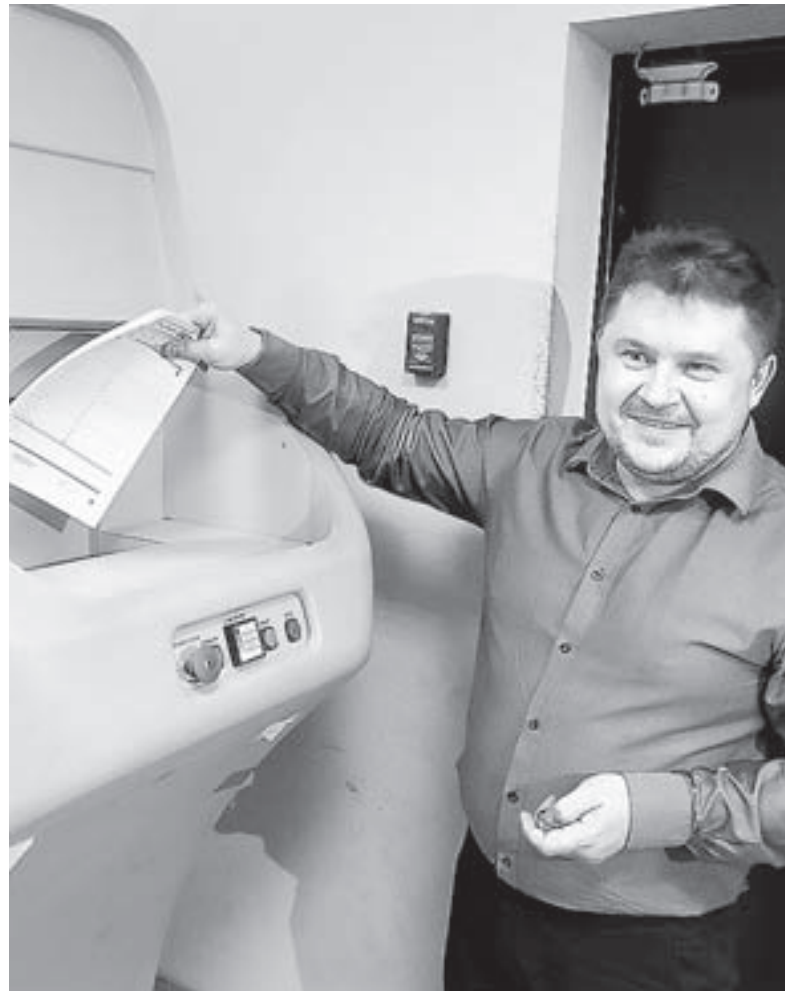
Экзаменационные материалы должны быть уничтожены в shredder.

Всероссийская акция «Единый день сдачи ЕГЭ родителями» вновь прошла в Барнауле в Алтайском краевом информационно-аналитическом центре (АКИАЦ). Она была посвящена Году памяти и славы, так что сдавали в этот день историю.