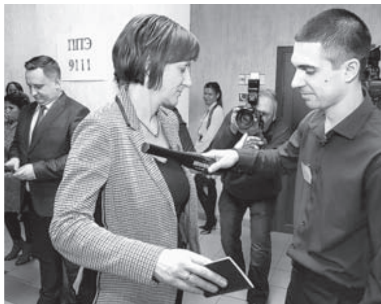
Обязательный пункт – проверка металлодетектором.