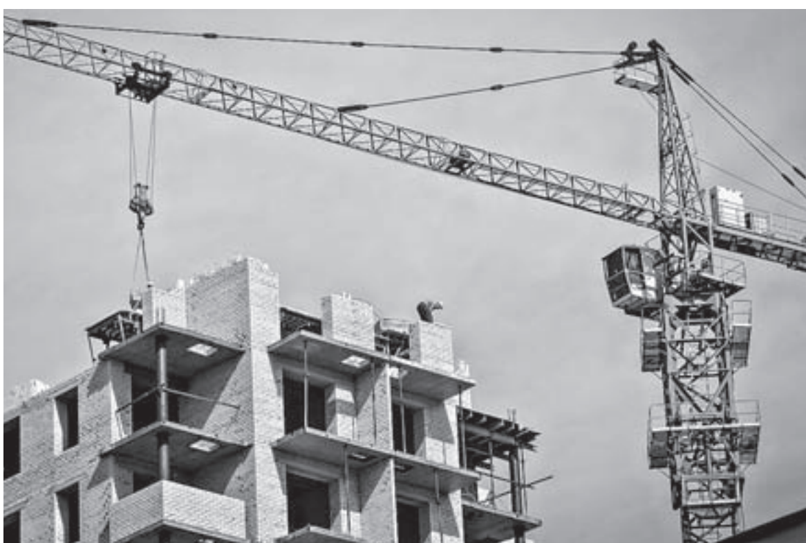
Прирост вводимого в этом году по Сибири жилья, по прогнозам, составит 21 процент.

В рамках Сибирской строительной недели в Новосибирске прошел круглый стол, на котором обсудили, как эффективно развивать строительную отрасль в свете задач, поставленных президентом РФ.