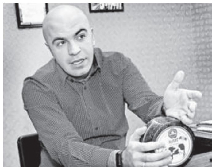
«Нашим клиентам нужен сегодня хороший твердый сыр».

Сотни деловых контактов, десятки наград и первые поставки алтайских продуктов. Алтайский край на крупнейшей международной выставке продуктов и напитков «Продэкспо» представил порядка 50 компаний. По итогам конкурсных испытаний алтайские предприятия и их продукты были признаны лучшими.