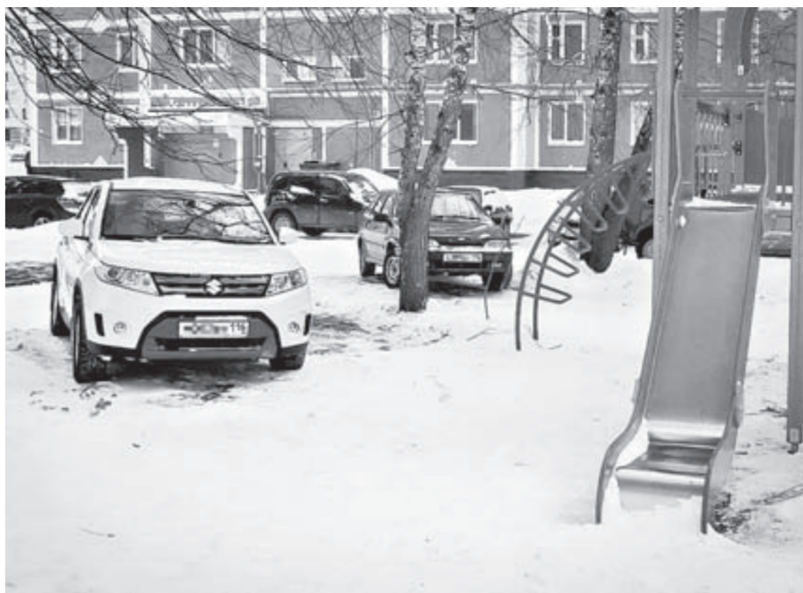
Машины на детских площадках – знакомая картина.

Депутаты краевого парламента предлагают наказывать рублем нерадивых водителей за парковку на детских, спортивных площадках и площадках для выгула животных. А также выносить штрафы предпринимателям, собственникам частных и административных зданий и строений за несвоевременную уборку листьев, снега, наледей и сосулек на кровле.