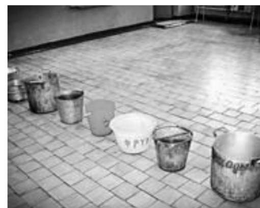
Вместо кровли – тазы и ведра.