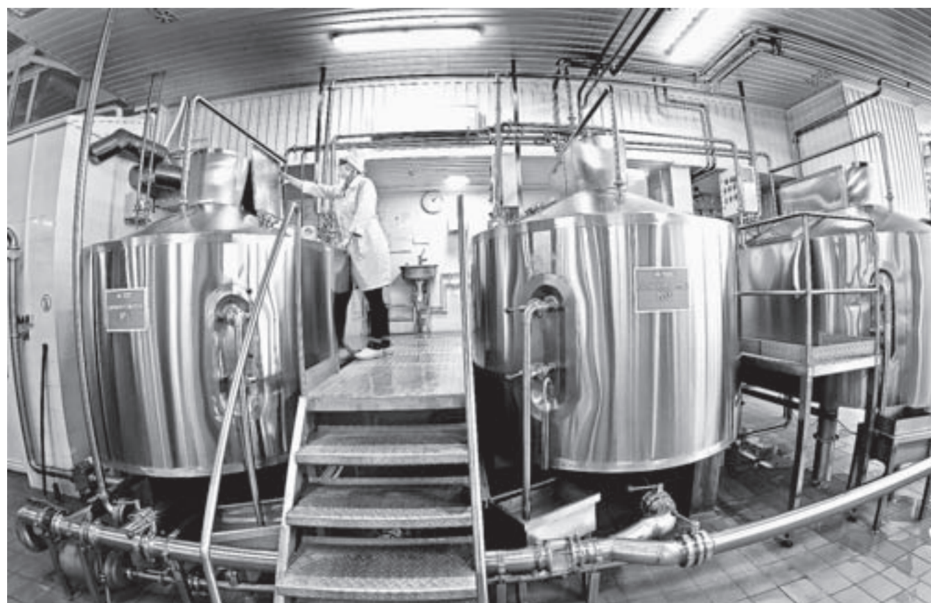
В цехах завода стерильность абсолютная.