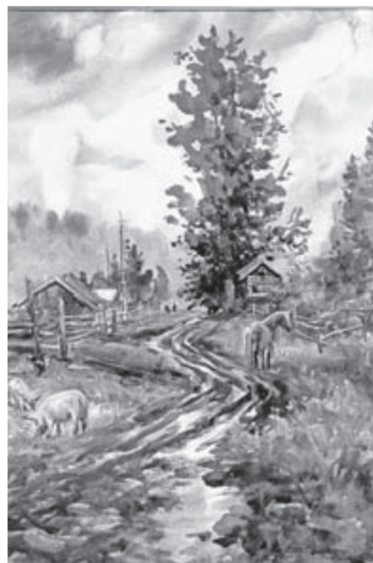
«После дождя. Майорна» (2017).