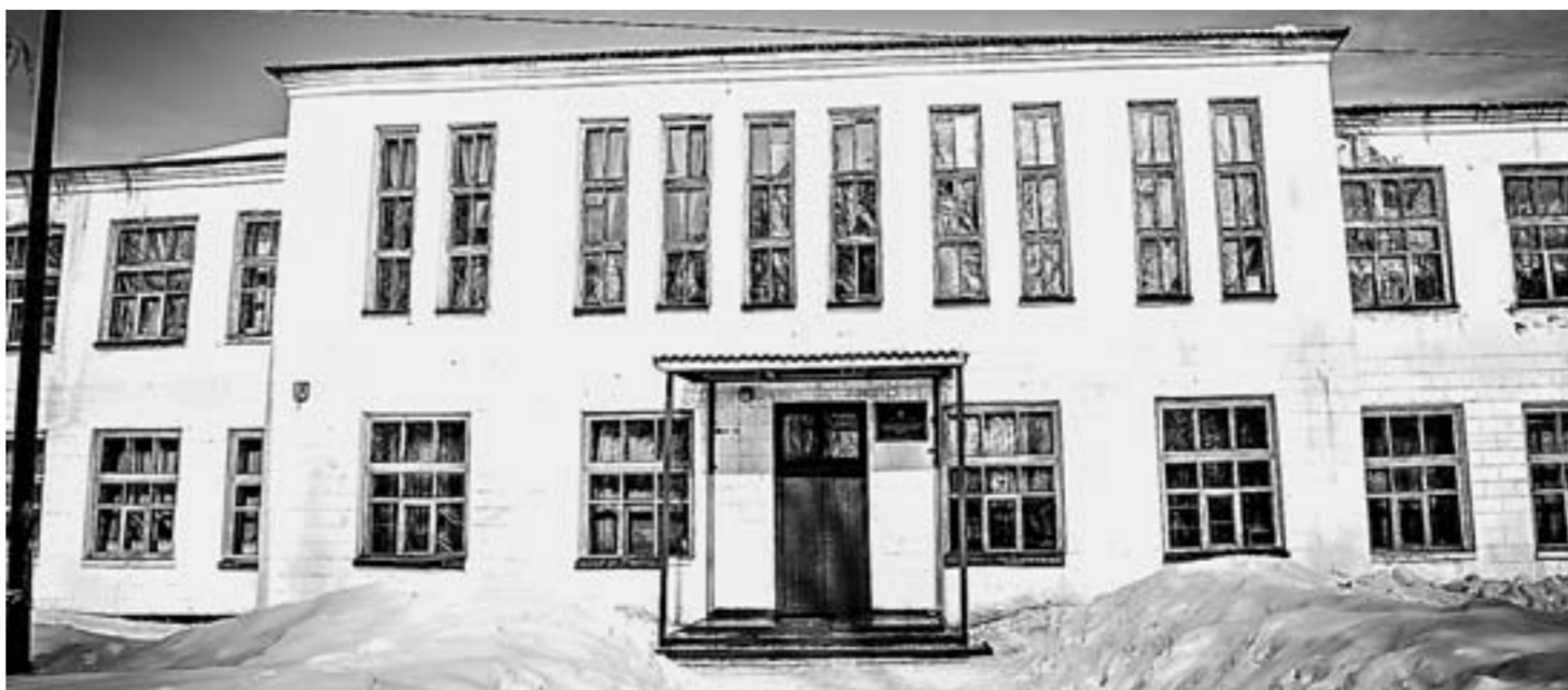
Школа в ожидании ремонта.

К 1991 году в школе уже позинисились батареи, оконные рамы, начали протекать полы. Тогда была составлена смета для ремонта на 500 с лишним тысяч, но все перечеркнула перестройка.