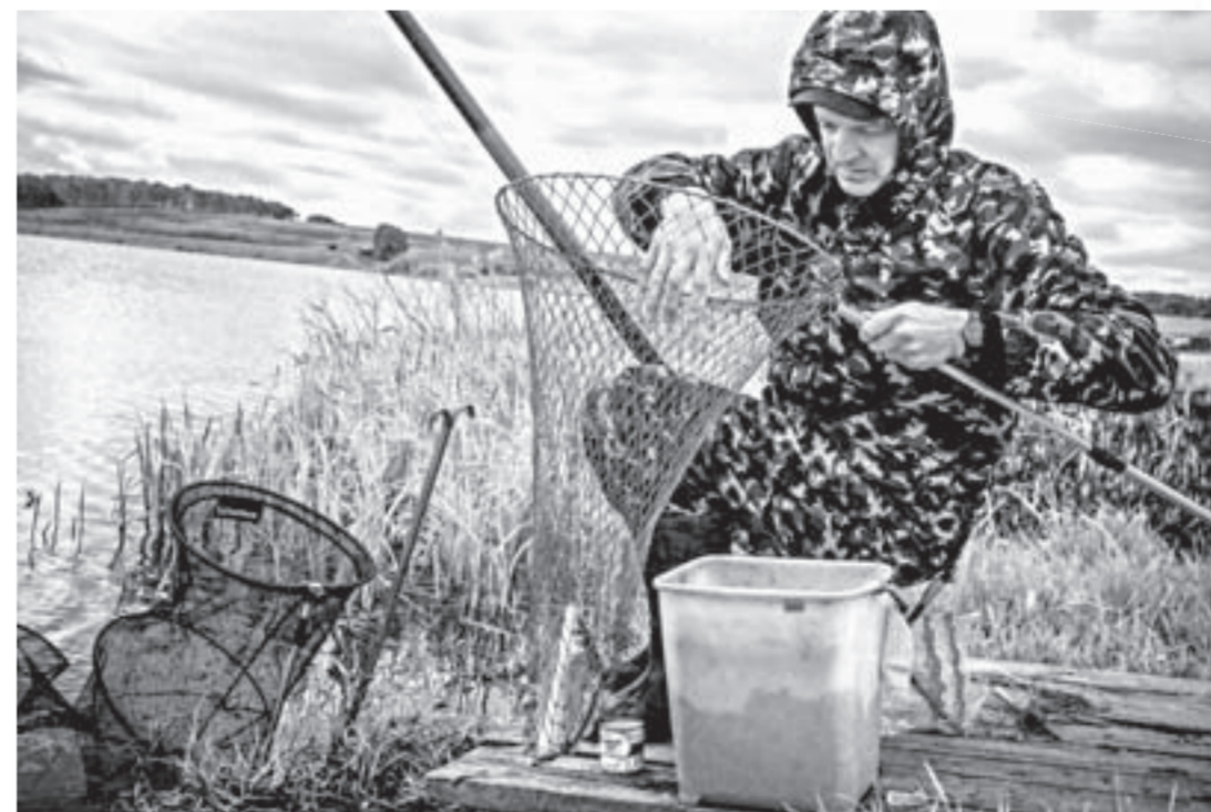
В 2021 году любительская рыбалка может сильно измениться.

рыболовства. Из них в аренду было передано три водохранилища – Бешенцевское, Чеснокское и Сорочьеголовское. Зарыбление этих озер привело к улучшению видового состава