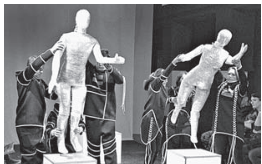
Спектаклю не откажешь в эффектном оформлении.