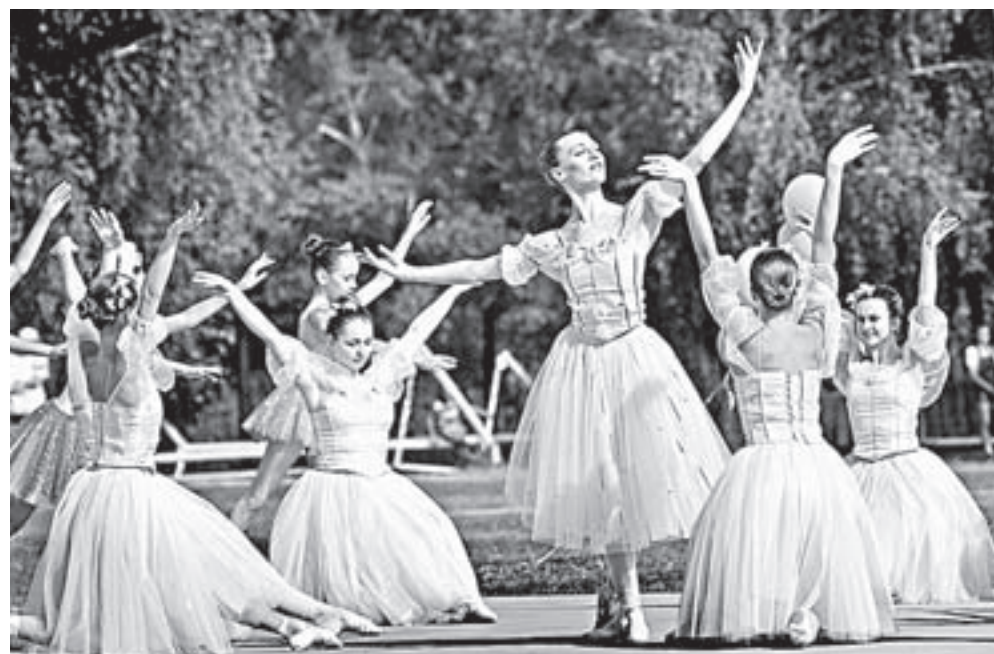
Дельфийские игры – крупнейшее творческое состязание молодежи.

XX краевые Дельфийские игры впервые пройдут в Славгороде. 17 февраля город выиграл право принять Игры в конкурсе среди муниципалитетов края.