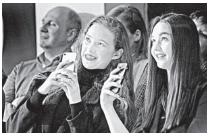
Зрителей здесь не просят выключить телефоны.