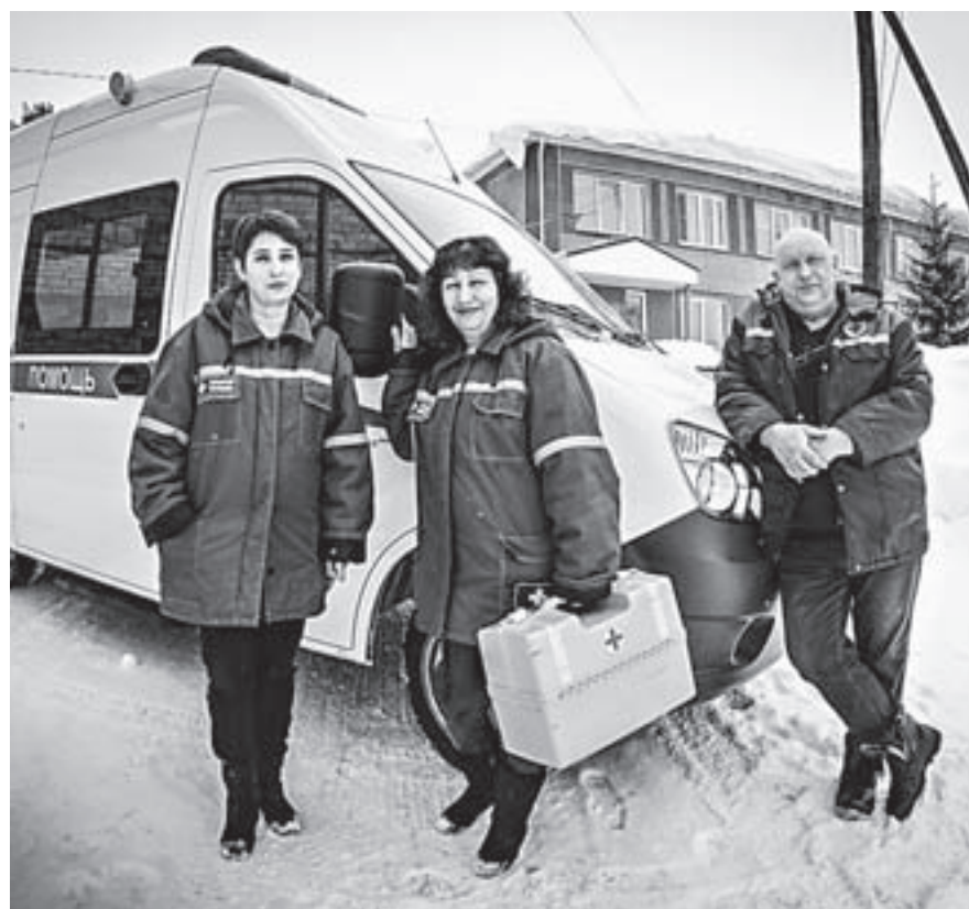
Служба скорой помощи оснащена новыми машинами.

– Много. Отремонтировано детское и терапевтическое отделения ЦРБ, оперблок. Приведена в порядок и оснащена оборудованием поликлиника – сейчас она работает с восьми до восьми, по удобному для сельчан режиму. Скорая помощь получила два новых автомобиля класса В со всем необходимым для работы фельдшерской бригады. Теперь медики экстренной службы, не теряя драгоценных минут, выполняют по пути в больницу тромболитиз, спасают жизнь при инфаркте. За счет программ «Земский доктор» и «Земский фельдшер» снята острота кадровой ситуации. В район приехали три терапевта, два стоматолога, дерматовенеролог, фельдшеры в ФАПы Андронов, Юдики,