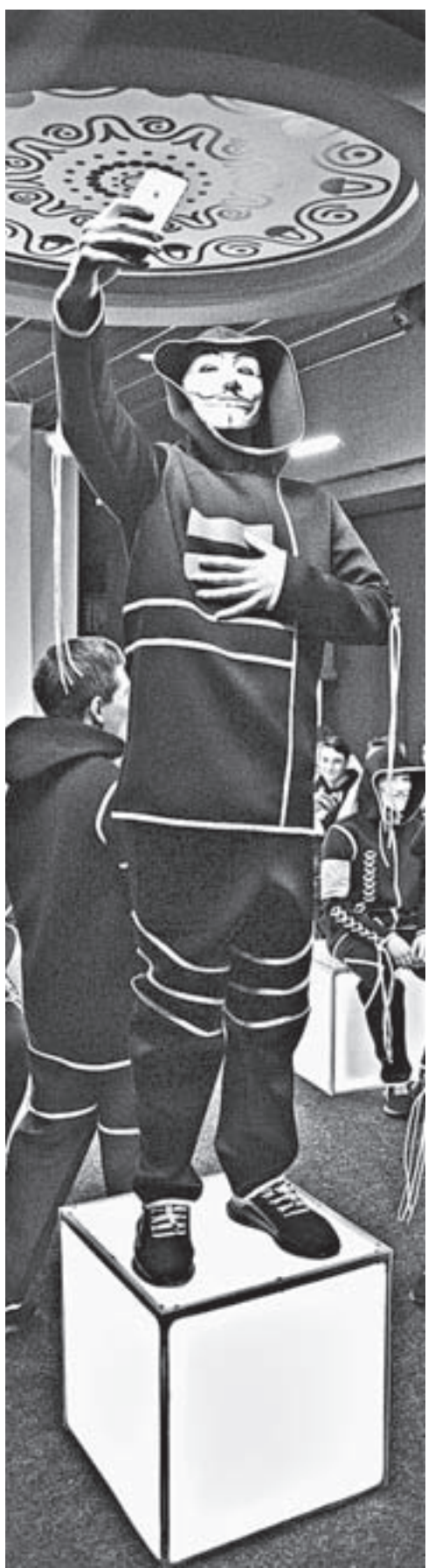
Маска Гая Фокса как символ анонимности.

В театре кукол «Сказка» прошла премьера спектакля online – именно так, с маленькой буквы, пишут название постановки ее авторы. Своих зрителей они приглашают поразмышлять над феноменом «человека медийного», то есть практически любого живущего сегодня.