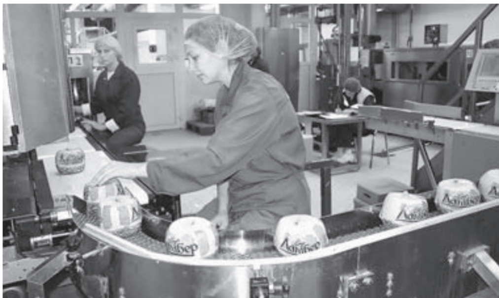
Рубцовский молочный завод продолжает наращивать объемы выпуска продукции.

Уверенно развивает свое производство Рубцовский молочный завод – филиал «Вимм-Билль-Данн». По цифрам он лишь немного уступает лидеру: 8 млрд 178 млн руб. Молочная сыроворотка и сыр «Ламбер» пользуются большим спросом по всей России. Это связано в том числе и с программой импортозамещения.