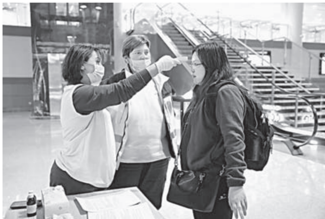
Прилетающие из Китая проходят тщательный осмотр.

– Приезжающие из Китая попадают к нам, минуя не менее двух-трех барьеров, первый из которых при вылете из КНР. Тем не менее всех в обязатель-