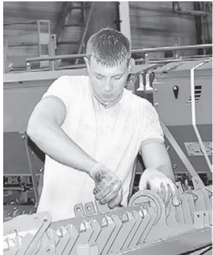
Рубцовский завод запасных частей производит нужную аграриям технику.