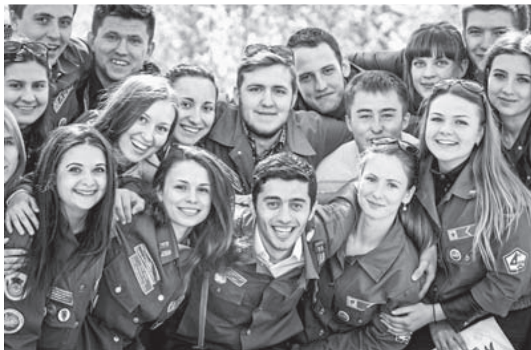
Студотрядовская дружба самая крепкая.

Алтайские бойцы славятся добрыми делами, они уверенно справляются с серьезными задачами и несут ответственность за свои поступки. Студенты и ветераны движения гордятся междузвонским педагогическим отрядом «Аврора», который два года подряд становится лучшим в стране. В этом большая заслуга коман-