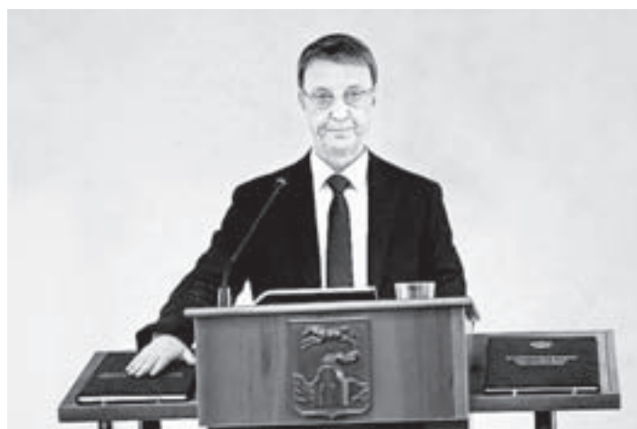
Градоначальник принес присягу.