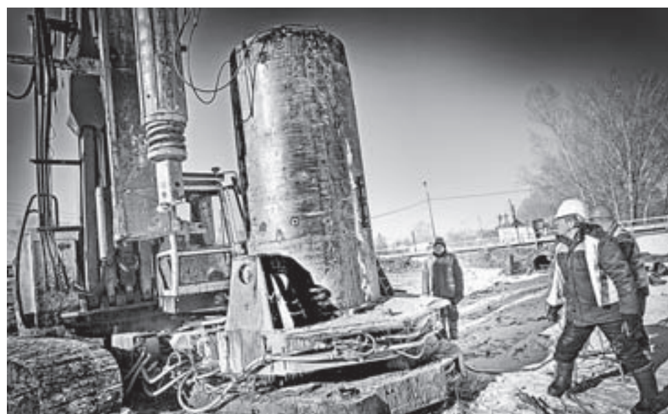
Устройство буронабивного столба.

Константин СОМОВ, Евгений НАЛИМОВ (фото)