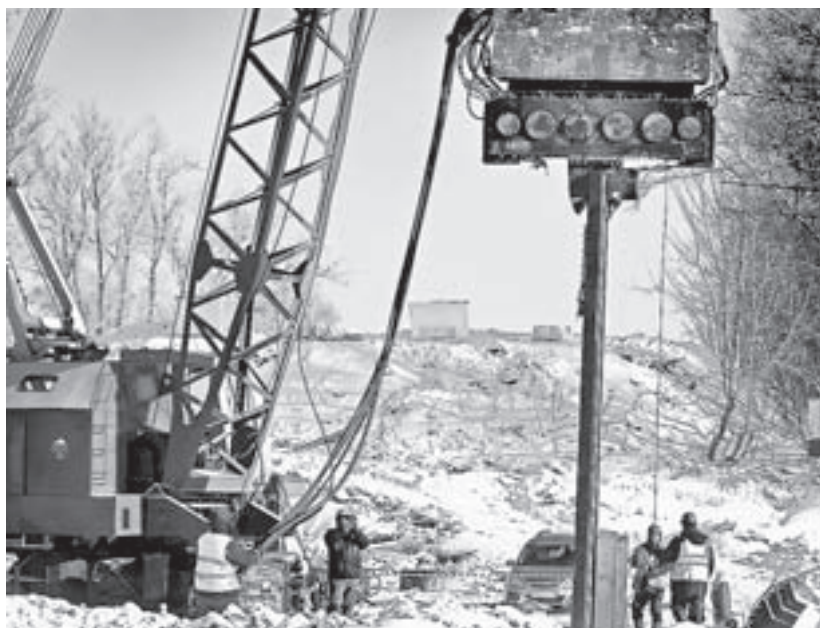
Готовится основание опоры № 5.

За время эксплуатации регулярно проводился текущий ремонт дорожного покрытия, перил, косме-