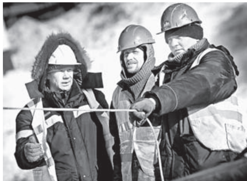
Работа у мостостроителей ладится, а значит, и настроение хорошее.