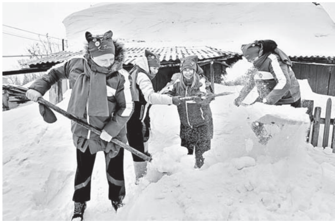
Боролись с сугробами как парни, так и девушки.