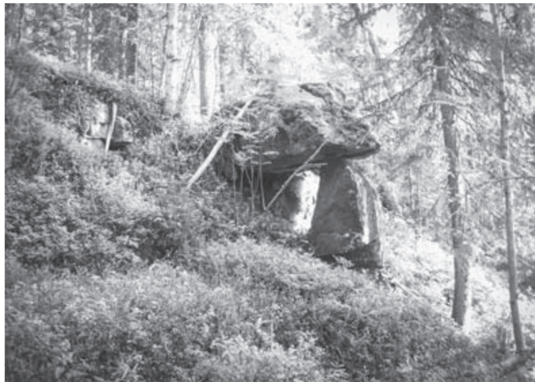
Окрестности горы Нято-Вара.