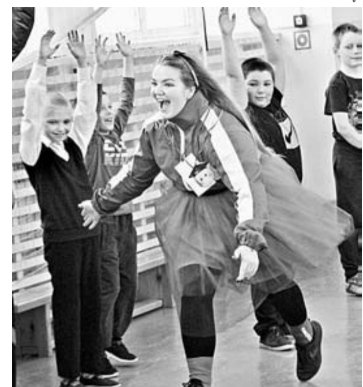
Урок с «десантниками» прошел весело и интересно.

Екатерина ЗЕЛЕНОВА, Андрей КАСПРИШИН (фото)