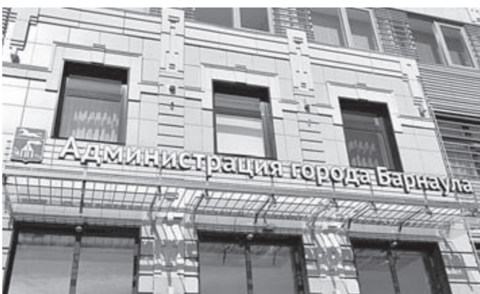
14 февраля депутаты выберут нового главу Барнаула.