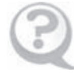
Подготовила Светлана ЯКОВЛЕВА

Напомним, с 1 января страховые пенсии 568 909 неработающих пенсионеров в Алтайском крае были проиндексированы на 6,6%.