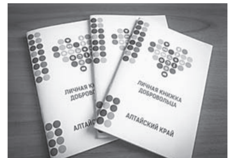
Так выглядит волонтерская книжка, которую вручают в нашем регионе.

Сегодня на борьбу со снегом и гололедом направлены все силы