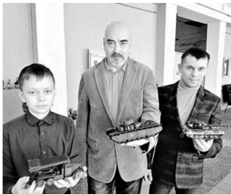
Авторы с моделями.