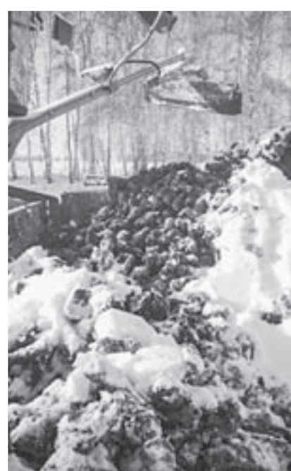
Идет погрузка свёклы.