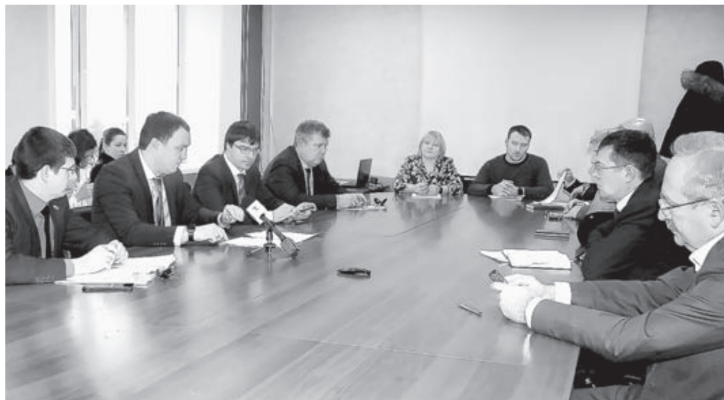
Пострадавшие алтайские предприниматели решили выработать общую стратегию.