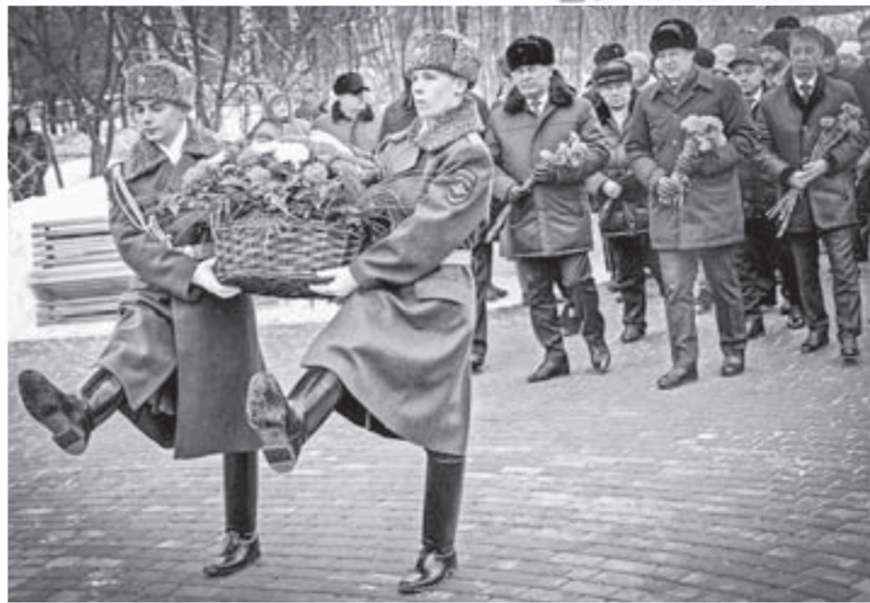
Первые лица края и Барнаула возложили цветы к памятному знаку.