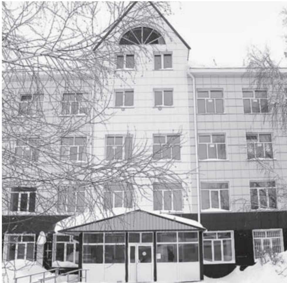
Фасад детской больницы тоже преобразился.