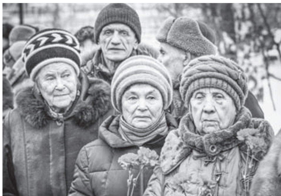
Памятный знак посвящен ленинградцам-блокадникам и воинам-сибирякам, участникам полного освобождения Ленинграда от немецко-фашистской блокады.