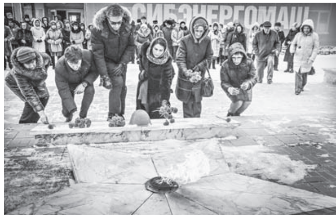
Цветы к Вечному огню.