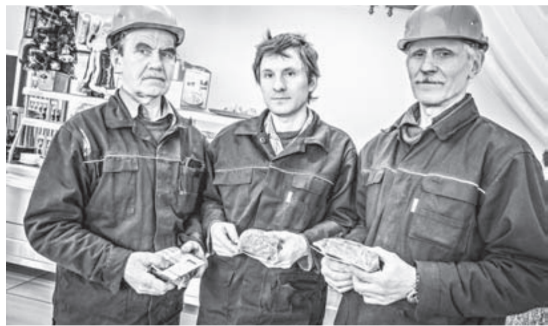
Заводчане с кусочками блокадного хлеба.