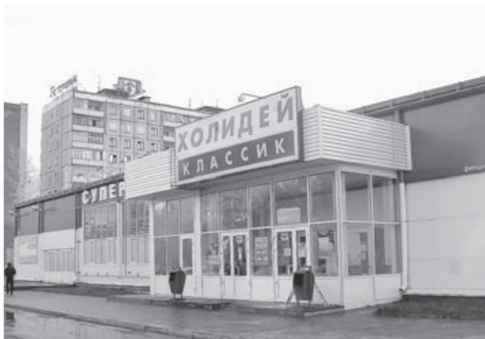
Проблемы «Холидей» отразились на работе более 100 его поставщиков.

После банкротства «Холидей» несколько месяцев долги мало-помалу гасились, но уже в сентябре дело перевернулось с