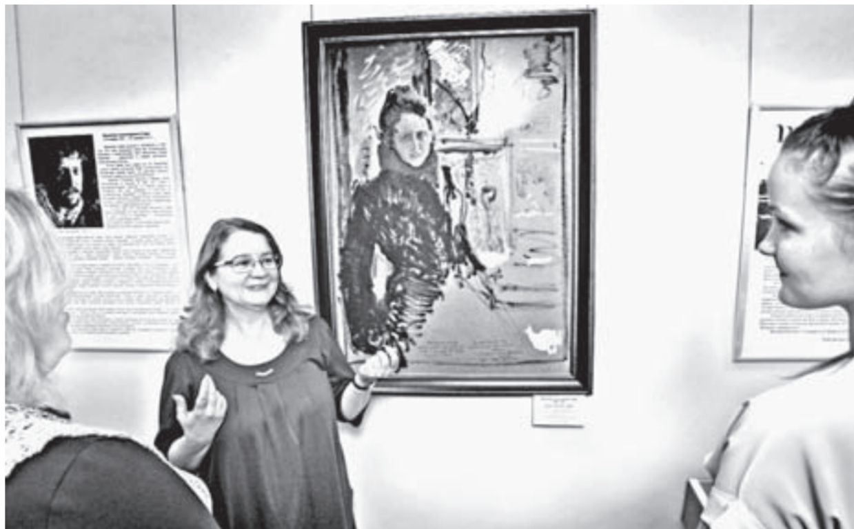
Выставка «Портрет жены художника» приурочена к 155-летию Валентина Серова.

В день открытия выставки одной картины сотрудники музея решили рассказать посетителям не только о творчестве Валентина Серова, но и о судьбе его жены, которую друзья живописца называли его ангелом. — Серов был знаком с Ольгой Трубиной с юности: она была сиротой