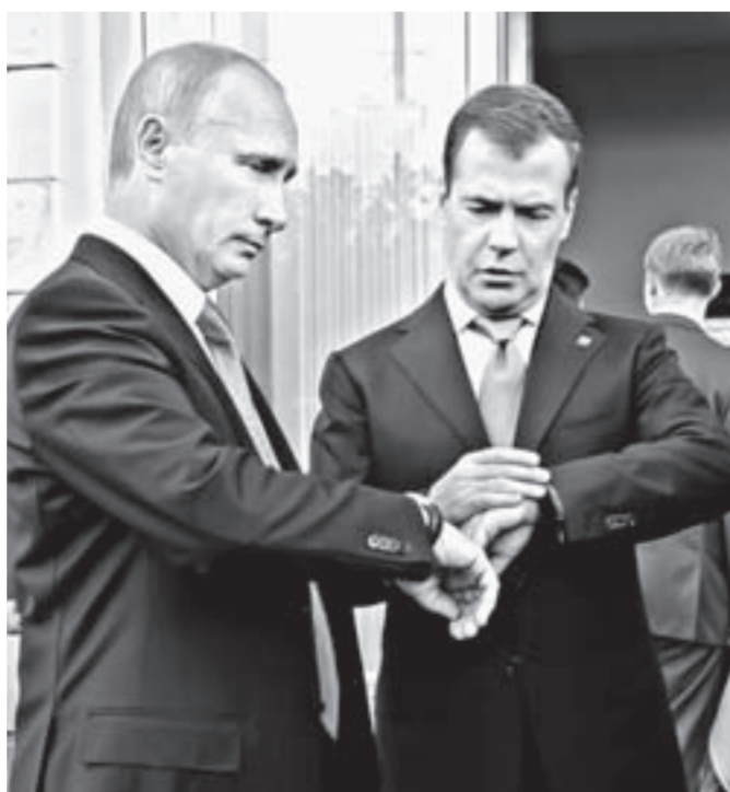
Время уходит, Дмитрий Медведев сказал, что «это была сложная работа, связанная с принятием трудных решений».

По мнению Владимира Путина, президент должен иметь право увольнять премьера или министров в связи с утратой доверия или за неисполнение обязанностей. Еще глава государства предложил проводить назначения руководителей силовых ведомств и региональных прокуроров президентом только