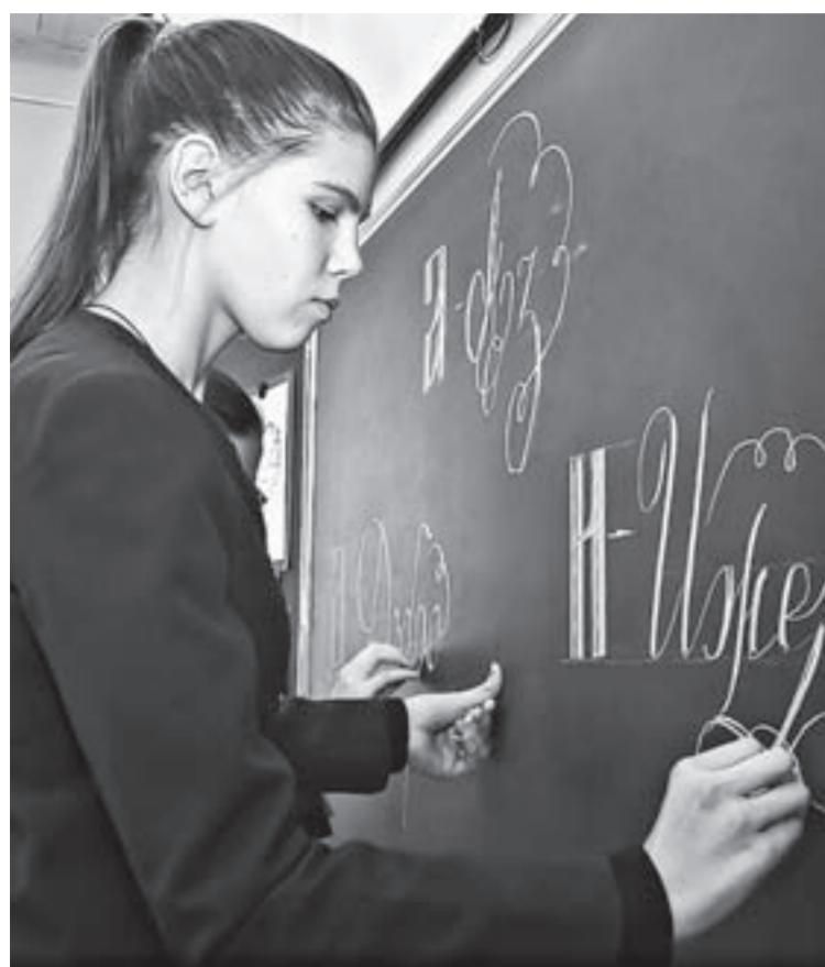
В каллиграфии важны желание и старание.

Сегодня, 23 января, отмечается День ручного письма. В свое время он был учрежден Ассоциацией производителей пишущих принадлежностей (Writing Instrument Manufacturers Association, WIMA) с целью напомнить всем об уникальности ручного письма, о необходимости практиковаться в нем, о неповторимости почерка каждого человека, о каллиграфии.