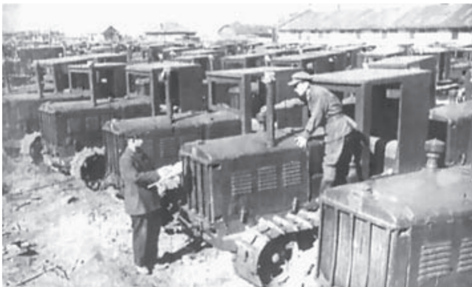
АТЗ был образован в годы Великой Отечественной войны.

Строительство Алтайского тракторного завода началось в 1942 году, когда в Рубцовск прибыло оборудование Харьковского и Сталинградского тракторных