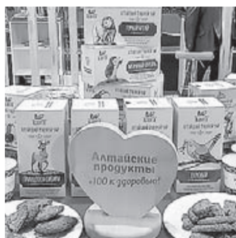
Европейцы, будьте здоровы!

В столице ФРГ продолжается Международная агро-промышленная выставка «Зеленая неделя», в которой принимает участие делегация Алтайского края.