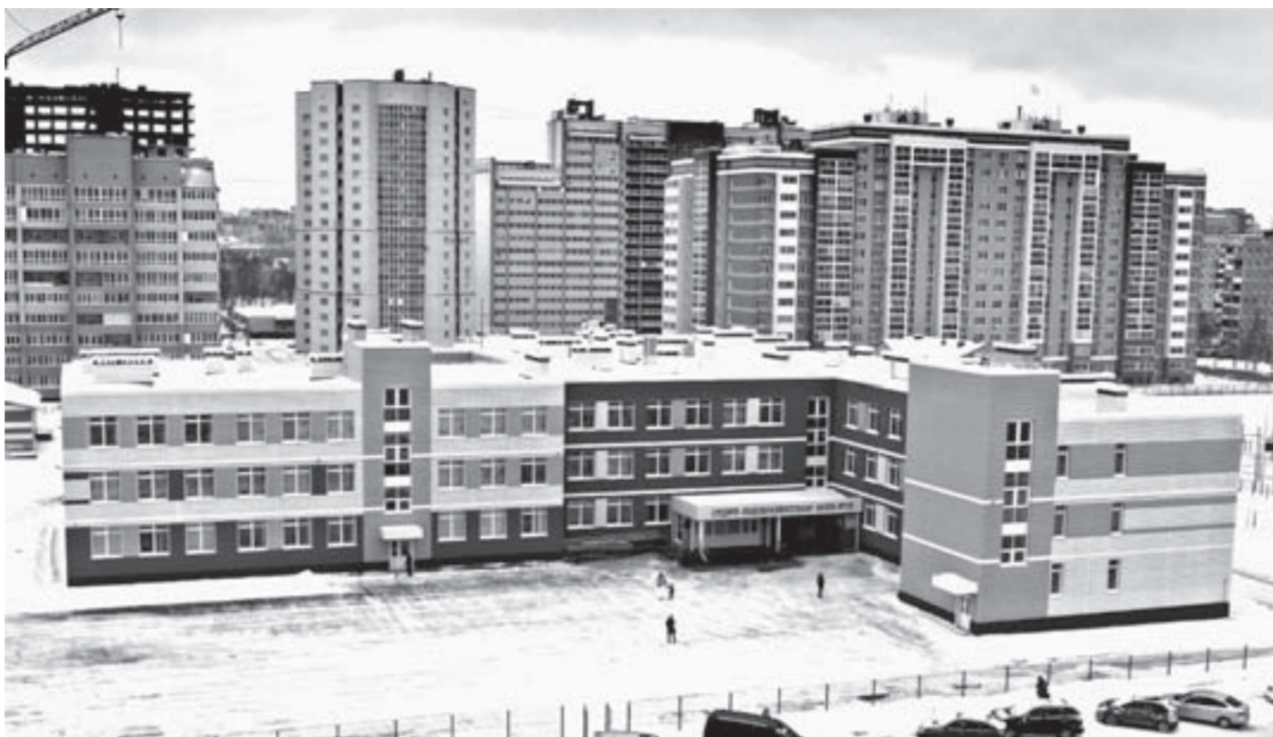
Одна из важнейших задач – развитие образовательной инфраструктуры.

Достигнуты договоренности с муниципалитетами края о повышении подъемных для молодых педагогов. В некоторых из них сумма составит не менее 100 тысяч рублей. Для лучших выпускников педколледжей, которые будут работать в сельских школах, учреждены губернаторские стипендии.