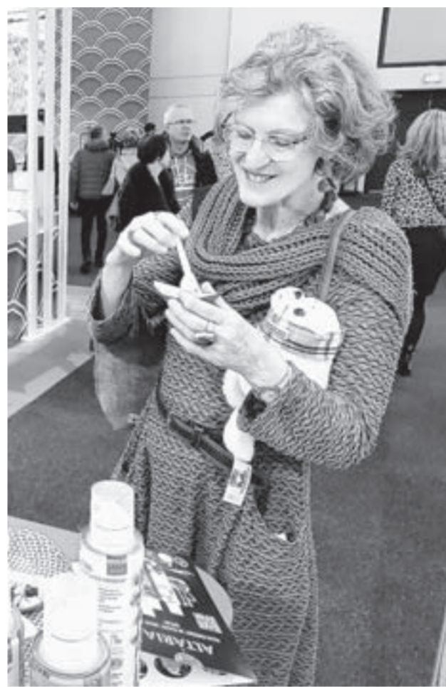
Переводчик не нужен.