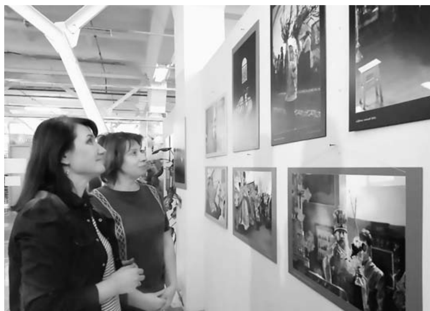
Посетители интересуются православным Бийском.

– Почему вы так редко проводите такие мероприятия, как эта выставка?