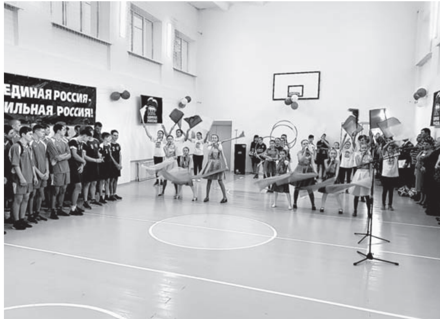
Торжественная церемония открытия спортзала.