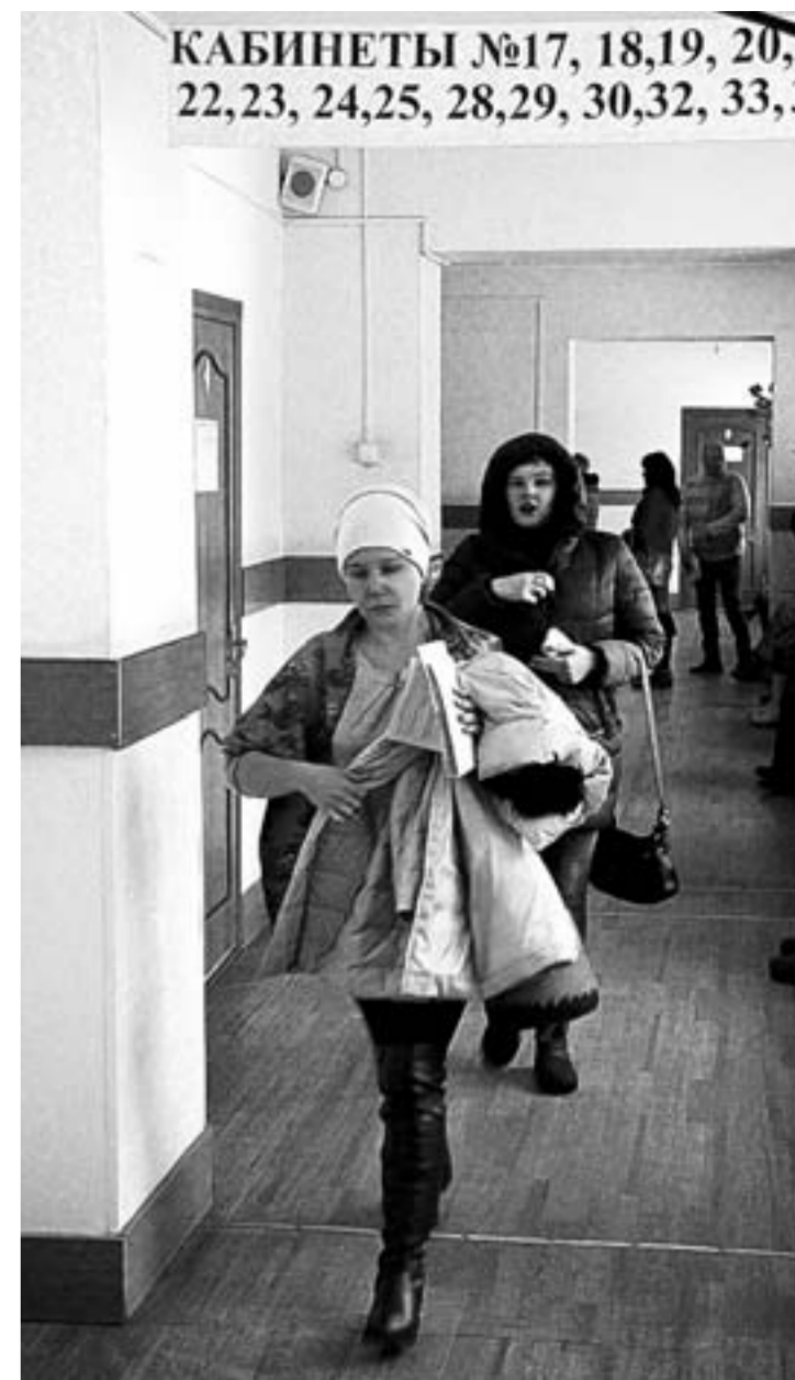
Больные приходят на прием строго по времени, поэтому очереди почти нет.