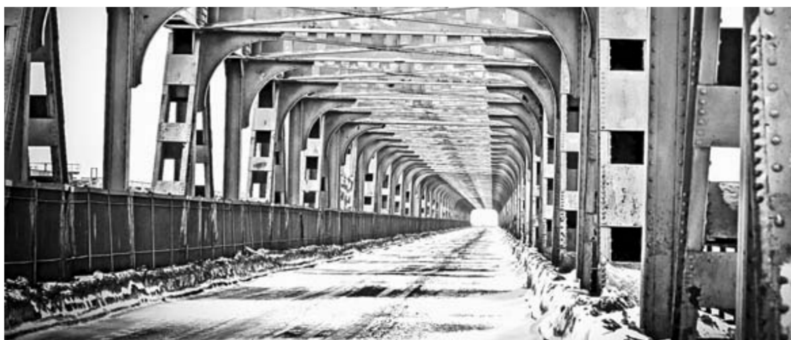
Ремонт Старого моста вынуждает решать и транспортную проблему.