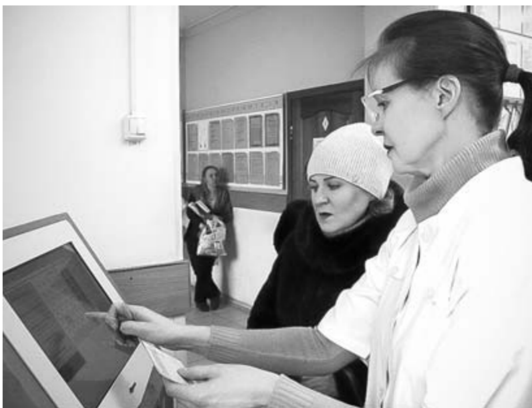
Медработники помогают оформить электронный талон на прием к врачу.