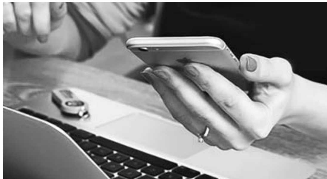
Операторы пересмотрели условия ряда архивных тарифов.

Основные операторы сотовой связи подняли цены на архивные (котормых нет в свободном доступе на сайте. — Ред.) тарифные планы. Сообщения о повышении цен вызвали большой ажиотаж в соцсетях и Интернете. Также прошла информация, что представили ФАС намерены изучить ситуацию. В свою очередь «Алтайская правда» обратилась за комментариями к представителям «большой четверки».