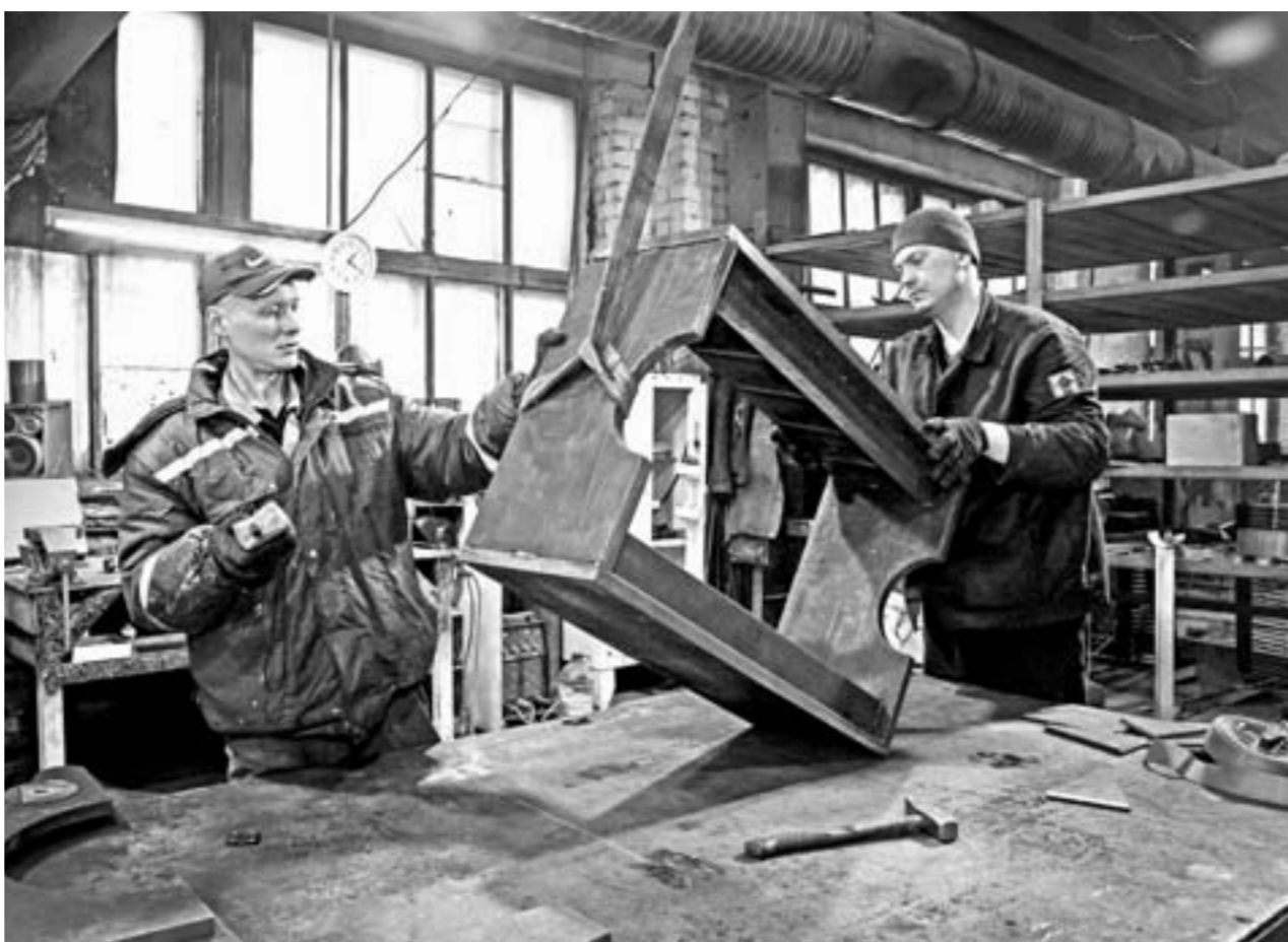
Сделаем – не сломаем!

Так в мае 2017 года появилось на свет барнаульское предприятие «МСК Полимер». Маленький офис, конструктор, маркетолог, начальник производства. Каждый отвечал за свой участок работы, за Коолем было