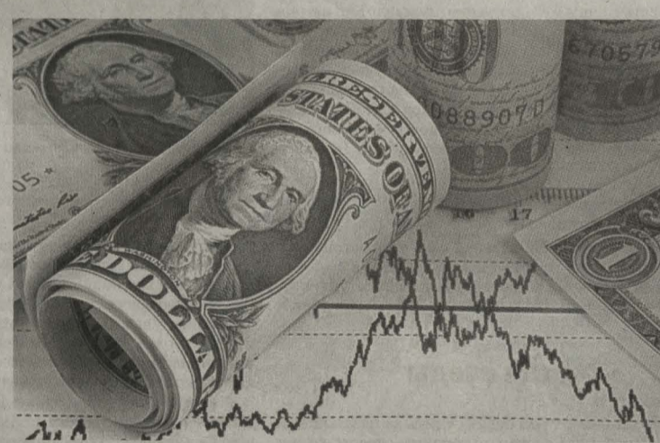
Доллар падает к рублю уже больше месяца.

С позапрошлого года рубль так сильно не укреплялся по отношению к доллару США, как нынче. Попробуем разобраться, что это значит.