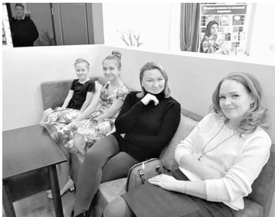
Библиотека стала местом для встреч и общения.