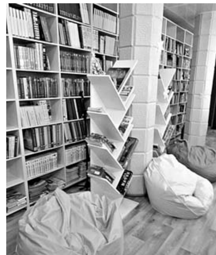
Комфорт и уют читателей ждут.

– Мы укомплектовали новейшим оборудованием, есть ламинатор и брошпуратор, так что теперь можем оказывать и дополнительные услуги, – продолжает руковоитель библиотечной системы. – В библиотеку поступило большое количество