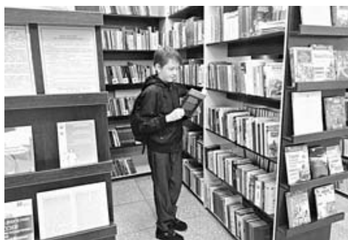
Полторы тысячи новых изданий – есть что выбрать.

В Бийске появилась библиотека нового типа, ломающая все стереотипы.