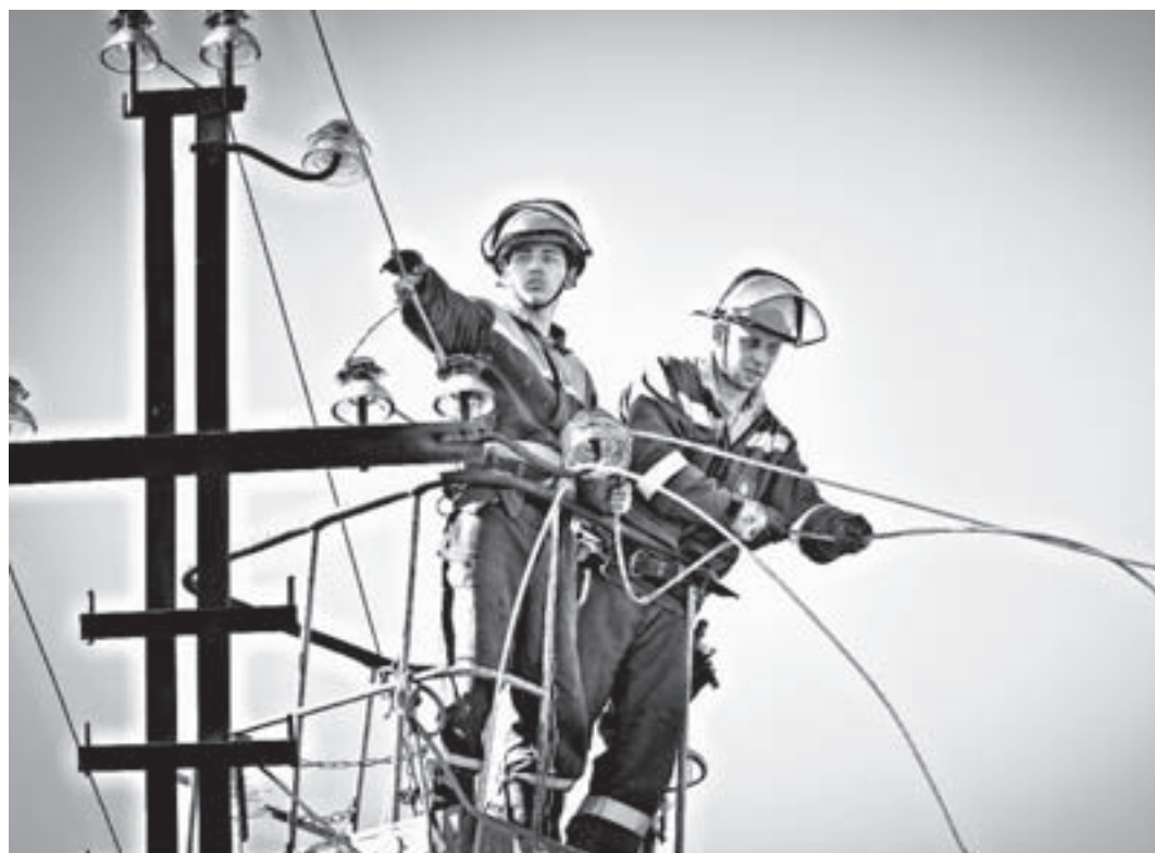
Подготовьте заявку online, и вам подключат электричество.

Обратиться необходимо в организацию, которая занимается поставками электроэнергии на данной территории. О ней можно узнать у соседей, если у них уже произведено подключение, а также получить данные в местной администрации. Бывают ситуации, когда участок расположен на границе зон «ответственности» двух поставщиков элек-