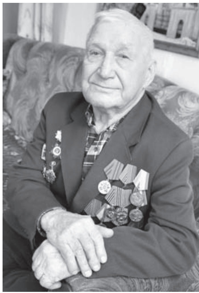
Ветеран на судьбу не обижается.

Он мечтал уйти на фронт, стать героем, как старший брат. Но случилось иначе. После курса молодого бойца его зачислили во взвод 45-миллиметровых пушек 688-го полка 103-й стрелковой дивизии, стоявшей на границе с Маньчжурией.