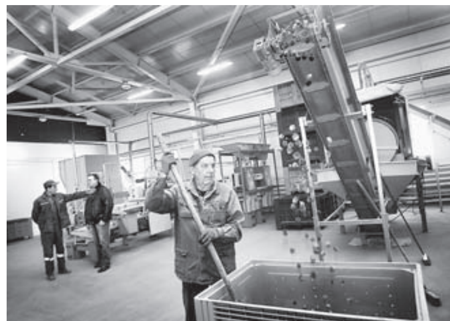
Пустые шишки утилизируют как отходы.

В Алтайском лесосеменном центре в разгаре зимняя страда. Сочетание непривычное, тем не менее именно сейчас здесь кипит напряженная работа – заготавливают семена сосны обыкновенной.