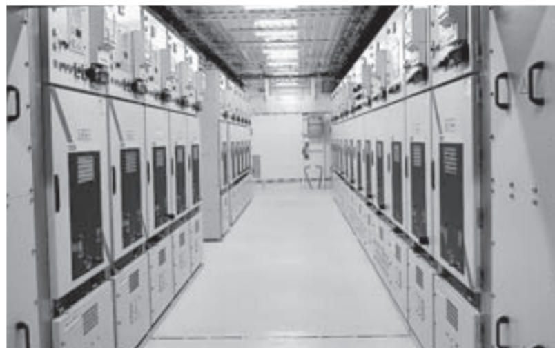
Современное оборудование не требует постоянного присутствия персонала.