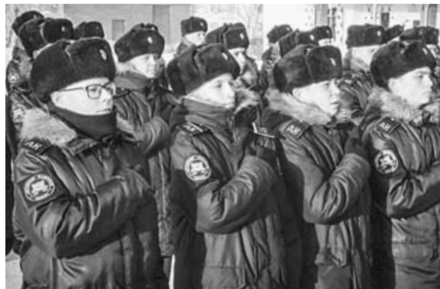
70 кадетов из Сибирского посвятили в юнармейцы.

Как пишет газета «Заря Востока», расставлять все это богатство по комнатам строителям помогают воспитатели. Кстати, теперь по периметру здания и внутри установлены видео-