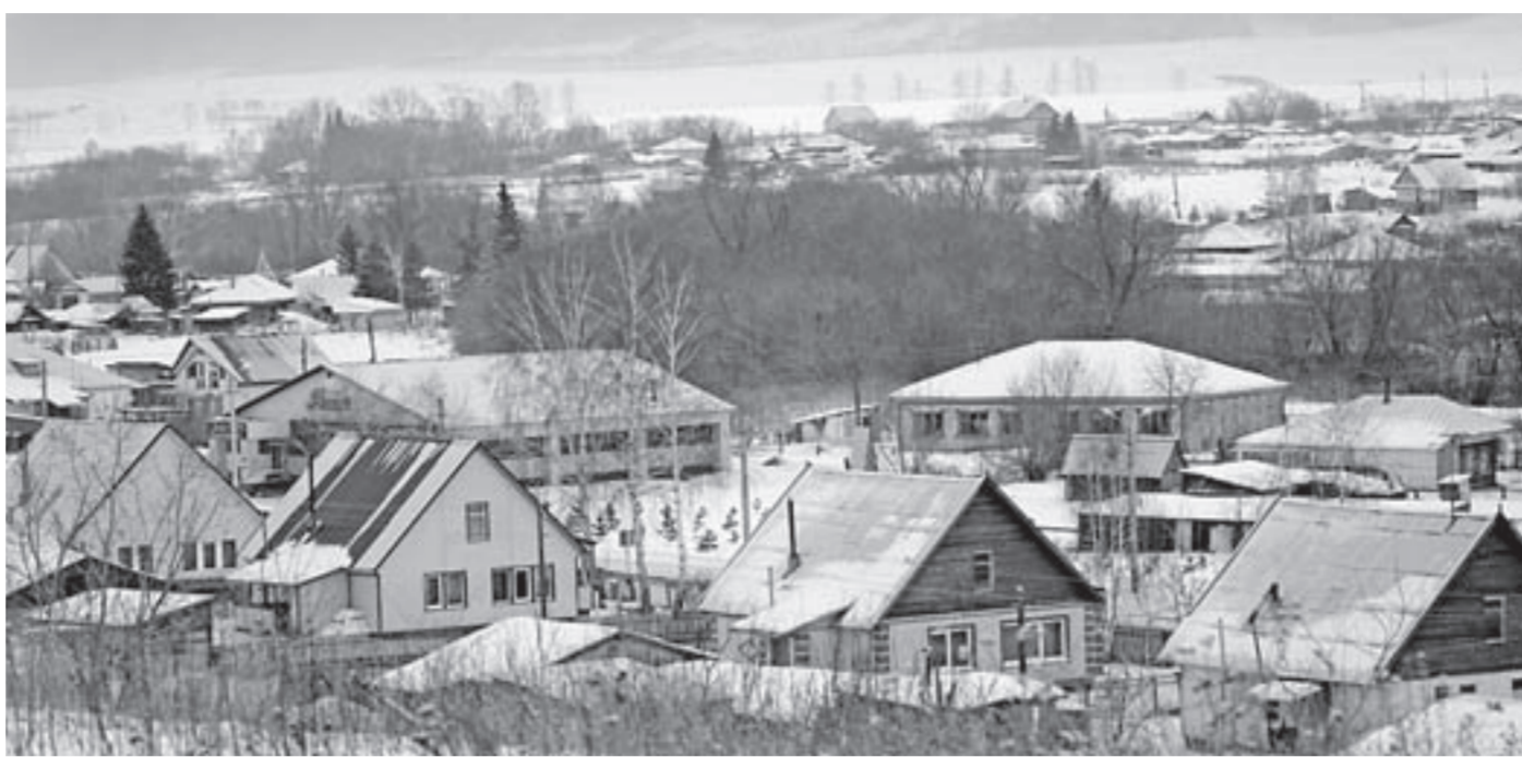
Жизнь на селе должна стать комфортнее.