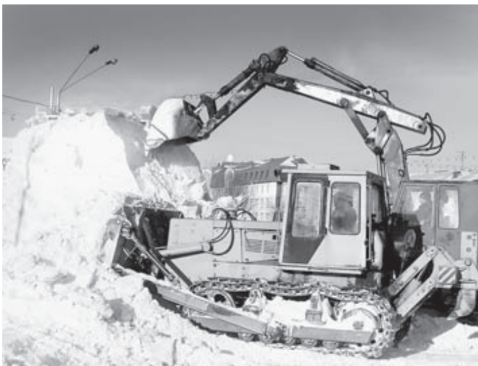
На уборку улиц выходит более 100 единиц городской техники.

Под особым контролем остается движение организованных групп детей. В некоторых районах края из-за непогоды новогодние представления были перенесены на более поздние даты. В других