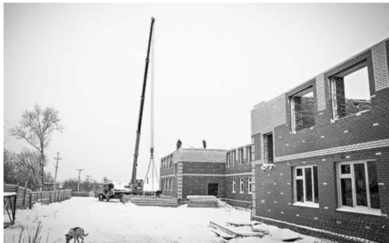
Здание будет соответствовать всем современным требованиям.

Каменцы, глядя на то, как быстро растет в южной части города двухэтажный красавец сад-ясли, с облегчением выдохнули - теперь точно построят. Садик в этом микрорайоне ждют 35 лет. Уже точно известно - в 2020 году двести малышей Камня-на-Оби спрячат новоселье.