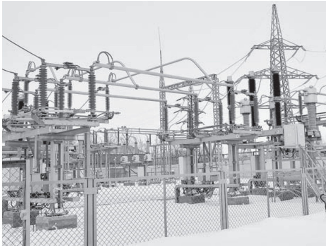
В Рубцовске открылась подстанция «Северная».