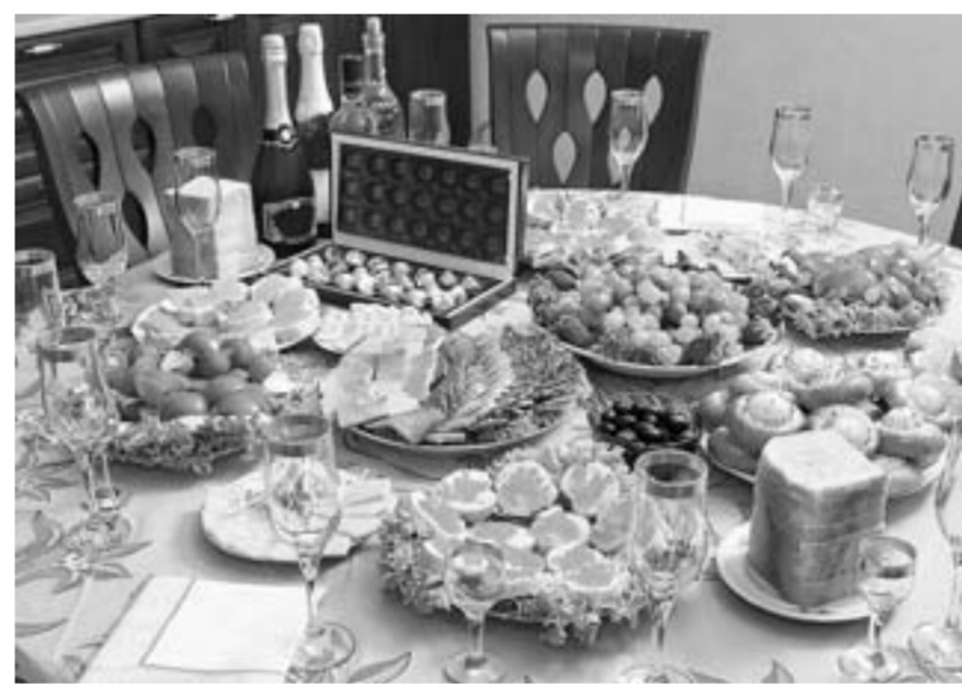
Во всем нужно знать меру.

– Важно знать принципы культурного питья. За вечер количество потребляемого алкоголя не должно превышать 150 г, если речь о крепких спиртных напитках. Шампанское лучше всего просто пригубить. Допускается до 250 г сухого вина, до 1 литра пива. Важно выпивать мелкими дозами и не смешивать крепкий алкоголь между собой, а также с газировкой. Например, виски с колой однозначно приведет к