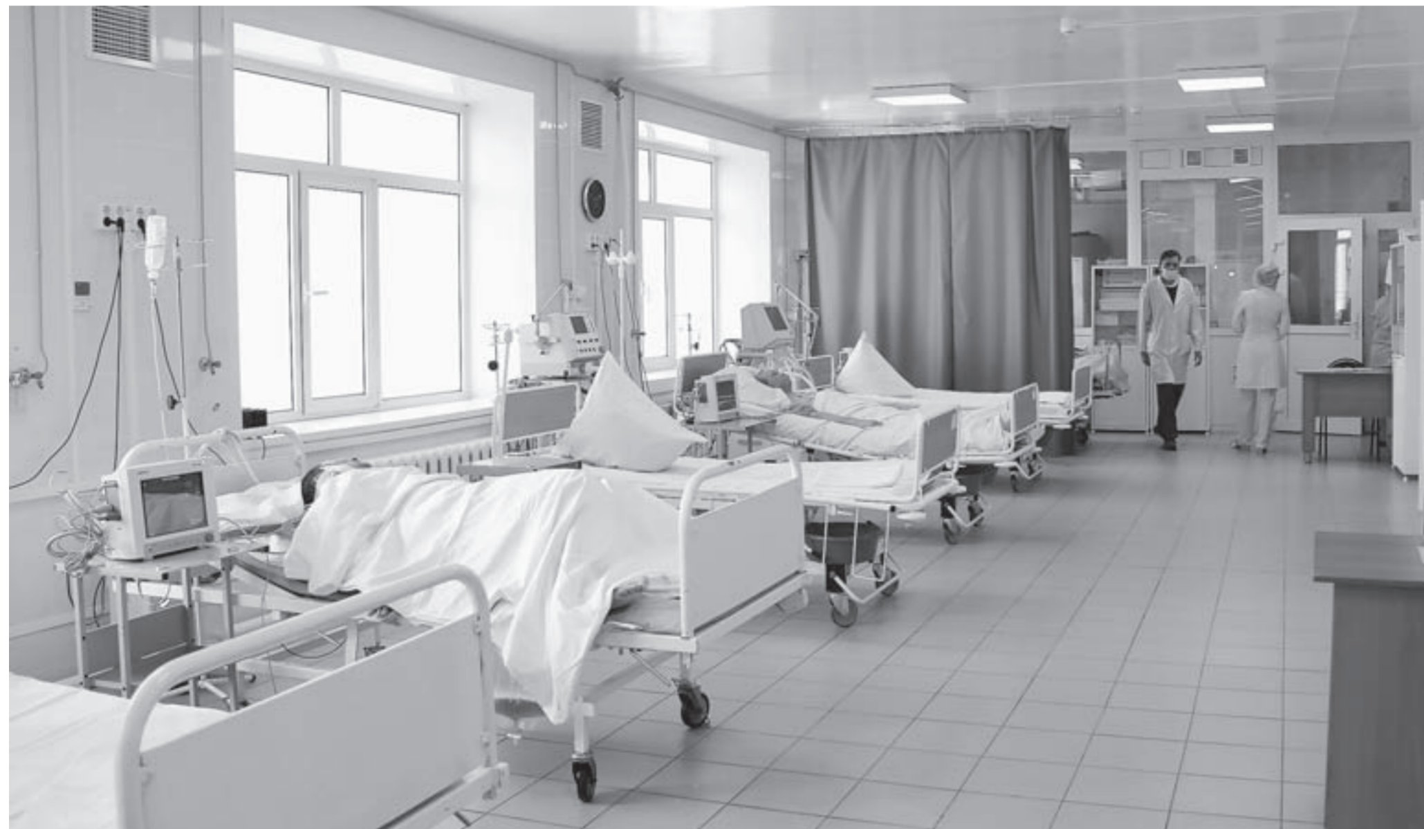
Объединение больниц не приведет к закрытию отделений и сокращениям медицинских работников.

Эти и другие новости читайте на сайте: www.ap22.ru