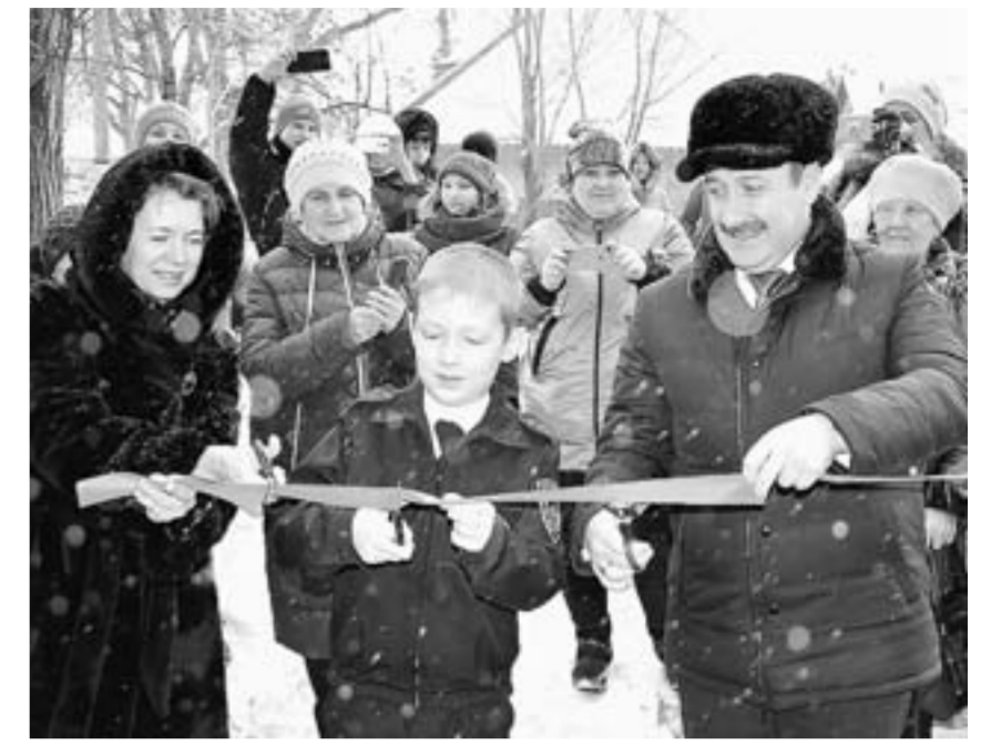
Торжественное открытие модельной библиотеки «Контакт».

По нацпроекту «Культура» в Рубцовске открылась первая на Алтае модельная библиотека.