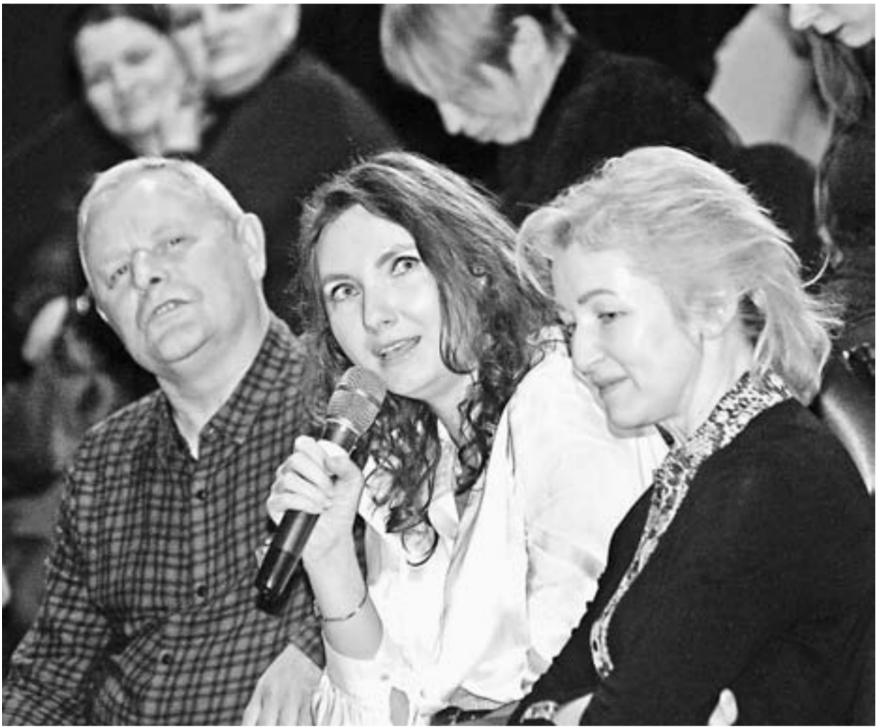
Мнения зрителей об увиденном диаметрально разошлись.