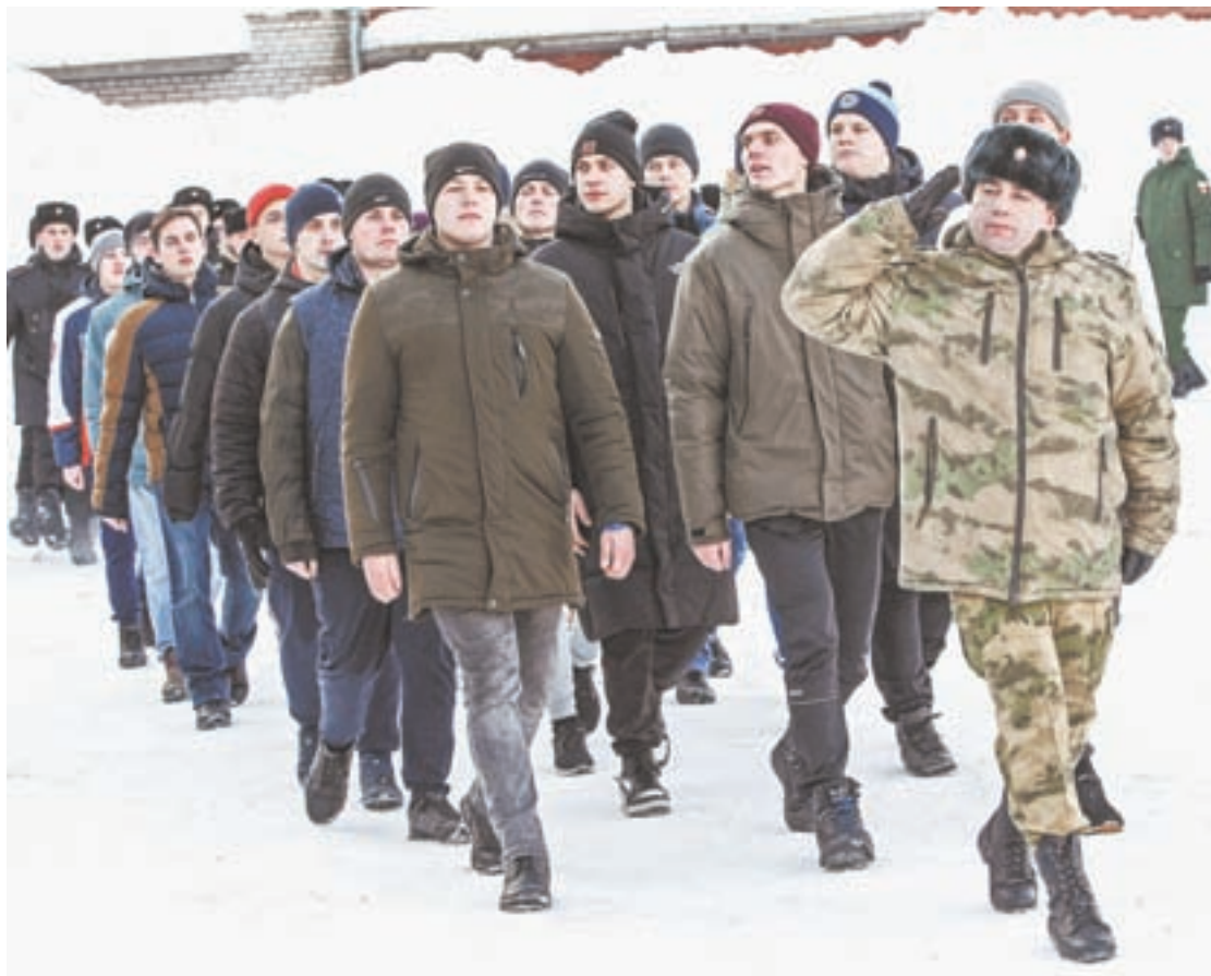
К службе готовы.

– Настроение – боевое. Переживаю только за маму, она расстраивается, что так долго не увидимся. Последний месяц вкусностей готовила в два раза больше обычного. Но мне нельзя набирать вес, поэтому приходилось держать себя в руках!