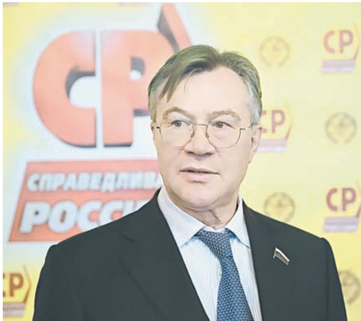
Депутат Госдумы Александр Терентьев.

– Потому что это справедливо и экономически выгодно. Разрыв между богатыми и бедными нужно ликвидировать за счет олигархов – они этого даже не почувствуют. Нам же говорят: «Невозможно администрировать, деньги уйдут в тень». И тут же усиливают налоговую нагрузку на предпринимателей – повышают налог на добавленную стоимость на 2%. Так кого легче администрировать – весь бизнес в стране или олигархов? Также очень туманны их прогнозы о дополнительных сотнях миллиардов от этих нововведений – бизнес не будет сидеть сложа руки и молча погибать, он начнет думать, как выжить в рамках действующего за-