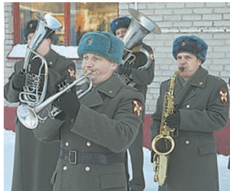
Во время митинга.

Отбор новобранцев для службы в Президентском полку проводится в Алтайском крае с 2008 года. Ежегодно 30 наших земляков отдают долг Родине в составе престижного воинского подразделения. Кстати,