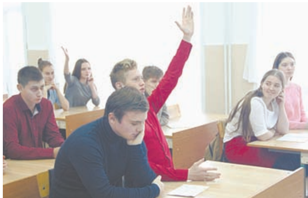
Школьники задавали дружинникам разные вопросы.

«ПЕРЕД ТЕМ КАК ПОСТАВИТЬ ЛАЙК, НУЖНО ТЩАТЕЛЬНО ОЗНАКОМИТЬСЯ С КОНТЕНТОМ: ПРОСЛУШАТЬ ДО КОНЦА ПЕСНЮ, ДОСМОТРЕТЬ ВИДЕО».