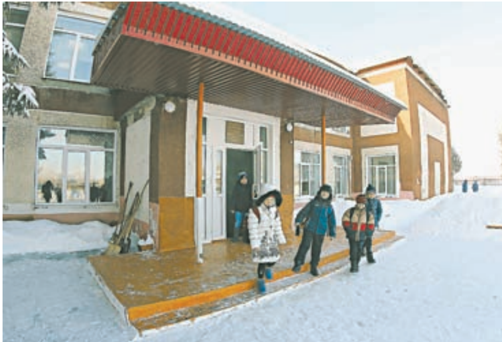
В здании, где располагаются школа и детсад, провели капитальный ремонт.

По программе поддержки местных инициатив за три года в районе реализовано 13 проектов. Все это было бы невозможно без активности населения. В селе Воеводском в 2017 году жители решили сами сделать стадион. Начинание продолжили в рамках программы поддержки местных инициатив. Установили спортивное оборудование, положили асфальтовое покрытие,