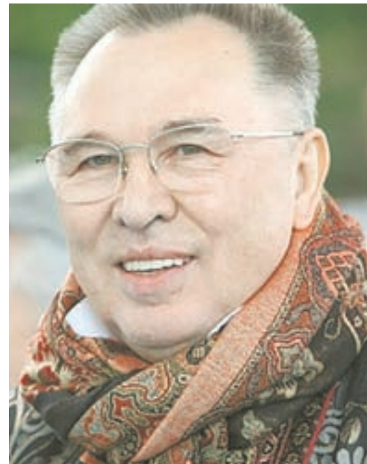
Вячеслав Зайцев оценил алтайский от-кутюр.