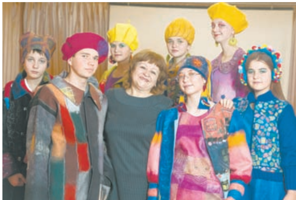
Фешен-команда из Долганки.