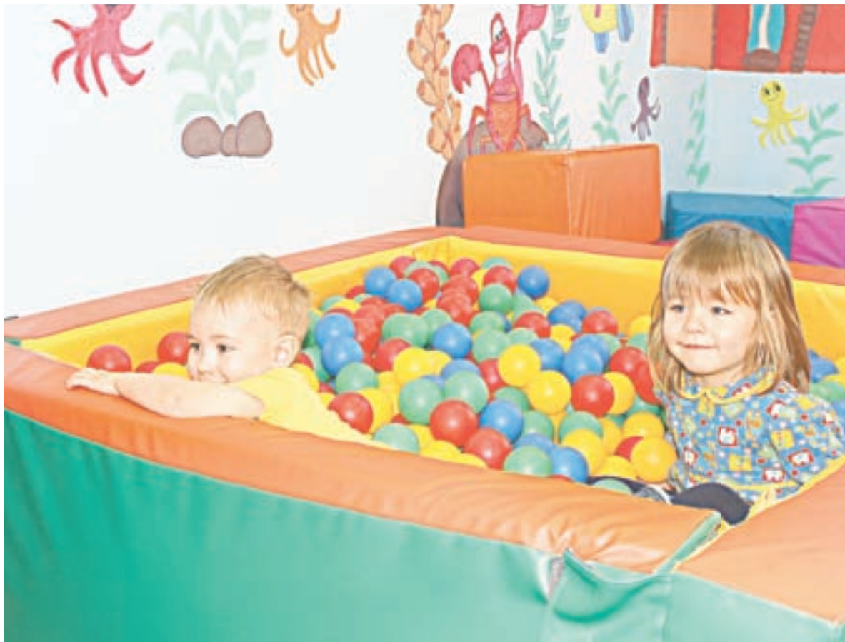
Порой ребят не вытащишь из бассейна с шариками.

– Мы учимся счету, развиваем все высшие психические функции, внимание, память, мыш-