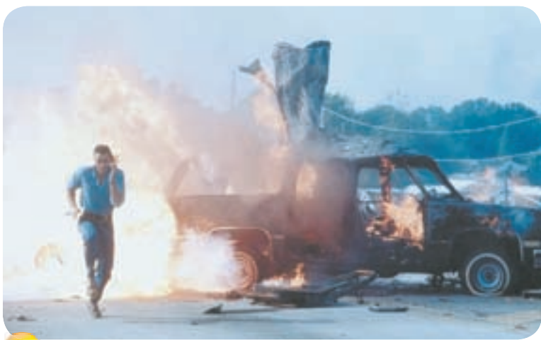
20.00 Х.ф. «ТРУДНАЯ МИШЕНЬ» (16+)