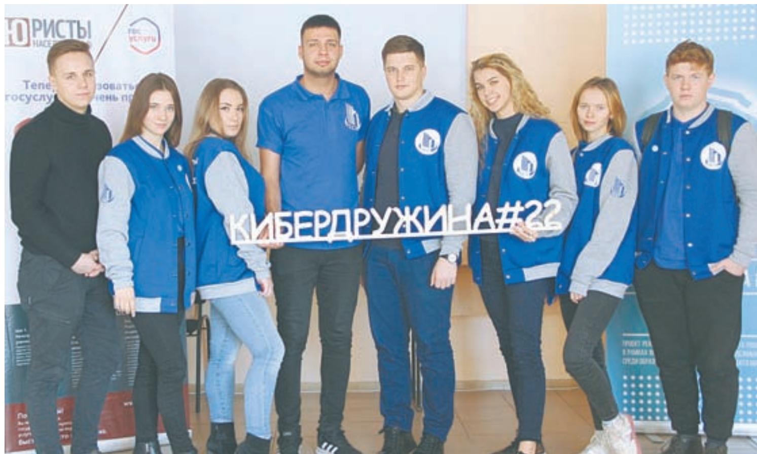
Онлайн-дружинники помогают школьникам распознать экстремизм в Интернете.

– Тревогу необходимо бить в тех случаях, когда в Интернете унижают и оскорбляют по расовым, национальным и религиозным признакам. Перед тем как поставить лайк, нужно тщательно ознакомиться с контентом – прослушать до конца песню, внимательно посмотреть видео. Если у вас возникли сомнения, скопируйте адрес и пройдите на официальную страницу Роскомнадзора. Там есть пункт: «Обращения