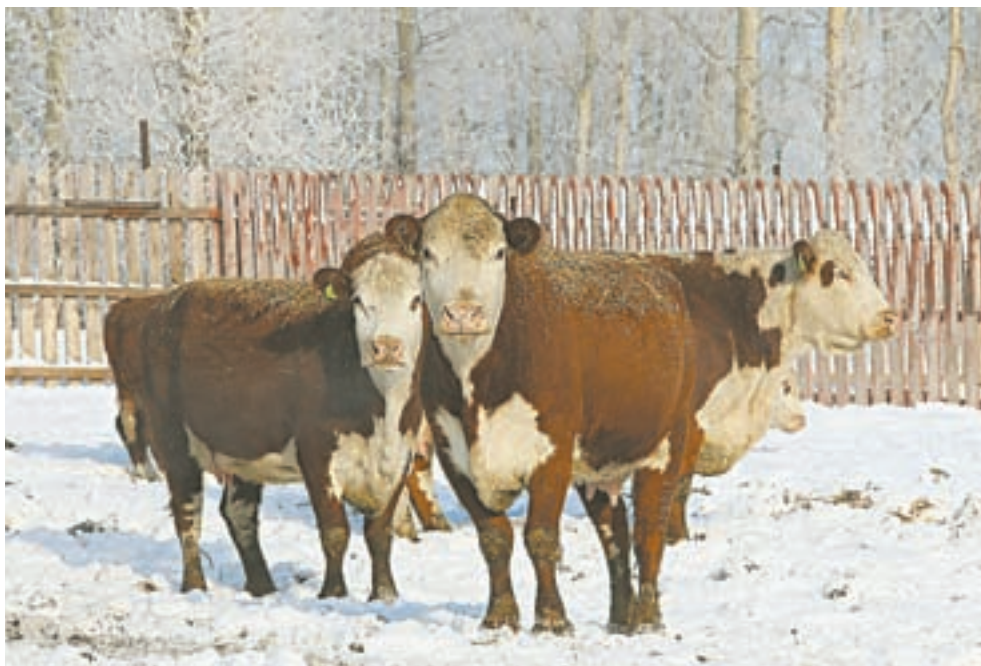
В одном из крупных животноводческих хозяйств района – ООО «Фарм».

построили площадку для игры в стритбол и так далее.