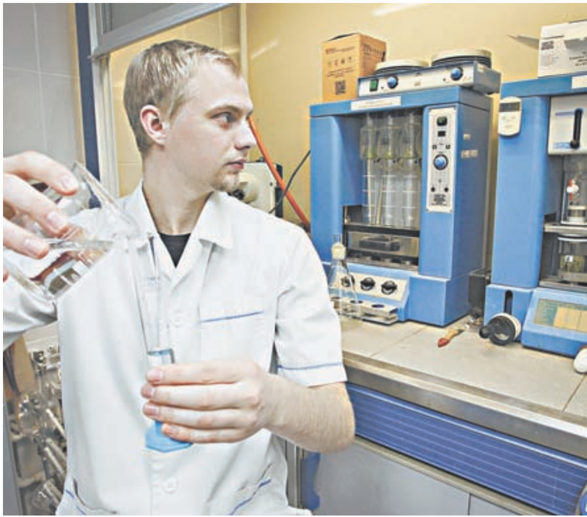
Наука решает множество задач экономического развития региона и страны.

В Алтайском филиале РАНХиГС прошла стратегическая сессия «Перспективы создания научно-образовательного центра в Алтайском крае».