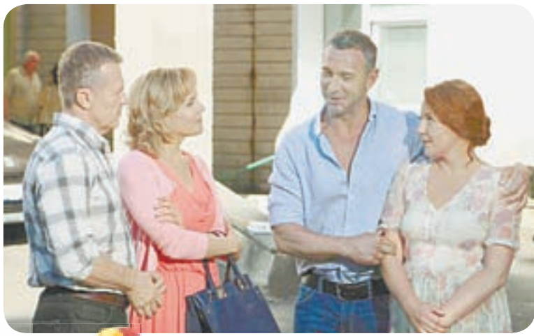
19.00 Х.ф. «ДВА ПЛЮС ДВА» (16+)

05.05 Т.с. «Топтуны» (16+) 06.00 Утро. Самое лучшее (6+) 08.05 Мальцева (12+) 09.00 Т.с. «Шелест. Большой передел» (16+) 10.00 Сегодня 10.20 Т.с. «Шелест. Большой передел» (16+) 13.00 Сегодня 13.25 Обзор. Чрезвычайное происшествие 14.00 Место встречи (16+) 16.00 Сегодня 16.25 Следствия вели... (16+) 17.10 ДНК (16+) 18.10 Т.с. «Пес» (16+) 19.00 Сегодня 19.40 Т.с. «Пес» (16+) 23.15 Сегодня 23.25 «Своя правда» с Романом Бабаевым (16+) 00.30 Захар Прилепин. Уроки русского (12+) 01.05 Т.с. «Четвертая смена» (16+) 03.05 Дембеля. Истории солдатской жизни (12+) 04.20 Т.с. «Топтуны» (16+)