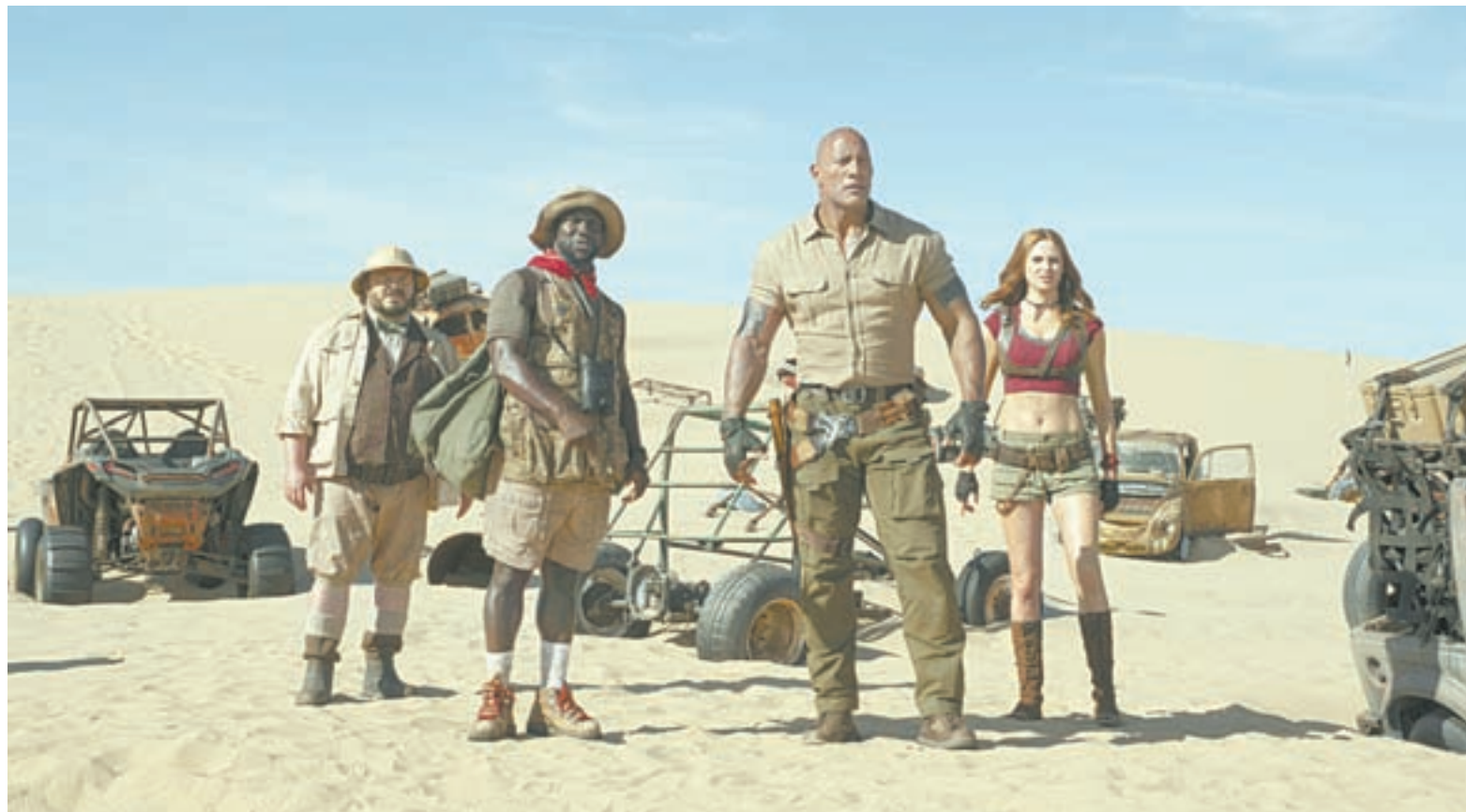
Главных героев опять затягивает в опасную видеоигру.

В 2017-м главными действующими лицами были старшеклассники, в наказание оставленные после уроков разбирать хлам в школьном кабинете, причем фильм держался на комическом несоответствии личностей подростков и их игровых персонажей. Ботаник-ипохондрик Спенсер стал высочен-