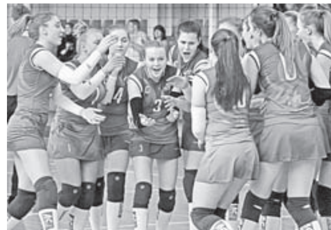
Алтайские волейболистки перед матчем.

И УДАРЫ, И ПОДАЧИ, И ИГРА НА БЛОКЕ У НИХ НЕ ПРОСТО ПОЛУЧАЛИСЬ, А ИСПОЛНЯЛИСЬ С КАКИМ-ТО ШИКОМ И БЛЕСКОМ!