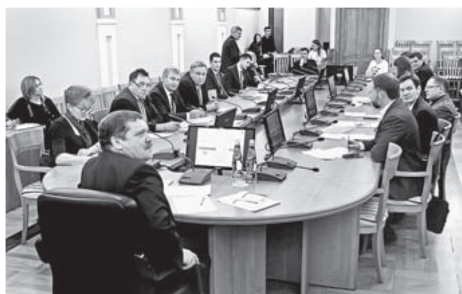
Во время защиты проектов.