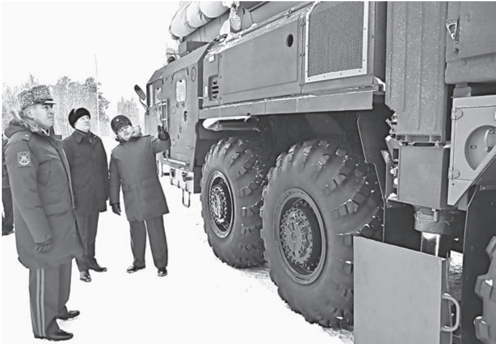
Губернатор Виктор Томенко (в центре) оценил вооружение дивизии.

– Ракетные войска стратегического назначения – гордость и основа безопасности нашей страны,