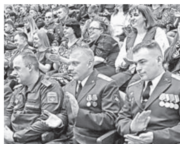
В день РВСН для личного состава прошел концерт.