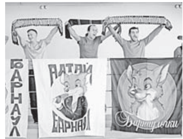
Группа поддержки нашей команды.