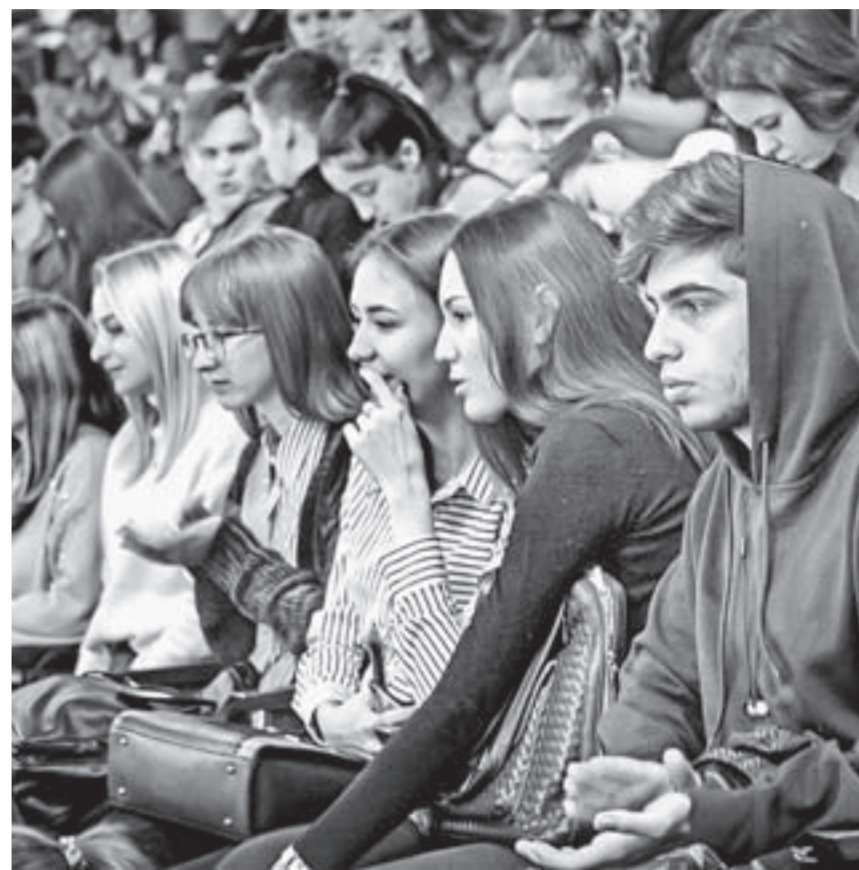
«Опора России» делает ставку на молодежь.