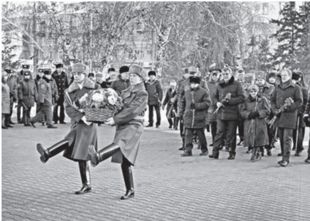
Возложение цветов к мемориалу Славы.