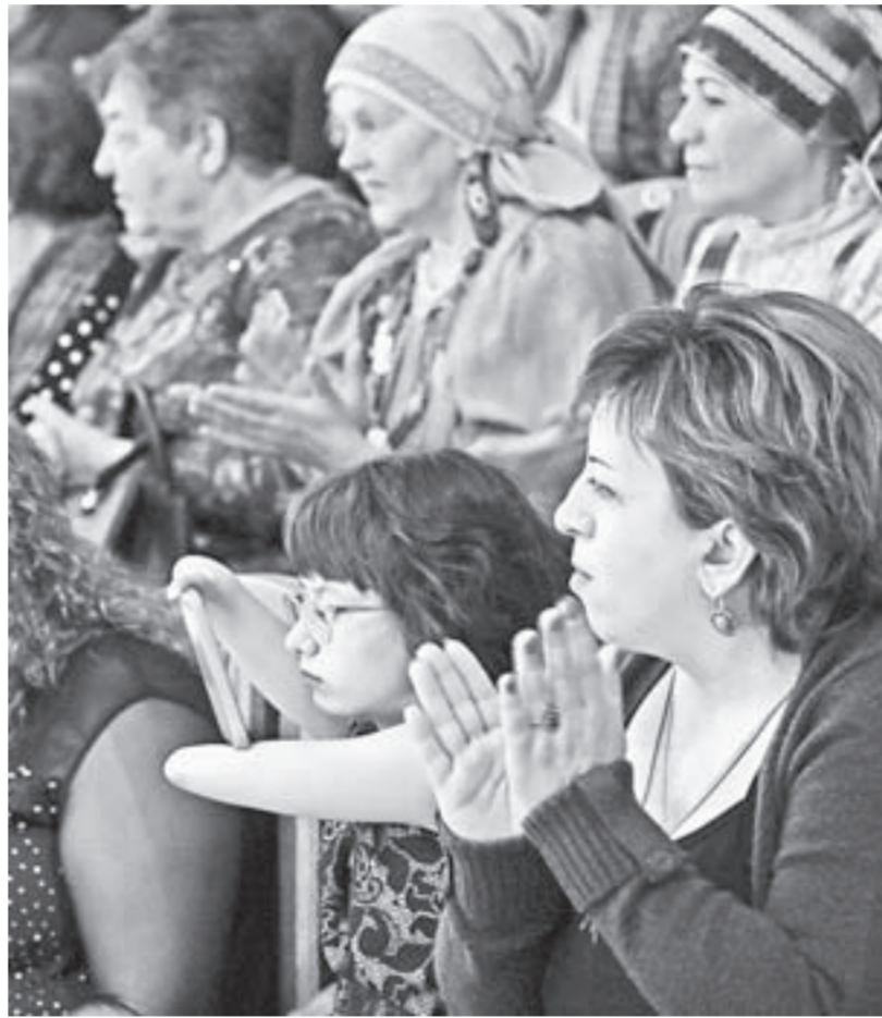
Радость останется в памяти.